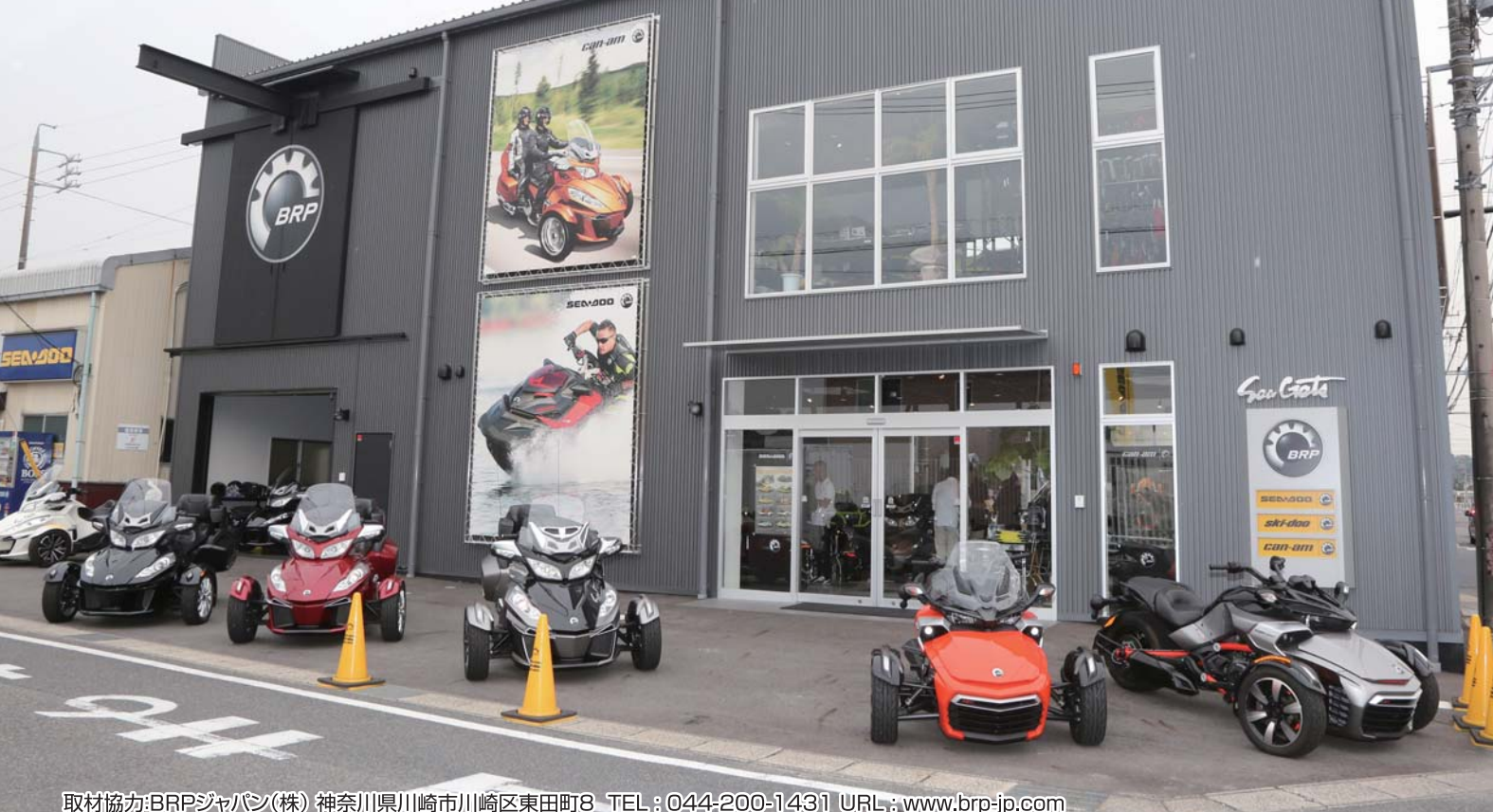
取材協力:BRPジャパン(株) 神奈川県川崎市川崎区東田町8 TEL:044-200-1431 URL:www.brp-jp.com