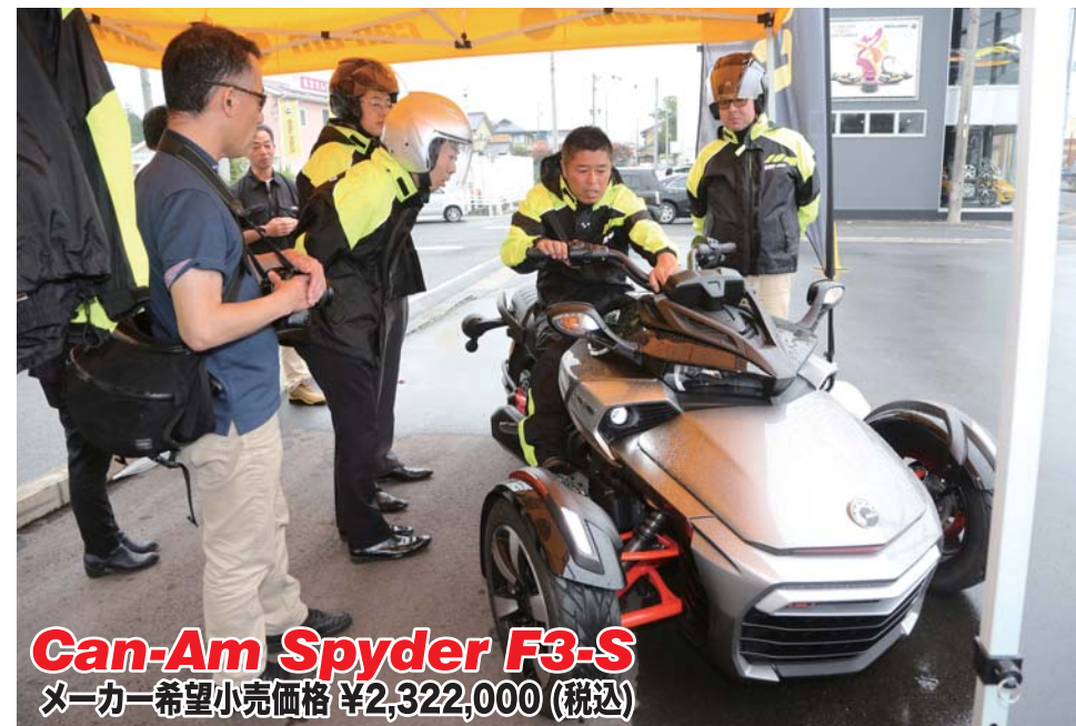
Can-Am Spyder F3-S メーカー希望小売価格 ¥2,322,000 (税込)

やオーナーを集めてのスパイダーツーリングといったイベントも開催しており、年中を通じてユーザーに週末を楽しませてくれるお店である。スパイダーは三輪のため、2輪よりも安定感が高く、初心者でも気持ち良く開放的な走りが楽しめる。また、普通免許でも走行が可能で、2輪より気軽に購入して乗れそうである。天気の良い週末に海岸沿いや高速道路を仲間や恋人と一緒にスパイダーに乗って、爽快なツーリングを楽しんだら最高だろう。シーゲッツでは常時試乗の予約を受け付けてくれるので、この乗り物には是非1度乗ってみて欲しい。