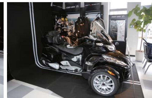
2FにはSEA-DOOの人気モデルを中心にPWCが多数展示され、PWCの関連商品も豊富なストックを誇る。1Fにはスパイダーがズラリと展示されている。取材協力:(有)シーゲッツ 愛知県尾張旭市狩野町4丁目16-1 TEL 0561-52-5600 URL www.seagets.com/