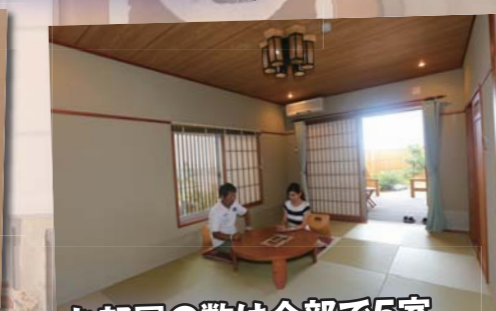
お部屋の数は全部で5室