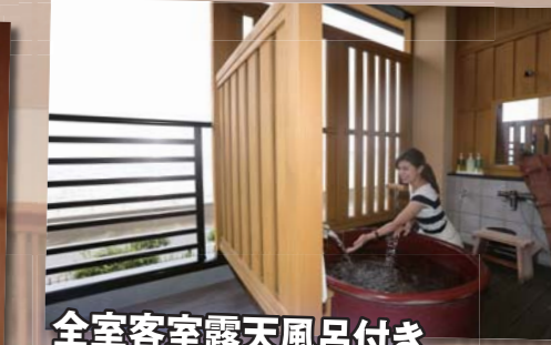
全室客室露天風呂付き