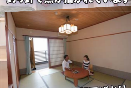
清潔感のあるお部屋ばかり