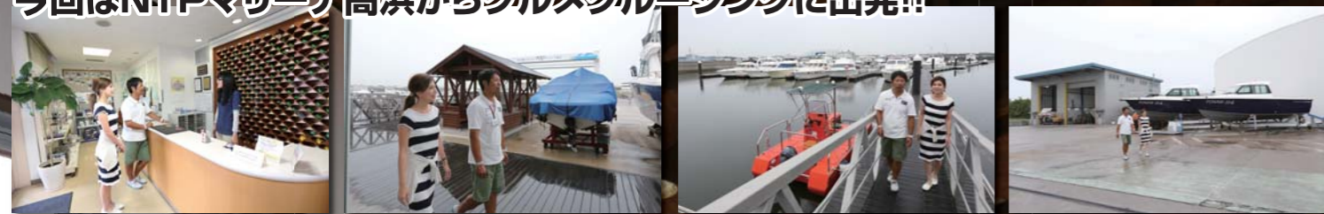
取材協力 NTPマリーナ高浜 愛知県高浜市青木町1丁目1番地 TEL 0566-54-5300 URL http://www.ntp.co.jp/marina/