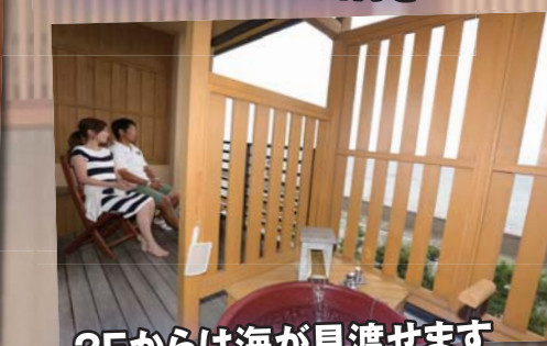
2Fからは海が見渡せます