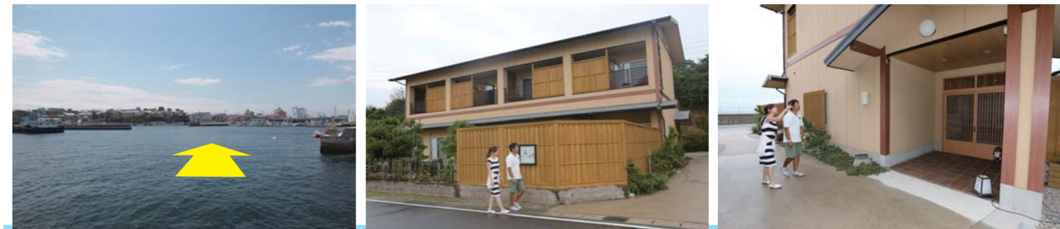
※必ず御自身で海図、GPS、魚探、天気予報等をご確認の上、安全に十分注意してお出かけ下さい。トラブル等発生致しましても当社及び登場する各関連会社、お店は一切責任を負いません。