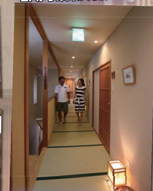
館内はどこも綺麗でした

ルー징に出発です。今回の航路としてはマリーナを出発後に衣浦湾を航行し、三河湾に出てから日間賀島を目指し、日間賀島の北港に入港するルートです。注意点としては事前にお宿に連絡し、ポートで行きたい旨を必ず連絡しておいて下さい。また、航路では大型船の航行もあるので、しっかりと安全確認を行い、引き波には注意して下さい。マリーナから日間賀島へは約40分程で到着出来ました。北港に到着後はお宿に連絡し、係留場所の確認を行って下さい。係留後は迎いの車が用意されているので、そのままお宿へ直行する事が出来ます。お宿に到着後は館内から撮影していきます。館内は落ち着いた雰囲気でも大人の隠れ家といった感じ。お宿は全部で5部屋あり、きめ細やかなサービスをするには最適な部屋数です。また、全ての部屋に客室露天風呂が付いており、旅の疲れも癒してくれます。館内