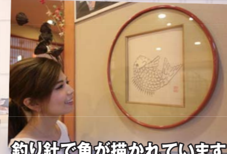
釣り針で魚が描かれています