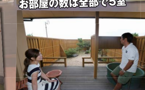
いつでもお風呂が楽しめます