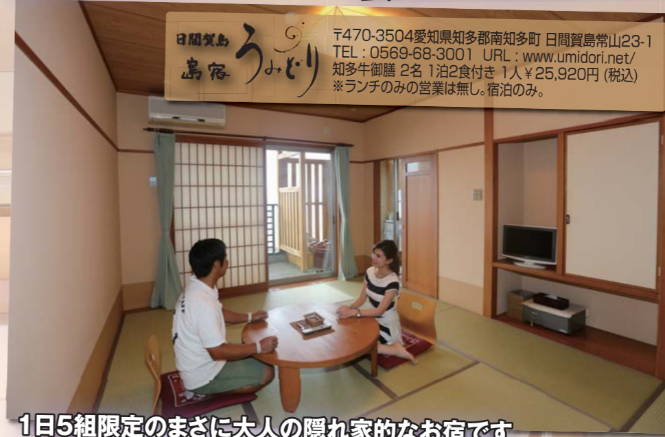
1日5組限定のまさに大人の隠れ家的なお宿です