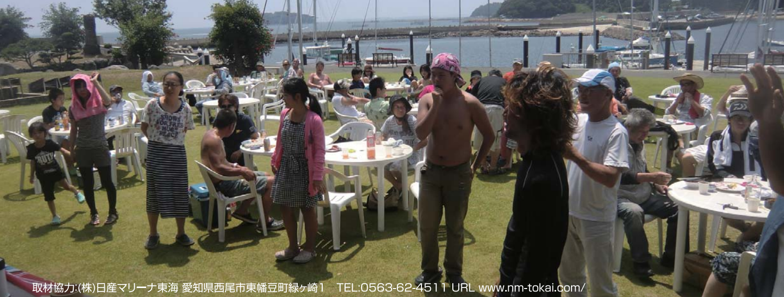
取材協力:(株)日産マリーナ東海 愛知県西尾市東幡豆町緑ヶ崎1 TEL:0563-62-4511 URL www.nm-tokai.com/