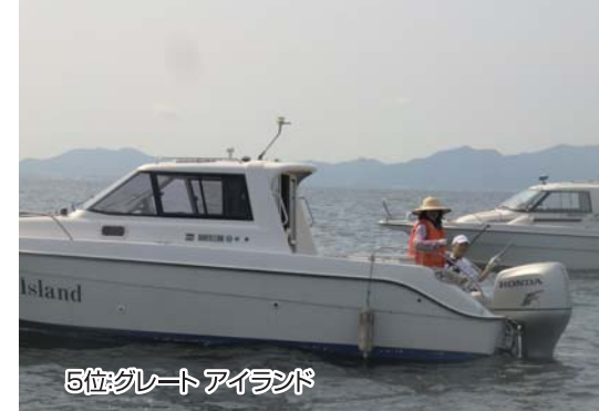
5位:グレート アイランド