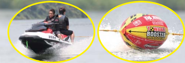
ブースターボール ¥18,000(税別)

今回はSEA-DOO WAKE155でトーイング!! ブースターボールも使って最高の遊びを体感!!