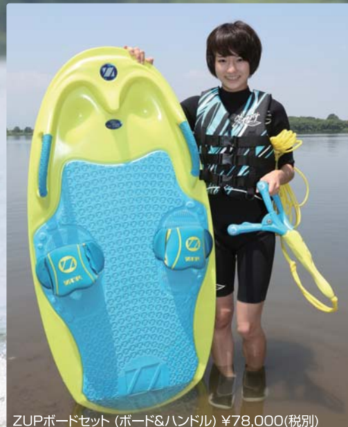
ZUPボードセット (ボード&ハンドル) ¥78,000(税別) アメリカで誕生したニューアイテムが日本上陸!!