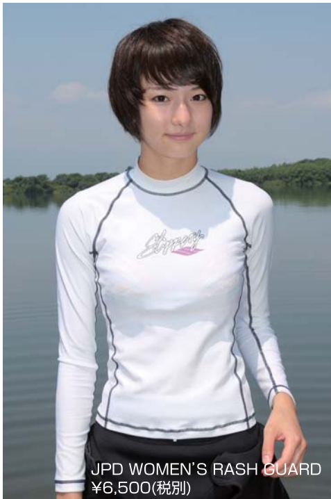
JPD WOMEN'S RASH GUARD ¥6,500(税別)