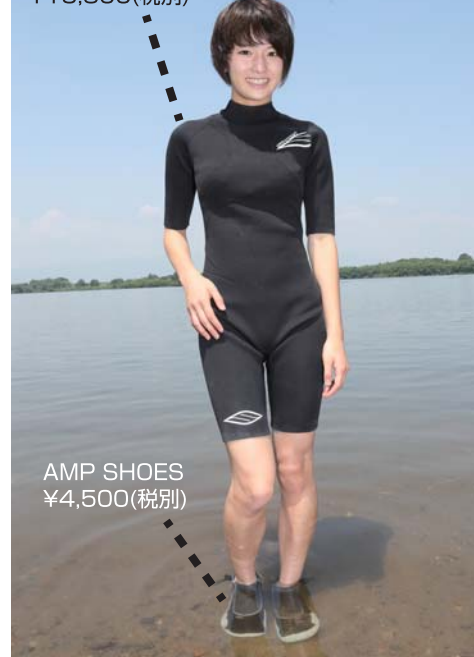
AMP SHOES ¥4,500(税別)