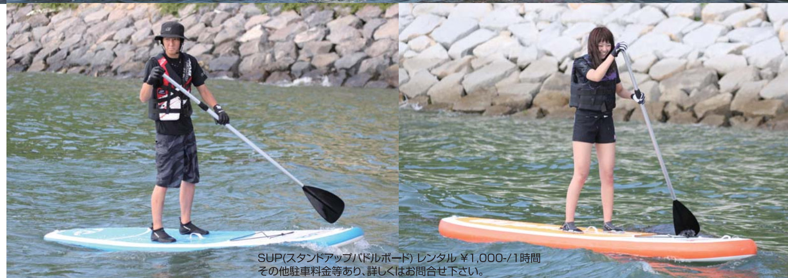
SUP(スタンドアップパドルボード) レンタル ¥1,000-/1時間 その他駐車料金等あり、詳しくはお問合せ下さい。

してくれたのは、爽やかな好青年の高橋君と綾子ちゃん!! レンタルPWCではスパークの爽快感を味わい、SUPでは仲良くバランスを取りながらSUPを乗りこなしていた。フライボードでは適確なアドバイスを元にとても気持ち良さそうに水の上を飛び、最高の一日を楽しんでいた!! 皆さんも是非一度、抜群のロケーションのゲレンデで、今人気のマリッジジャーをとことん満喫して見てはいかがですか!?