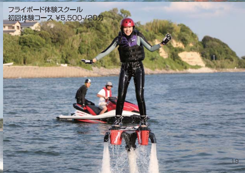
フライボード体験スクール 初回体験コース ¥5,500-/20分