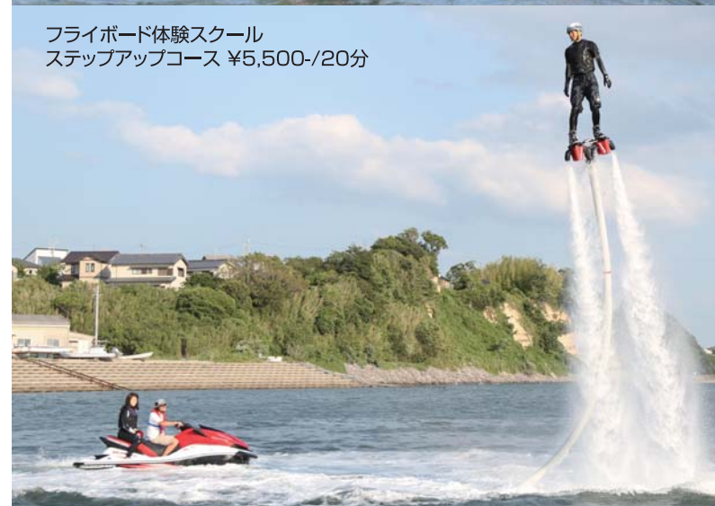
フライボード体験スクール ステップアップコース ¥5,500-/20分