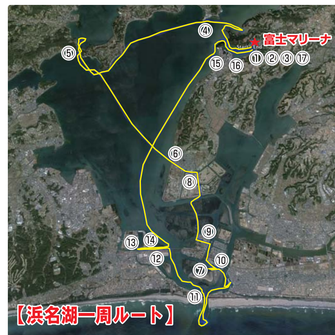
【浜名湖一周ルート】

戻ってきたスパークのテスト数値を確認する。結果は2人乗りで4.81km/L、そして3人乗りでも4.37km/Lという素晴らしい数値を記録していた(数値詳細はページ上部の表を参照)。所要時間の2時間11分の間は、ツーリング時と同様にスピードを出したり、波に乗って飛び跳ねてみたりと、スパークを楽しむため、速度も高速と低速の両方を試しており、決してゆっくり走っていただけの数値ではない。まず1つ目のテストから驚きの燃費効率を発揮してくれたスパークに対して、自然と2つ目のテストの期待が膨らんで来る。2つ目のテストは一定の速度で30分間走り続けて燃費の検証を行う。水面も穏やかな浜名湖を走り続けること30分。出てきた数値は2人乗りが4.84km/L、3人乗りが5.02km/Lとこちらも非常にレベルの高い数値が出てきた(数値詳細は前ページ上部の表を参照)。一定速度テストは2回行ったのだが、こちらでは2人乗りが4.91km/L、3人乗りが5.10km/Lと近似値が計測され、今回の数字がマシンの持つ本来のパフォーマンスであるという事を証明してくれた。この夏全国各地で盛り上がりを見せているスパークは、自分好みにアレンジ出来る見た目だけでなく、爽快な加速感と機敏なコーナリング性能、そして、今回の検証で明らかになった抜群の低燃費性能を兼ね揃えた万能タイプの乗り物である事が分かった。