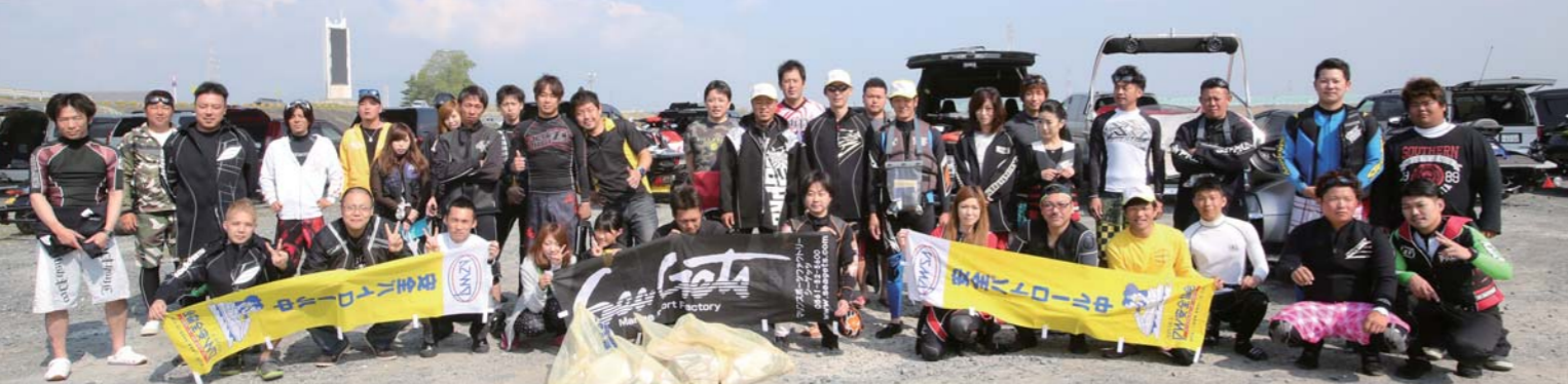
取材協力:(有)シーゲッツ 愛知県尾張旭市狩宿町4丁目16-1 TEL 0561-52-5600 URL www.seagets.com/