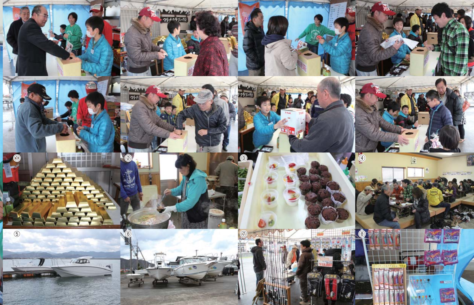
①景品の中には何段にも積み上げられた金塊!!ではなく黄金のティッシュ!!②マリーナ名物「おかあちゃんのシシ鍋」は極上の1品!!③美味しいスイーツは完成度も高い④クラブハウスは終始オーナーで大賑わい!!⑤イベント当日はヤマハSR-XとYF-24の展示試乗会も同時開催され、沢山の人が実際に試乗していた。⑥小浜マリーナお勧め中古艇も展示。⑦小浜で大人気のお店「ビック釣具店」も出展。⑧マルキューのデジヤにつける海老ワームは大きな注目を集めていた。

サを使ってあっと驚くサイズの大物を釣り上げてしまう方、ジギングやキャストで青物を次々にキャッチする方、アオリイカを山ほど釣っている方、キス釣りの技術は誰にも負けないキス釣り名人等々、色々な釣りを楽しまれている方がいる。そのため、エサなのかジグを使うのかといった所から、自分に合った釣り方を探しながらマリンライフを楽しむのもこのマリーナで出来る1つの楽しみ方ではないだろうか。また、オ