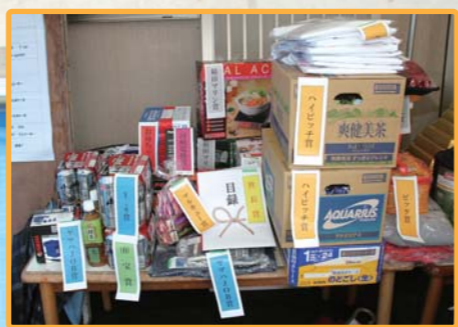
釣具やビール、アウトドア用品等の豪華景品がズラリ!!どれも当たっても嬉しい程の充実した景品が揃いました!!

取材協力: 小浜マリーナ 福井県小浜市甲ヶ崎第9号25番地 TEL: 0770-53-1173 URL: obama-marina.com/