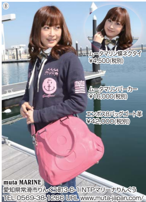
ムータマリン襟ネクタイ ¥4,500(税別)