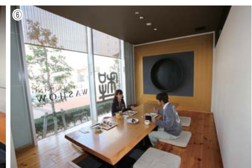
①自分の食べたい料理を好きなだけ食べれます。これがバイキングの醍醐味ですね!!②デザートも種類豊富で女性に人気です!!③ドリンクバーも完備しています。④お洒落なテーブル席は椅子も個性的なデザインでした。⑤こちらでは足を伸ばしてリラックス出来ます。⑥落ち着いた空間で食事を楽しむ事も出来ます。