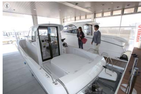
muta MARINE 愛知県常滑市りんくう町3丁目6-1 NTPマリーナりんくう TEL 0569-38-11266 URL www.muta-japan.com/