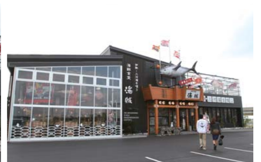
海賊へはNTPマリーナりんくうから徒歩で1~2分程の距離なので、歩いて行く事が出来ます。店舗入口には大きなマグロが飾られていて迫力満点でした!!