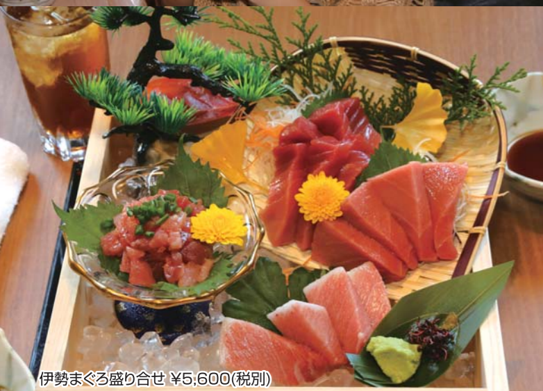
伊勢まぐろ盛り合せ ¥5,600(税別)