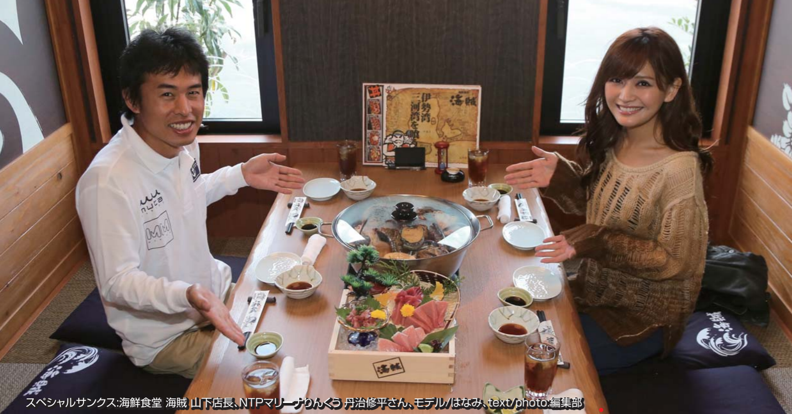
スペシャルサンクス:海鮮食堂 海賊 山下店長、NTPマリーナりんくう 丹治修平さん、モデル/はなみ、text/photo:編集部