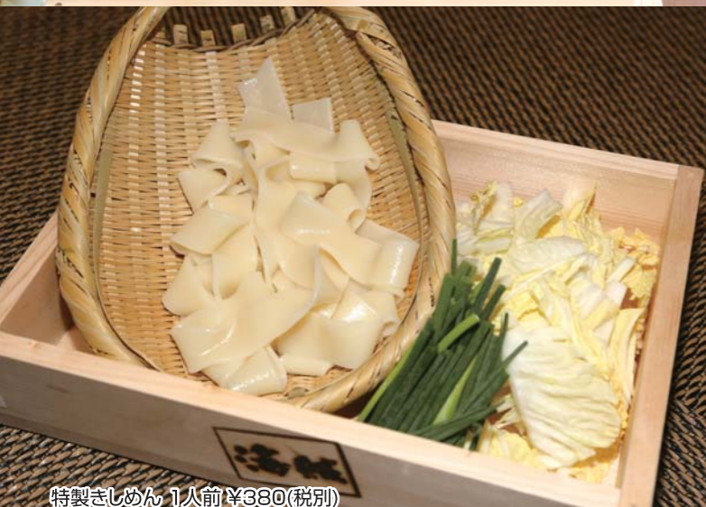
特製きしめん 1人前 ¥380(税別)