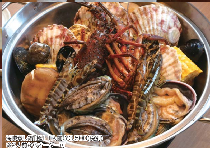
海賊蒸し鍋「極」1人前 ¥3,500(税別) ※2人前からおオーダー可