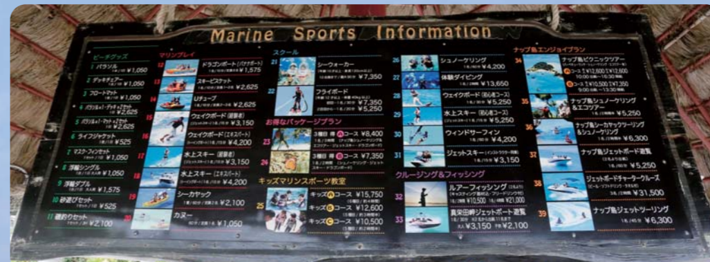
ここで楽しめるマリンスポーツは1日ではとても足りないくらい種類が豊富でどれも楽しそう!! ウェイクボード、PWC、シュノーケリング、釣り等があり、ここを拠点に沖縄が満喫出来ます!!