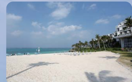
ムーンビーチの砂浜はとても綺麗で、一年中マリンスポーツが楽しめる!!