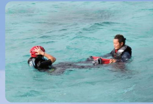
次に水中での動き方や、立ち上がるための姿勢を丁寧に教えてくださいます。