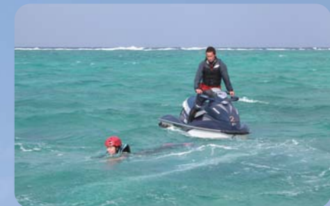
足の裏から出る推進力で前に進みます。実はこれだけでも結構楽しい。