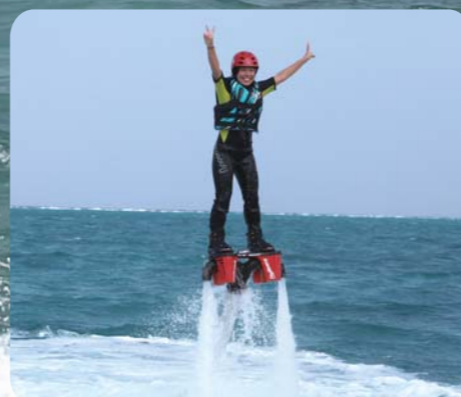
自分の体が海よりも上に浮いている感覚がフライボードが大人気の理由の1つです!!

フライボード スクール (年齢12歳以上・体重40kg以上) 初回... 1名/30分 ¥7,350 2回目から... 1名/20分 ¥5,250