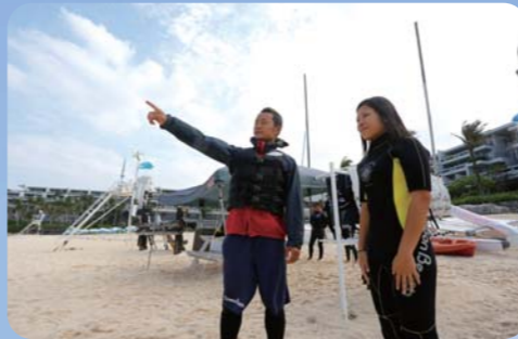
まずは砂浜でしっかりと注意事項の確認や、全体の流れを教えてくださいます。

取材協力:ホテル ムーンビーチ 沖縄県国頭郡恩納村字前兼久1203 TEL 098-965-1020 URL http://www.moonbeach.co.jp/