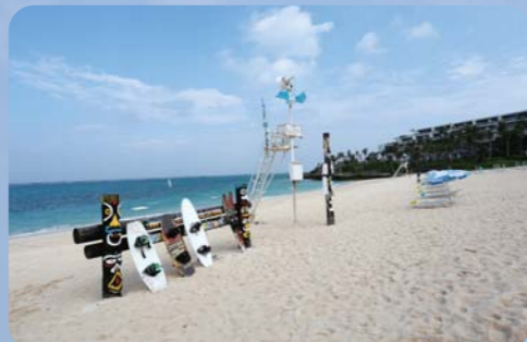
フライボード以外にも、PWCやウェイクボード、バナナボートもとても人気ですよ!!