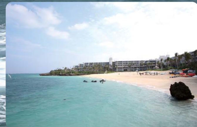
ポカポカ陽気の沖縄で抜群の水色を眺めながら、海面を飛び回るのはとても魅力的ですね!!

ートである。フライボードはここ東海エリアでも静岡県湖西市のベルマリンのスクールがシーズン中大きな賑わいを見せる等、今各エリアでも注目されているマリンスポーツである。暖かい沖縄でまず体験してみて、シーズンインしたら地元で腕を磨いてみよう!!