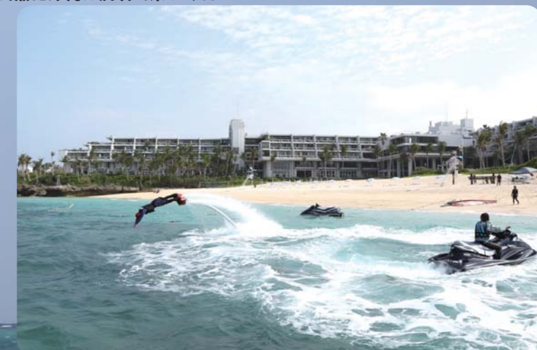
沖縄の海の上を飛んでみたり、イルカのように泳ぎ回ってみたり、沢山の技を披露してくれました。

今回ご紹介するのは沖縄県国頭郡恩納村にあるホテルムーンビーチのスクールで楽しむフライボード。ムーンビーチは自然豊かな場所に位置し、綺麗なプライベートビーチがある他、様々なマリンスポーツも気軽に楽しめて、沖縄の遊びの拠点として、とても人気のリゾートである。