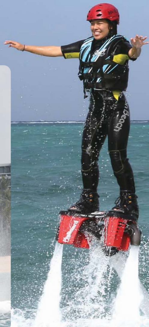
しばらく練習すると、しっかりとバランスのコツが掴めて、立つ事が出来ました!!