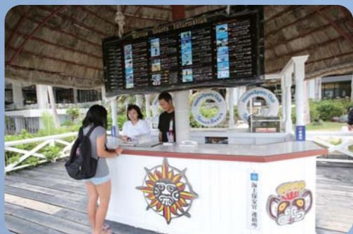
マリンスポーツの受付はコチラで行います。今回はフライボードに申込みます。