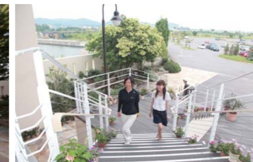
階段の周りには綺麗な花が並んでいます。