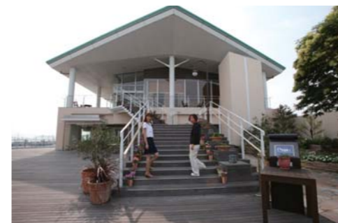
お洒落な雰囲気が漂う入口から店内に入ります。