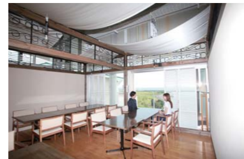
食事の後はドルチェルームへ移動します。