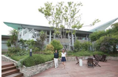
プライベートガーデンでは海上に広がるパースを見ながらBBQを楽しめます。(艇置契約者の方のみ)