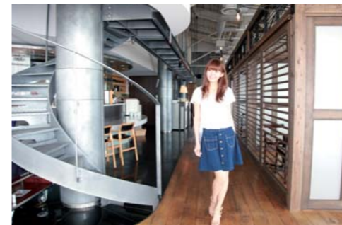
ウッド調の廊下を歩いてホールへと向かいます。