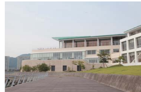
レストランの外観は特徴的なので見つけやすい!!