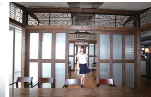
ドルチェルームは仕切りを取れば開放感も増します。船に関する展示物も見ることができます。