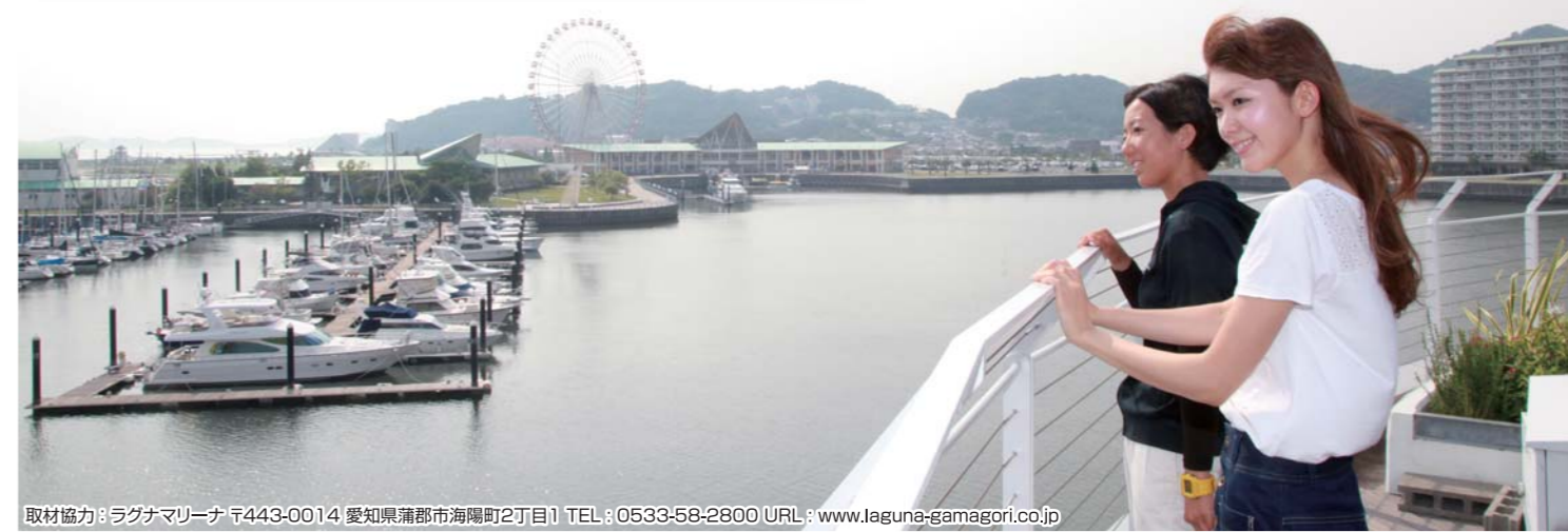
取材協力：ラグナマリーナ 〒443-0014 愛知県蒲郡市海陽町2丁目1 TEL：0533-58-2800 URL：www.laguna-gamagori.co.jp

casa 地中海レストラン・バル カーザ Mediterranean Restaurant & Bar 愛知県蒲郡市海陽町2-8 TEL 0533-59-7766 LUNCH 11:00~15:00 LO 14:00 DINNER 17:00~23:00 LO 22:00 URL www.laguna-gamagori.co.jp/laguna/casa/index.html