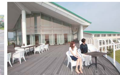
外から見える景色を楽しみながら食事出来ます。