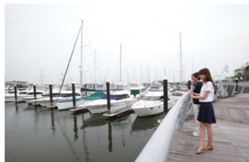
広大な海上パースには大小様々な種類のボートが並んでいて、ヨットも数多く保管してあります。