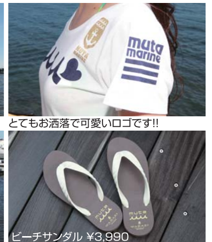
今回はムータマリンで全身コーデ!! とてもお洒落で清潔感があります。 マリーナを歩く後ろ姿もとても素敵ですね!! クールなデザインのビーチサンダル。