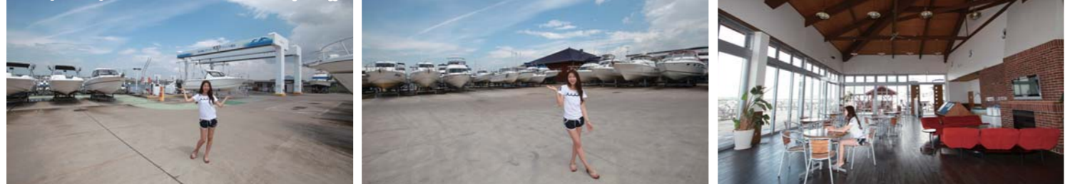
名古屋からNTPマリーナ高浜までは車で約45分!! 広大な陸上バースには様々なタイプのポートが並び、高級感があり、落ち着いた雰囲気クラブハウス。

取材協力:NTPマリーナ高浜 愛知県高浜市青木町1丁目1番地 TEL:(0566)54-5300 URL www.ntp.co.jp/marina/