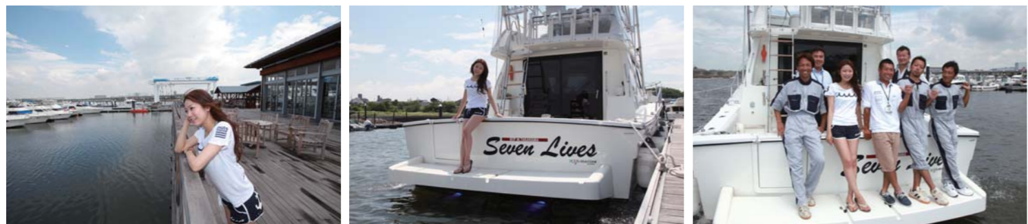
海の上に広がる広々としたデッキは、開放感抜群!! 今回はマリーナ艇のセブンライブズで出発!! 各部門のプロ達が、責任を持って管理してくれます。

グルメクルージング第102弾!!今回ご紹介するのは、穏やかな三河湾に位置し、一年を通して新鮮な海の幸に恵まれている日間賀島の『日間賀観光ホテル』。日間賀島は東海エリアから、マイポートやレンタルポートに乗って遊びに行く事も出来る島で、ポートオーナーやレンタル会員の方々にもとても人気のある島です。また、近年ポートレジャーの普及に伴い様々なポートが日間賀島や周りの島に入港出来るようになりましたが、島には普段から漁船が多数行き来するので、係留位置を明白にするためにも、宿泊や日帰りに関わらず、係留場所の確認は事前にお宿にしてください。日間賀島には、日常ではなかなか味わう事の出来ない穏やか