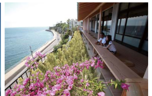
海を眺めながら最高の雰囲気でお話を楽しめます。