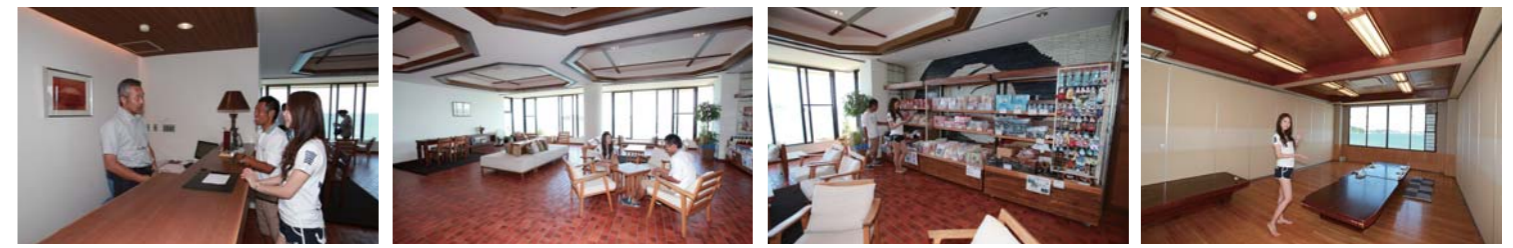
係後はフロントで受付を行います。 ロビーのソファでひと休み。 島のお土産が並ぶ売店もあります。 広々とした食事処からも海が見えます。