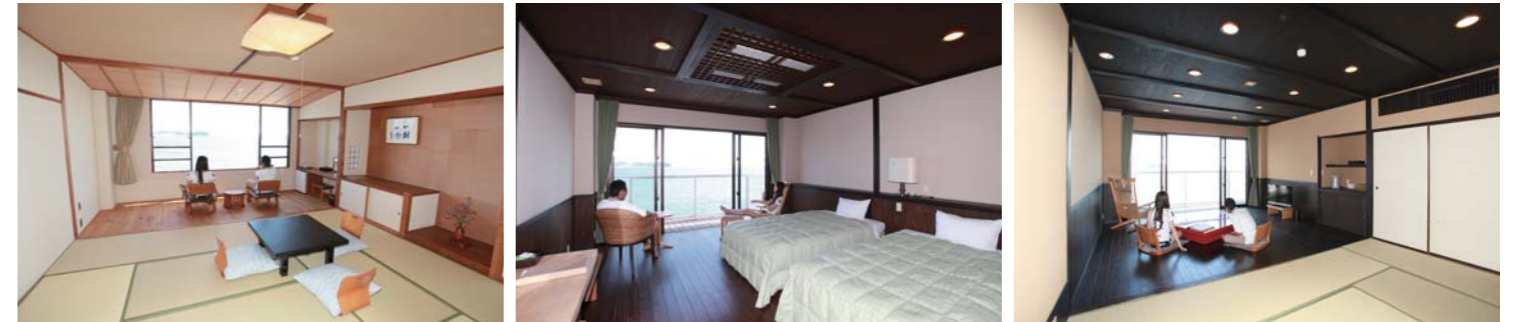
木の温もりを感じる事の出来るA1タイプのお部屋。 ベッドに寝転んで海を眺められるBタイプのお部屋。 自然との一体感を感じられるEタイプのお部屋。