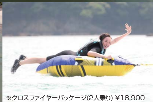
※クロスファイヤーパッケージ(2人乗り) ¥18,900