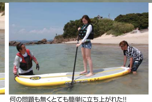
何の問題も無くとても簡単に立ち上がれた!!