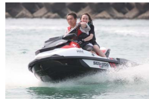
今回のトーイングで大活躍のシードゥWAKE155。