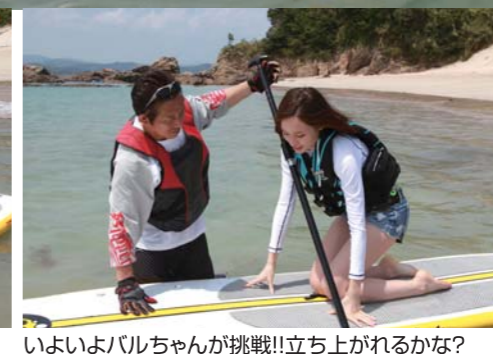
いよいよバルちゃんが挑戦!!立ち上がれるかな?