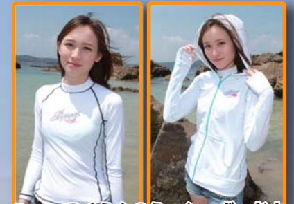
ニューアイテムのラッシュガードとラッシュパーカーも登場!!

この夏ブレイク間違いなしSUP! 大沢商会グループでは最新ラインナップを展開中! hpをチェックしてみよう!!