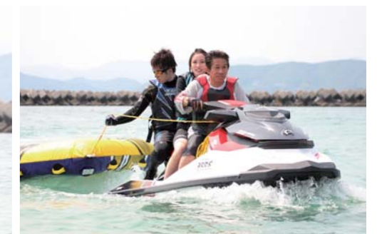
WAKE155は定員が3人なので安心だ!!