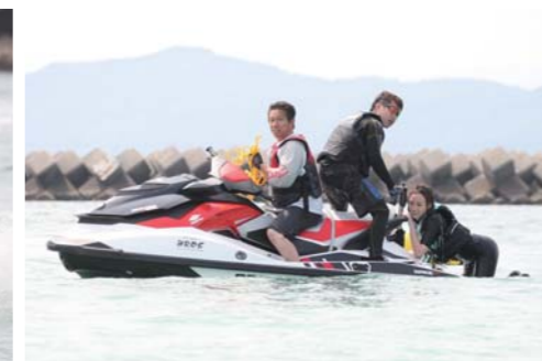
トーイングが終わった女の子でも簡単に乗り込める。