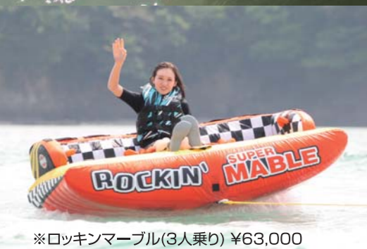
※ロッキンマーブル(3人乗り) ¥63,000

取材協力:株式会社大沢商会グループ マリン用品部 埼玉県三郷市幸房521番地 TEL:048-949-1117 www.josawa.co.jp BRPジャパン株式会社 神奈川県川崎市川崎区東田町8 TEL:044-200-1431 www.brp-jp.com 有限会社プロス 愛知県一宮市北今字林三ノ切12-4 TEL:0586-63-1900