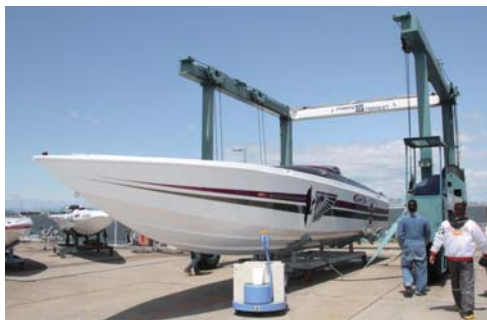
当日はお洒落なパワーボートが続々と水面に登場!!