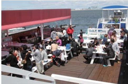
当日は沢山のお客様がマリーナに訪れていた。