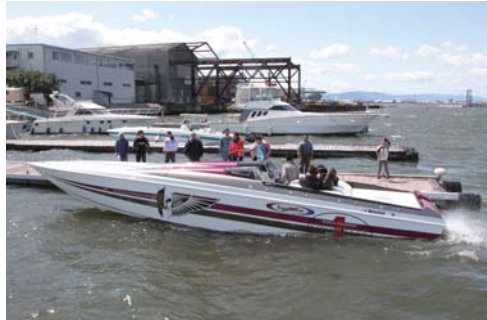
沢山の人がパワーボートの魅力に触れていた。