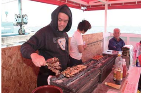
会場には絶品の焼き鳥屋さんも登場!!