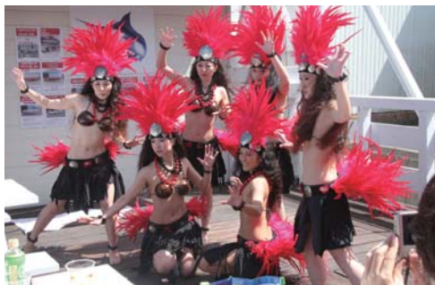
タヒチダンスは大いに会場を盛り上げていた!!