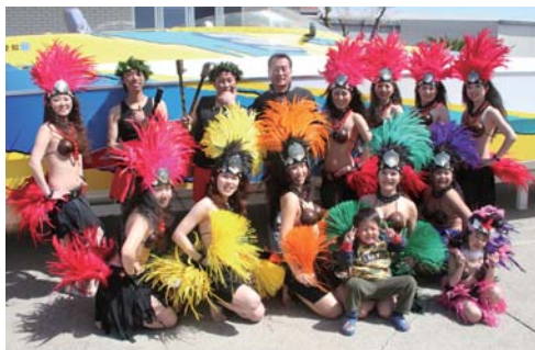
最後に集合写真をパチリ。とっても良い笑顔です!!