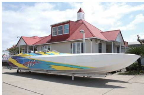
スタイリッシュで迫力も抜群のパワーボート。