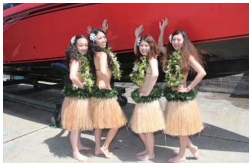
タヒチダンスを披露しに、ダンサーの方達も登場!!