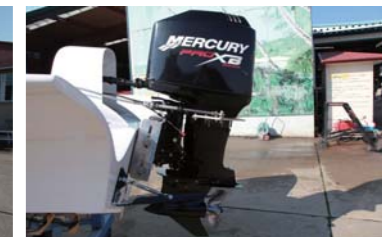
エンジンは250馬力を装備。