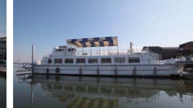
大人気のベイエリアレストラン。

を通過していってしまう驚きと感動は、見ただけで周りの人の視線を釘付けにしてしまう魅力が溢れていた。ボートの内装はというと、こちらは実にシンプルな作り。簡単に言うと速さに直結しない物はほとんど積んでいない。そしてあれだけの走行性能を見せるには、決して簡単では無く、グレートマリンさんの今まで積み重ねて来た技術あってのものだと思う。確かにボート自体の性能も走行性能の大きな要