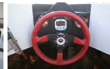
闘争心を掻き立てる赤いハンドル。