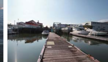
グレートマリンさんの桟橋からの景色。