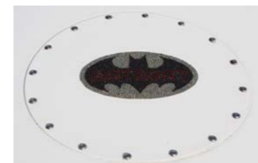
お洒落なデザインのロゴはバットマン。