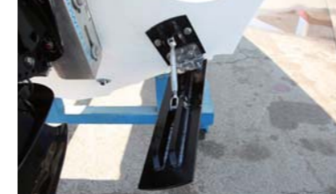
高速走行を安定させるフラップ。