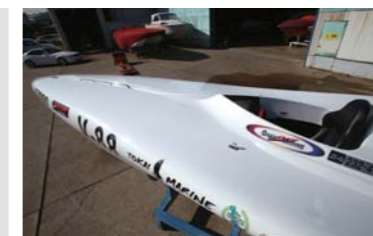
ボディはとてもシャープでカッコイイ!!