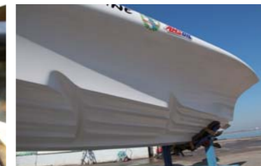
ハルもとても個性的な形状である。