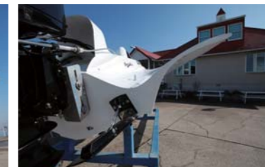
斜め後ろから見ると、飛行機のような。