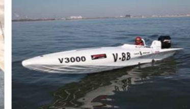
水面に浮かべると更に迫力が増す。