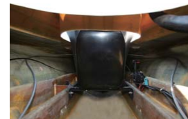
ドライバーズシート後方から見た船内。