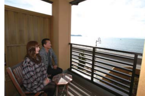
お部屋から見える海の眺めは抜群です。