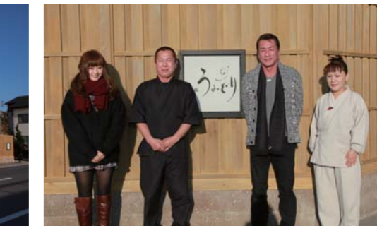
今回もとってもお勤めのお宿でした!!