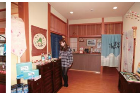
館内では趣のあるおみやげをたくさん見かけます。