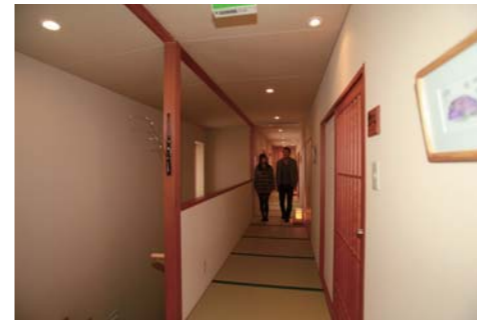
落ち着いた雰囲気のある廊下を進んで行きます。

大人1泊1名 平日 42,000円コース 【お品書き一例】 ・食前酒・前菜・白子焼き・てっちり ・お造り三種（薄造り、タタキ、ぶつ切り） ・土瓶蒸し・ふぐ皮サラダ・ふぐ寿司 ・ふぐ唐揚げ・ふぐ雑炊・デザート ※詳細等はホームページでご確認下さい。 http://www.umidori.net