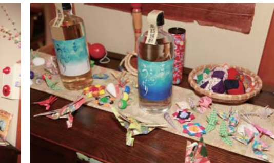
オリジナルラベルの焼酎も売っています。