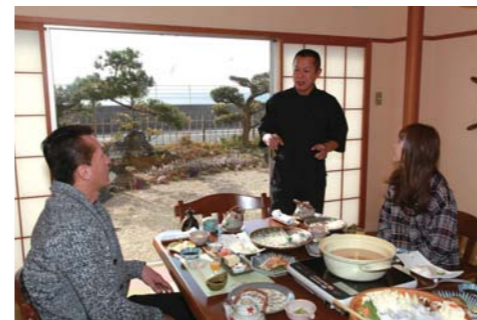
親しみやすい大将が料理について説明してくれます。