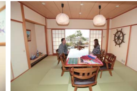
ラウンジは清潔感があり、とてもリラックス出来ます。