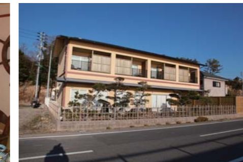
うみどりさんの外観。内装同様とても綺麗でした!!