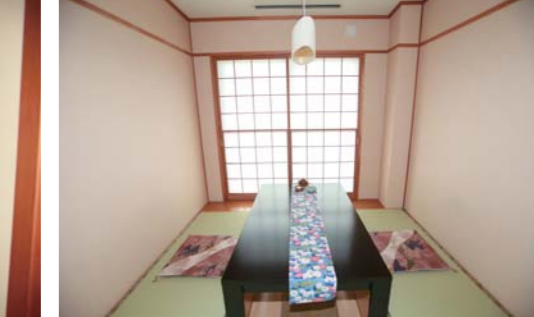
専用の個室でプライバシーも守ってくれます。