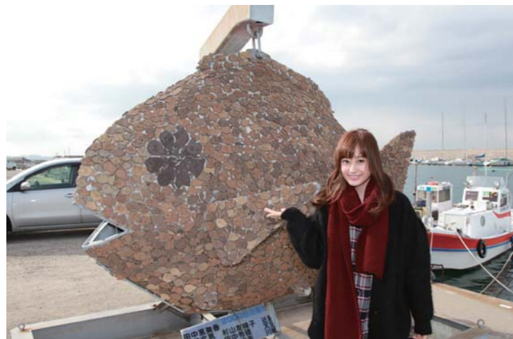
鬼崎フィッシャリーナにある巨大な魚!?2,000匹の魚が使用されています!!