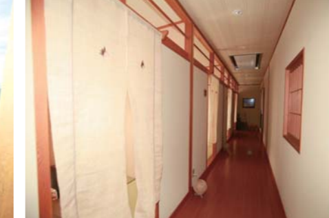
廊下には食事専用の個室が続きます。