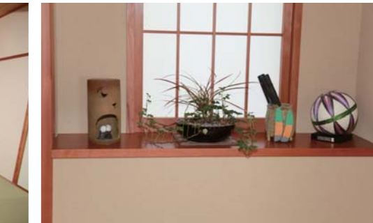
お洒落な雰囲気さをさりげなく高めてくれています。