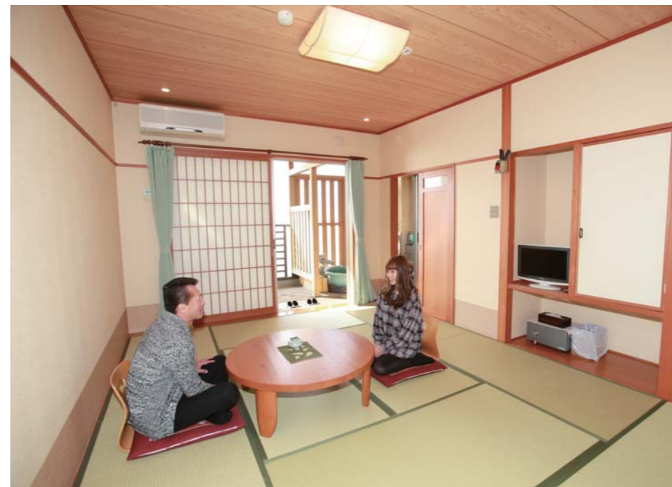
お部屋は広々としていて、全部屋露天風呂付きとなっています。自分へのご褒美にいかがですか？