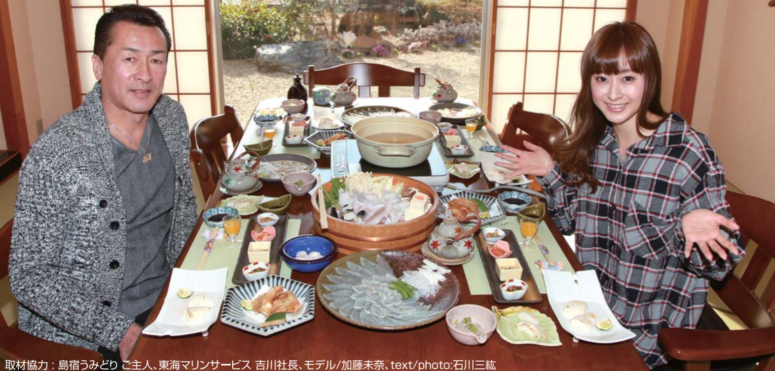
取材協力：島宿うみどり ご主人、東海マリンサービス 吉川社長、モデル/加藤未奈、text/photo:石川三紘