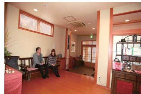
落ち着いたエントランスで寛ぐことができます。