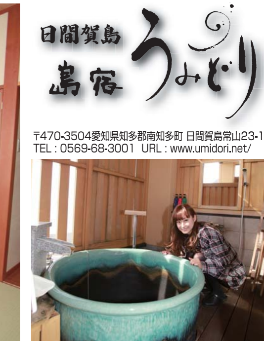
部屋付きのお風呂は日頃の疲れを癒してくれます。