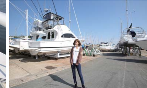
陸上バースにはビッグボートも保管してあります。