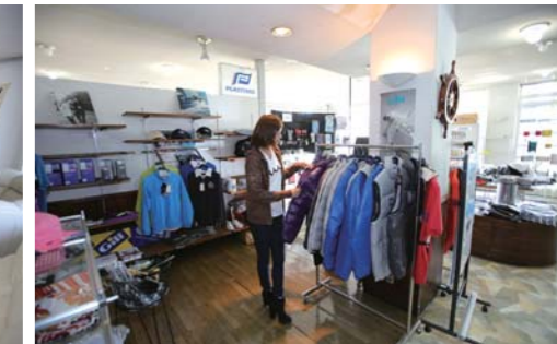
クラブハウス内にはマリショップもあります。

取材協力:(株)日産マリーナ東海 愛知県西尾市東幡豆町緑ヶ崎1 TEL 0563-62-4511 URL www.nm-tokai.com/