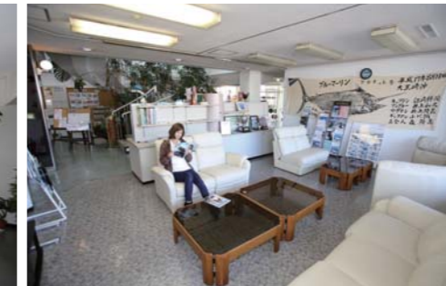
座り心地の良いソファでゆっくり休憩出来ます。