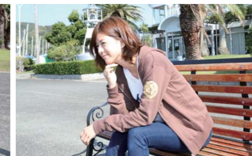
パーカーにあるマークもとてもお洒落です!!