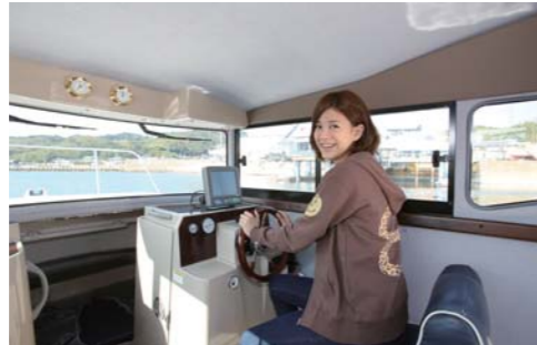
快適な空間を創りだす広々としたキャビンは最高!!