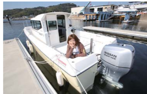
カタランハルと相性抜群の日産BF150を搭載。