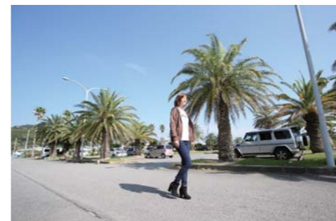
散歩をするとアメリカな雰囲気味わえます。