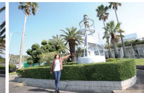
マリーナの中で航路ブイを発見しました!!