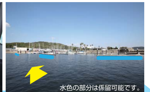
水色の部分は係留可能です。