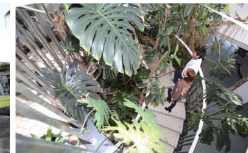
レストランへは緑溢れるスパイラル階段を上ります。