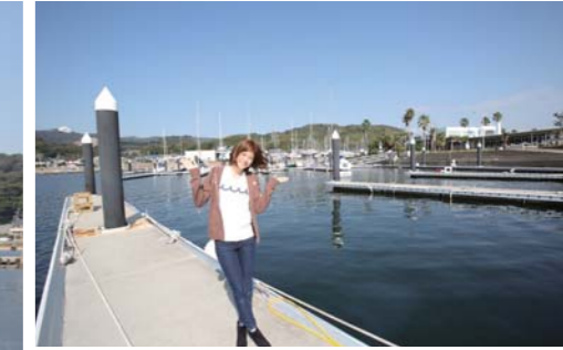
大型の係留バースも完備してあります。