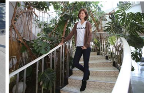
階段でバッチリポーズも決めてくれました。