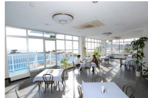
レストランからは海も見えて開放感抜群です!!