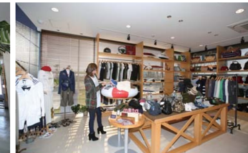
ムータマリンはNTPマリーナりんくう内にあります!!