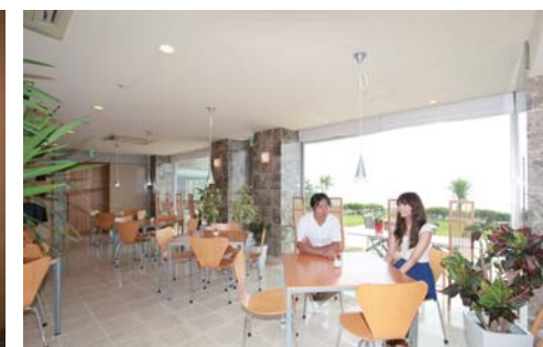
海が見えるカフェテリアで寛ぐ事が出来ます。