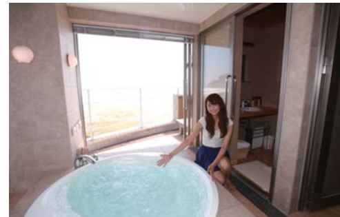
ジャグジー付きの露天風呂もあります!!