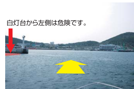
白灯台から左側は危険です。