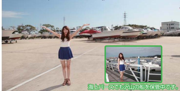
海上パースでも沢山の船を保管中です。

取材協力 スズキマリーナ三河御津 愛知県豊川市御津町御幸浜1-1-25 TEL 0533-76-3521 定休日 火曜日 URL http://suzukimarine.co.jp/marina/mikawamito/