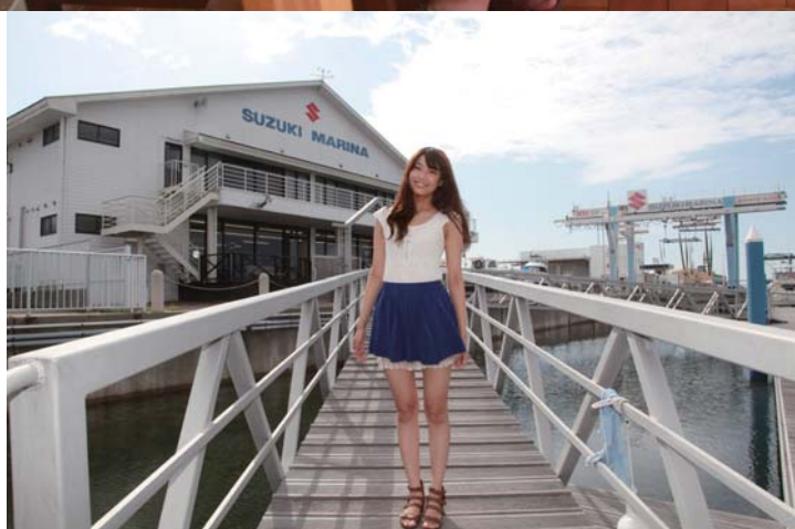
今回のグルメクルージングはスズキマリーナ三河御津から出発しました!!

取材協力 スズキマリーナ三河御津 愛知県豊川市御津町御幸浜1-1-25 TEL 0533-76-3521 定休日 火曜日 URL http://suzukimarine.co.jp/marina/mikawamito/