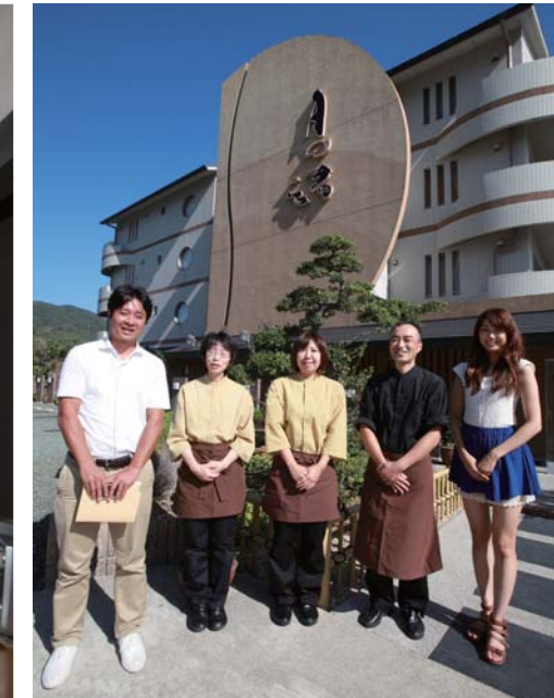
とても親しみやすい月の渚の皆さんと記念撮影!!