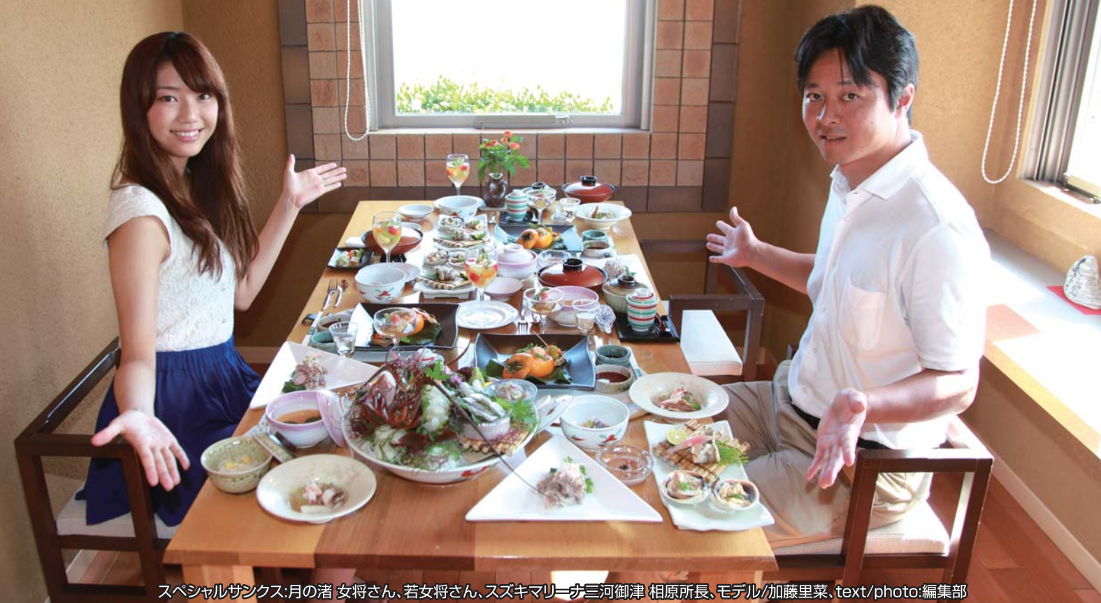
スペシャルサンクス:月の渚 女将さん、若女将さん、スズキマリーナ三河御津 相原所長、モデル/加藤里菜、text/photo:編集部

全室露天風呂付きの大人の隠れ家のお宿で食べる 新鮮な海の幸を使ったこだわりの料理の数々に感激!!