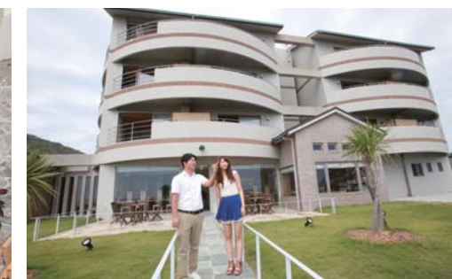
オープンテラスからは太平洋を一望出来ます。