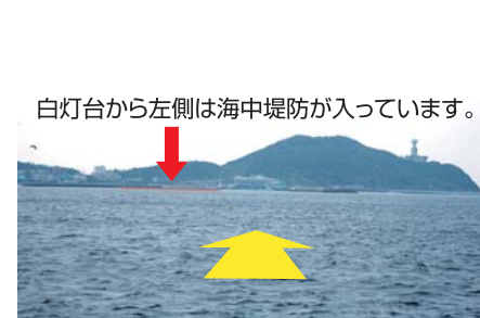
白灯台から左側は海中堤防が入っています。