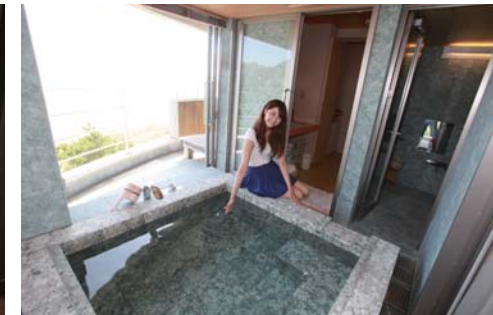
太平洋を眺めながら露天風呂を満喫出来ます。