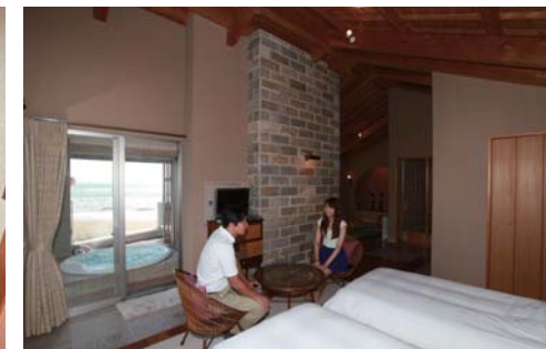
全てのお部屋に露天風呂も付いています!!