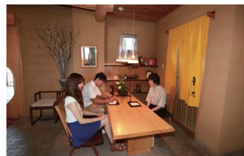
到着したらまずはフロントで受付を行います。