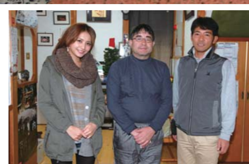
湧泉の河口さんを囲んで、みんなで記念撮影!!