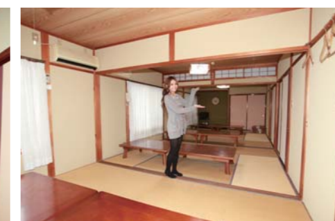
広々としてゆったりと寛げる宴会場。