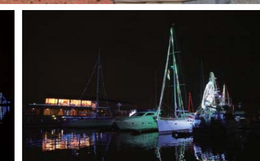
冬のマリーナってこんなに雰囲気が良いんですね!!