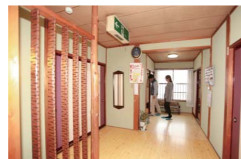
日常とは違う特別な空間を演出してくれています。