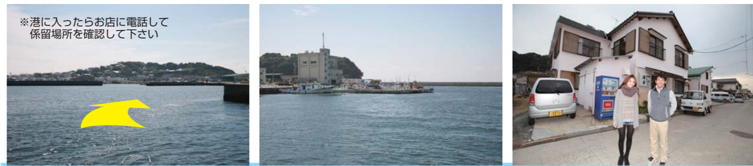
※必ず御自身で海図、GPS、魚探、天気予報等をご確認の上、安全に十分注意してお出かけ下さい。トラブル等発生致しましても当社は一切責任を負いません。