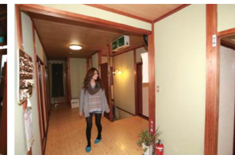
2階にあるお部屋を目指して館内を歩きます。