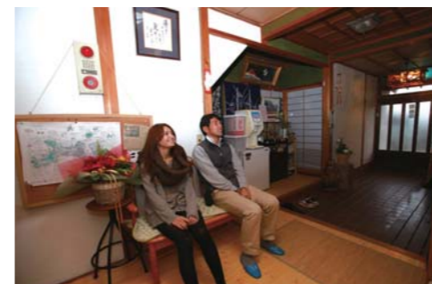
落ち着いた雰囲気のエントランスで休憩中です。