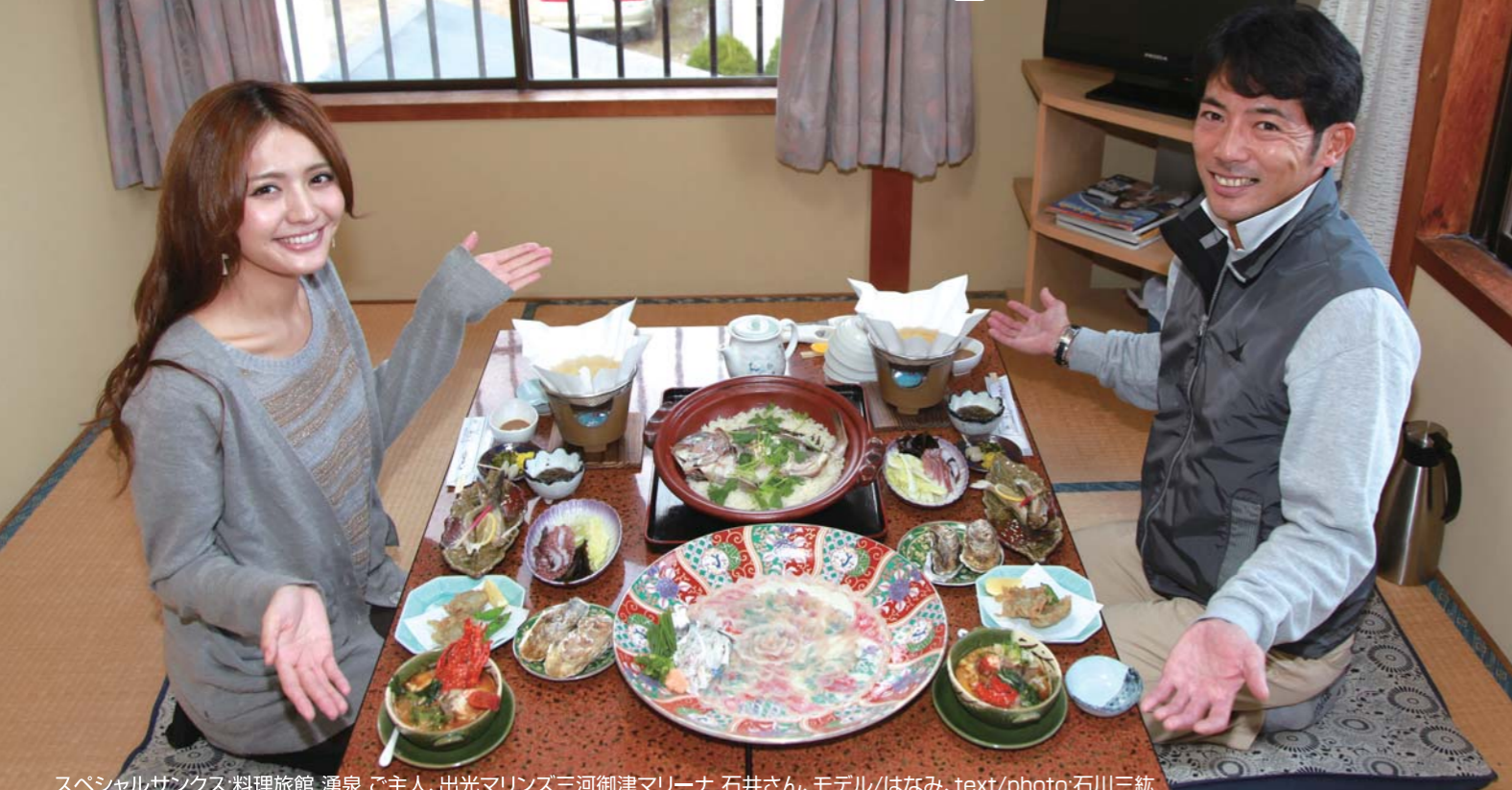
スペシャルサンクス:料理旅館 湧泉 ご主人、出光マリンズ三河御津マリーナ 石井さん、モデル/はなみ、text/photo:石川三純