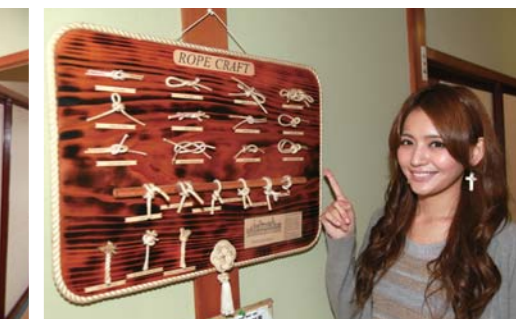
ロープにはこんな種類の結び方があるんですね!!