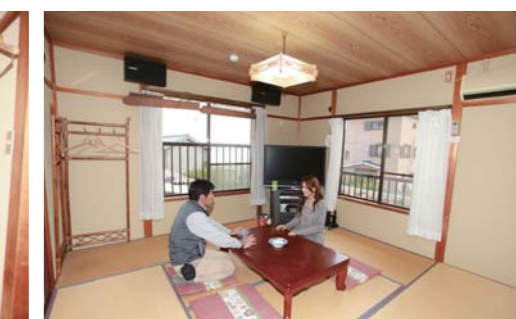
お部屋ではリラックスした時間を過ごせます!!