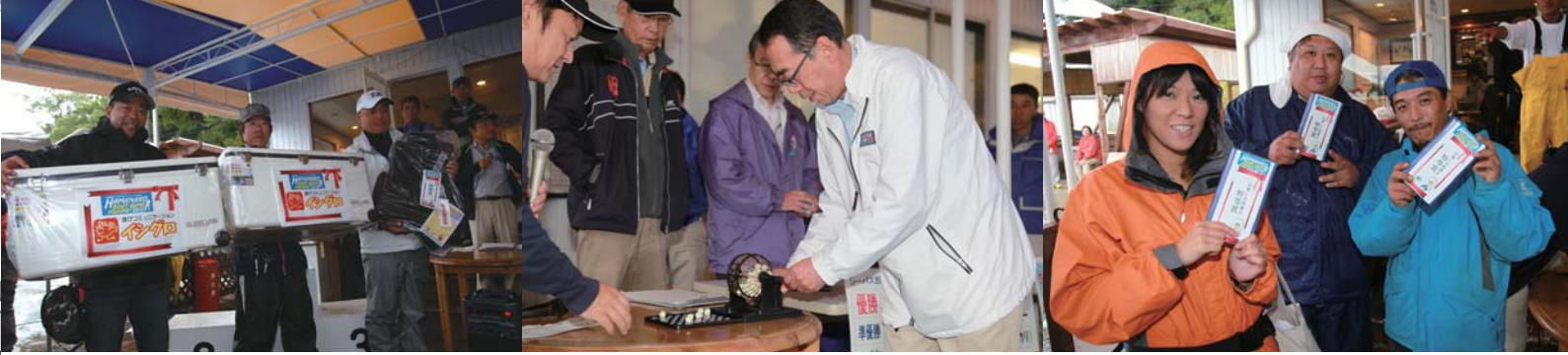
特別賞として協賛スポンサーの「イシグロ」さんから大型クーラーボックスが贈られました!! 大盛況だったのが、『運試し!お楽しみ抽選会!!!』なんとい見事に特等賞を当てた3人!!さあ、これさえあれば今年の冬は温泉行けますね~。