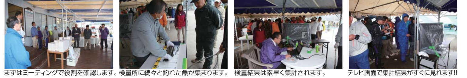
まずはミーティングで役割を確認します。検量所に続々と釣れた魚が集まります。検量結果は素早く集計されます。テレビ画面で集計結果がすぐに見れます!!

ライトタックル部門：優勝 川福丸 計131cm 2位 チーム ウチャヤマ 計109.5cm 3位 FW-20 計98.5cm 餌釣り(鯛類・ヒラメ・コチ)部門：優勝 Desthy 計2,145g 2位 NOYORI 計1,930g 3位 シーダンスキッズII 計1,655g ハゼ部門：優勝 明天丸 計1,770g(人数割り) 2位 桂雄伸丸 計1,337.5g(人数割り) 3位 BOB 計1,045g(人数割り)