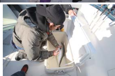
釣れた魚を素早く網でキャッチ!!