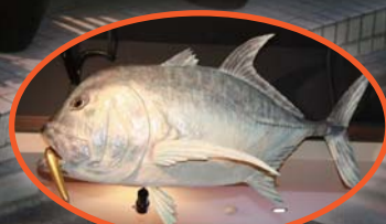
迫力満点のGTがお出迎えしてくれます!!

名古屋市千種区内山3-5-1 安・ジャンブル・クレール千種1F Tel. 090-6333-2843 URL http://turibito-nagoya.jp/