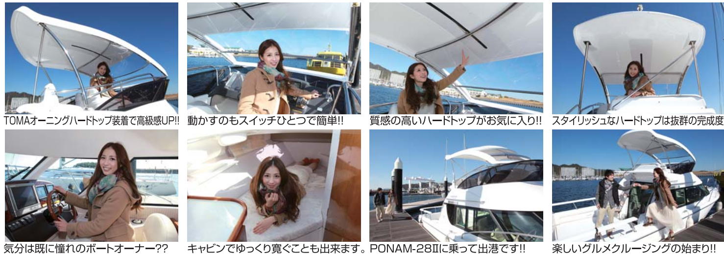
TOMAオーニングハードトップ装着で高級感UP!!