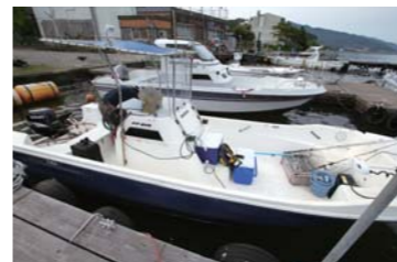
親子での釣りにピッタリサイズです。