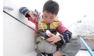
仕掛けも自分で作れるんです!!