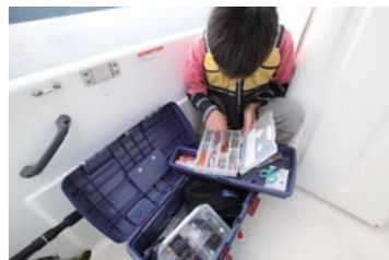
自分でお気に入りのジグを選びます!!