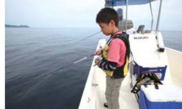
ジギングの誘い方も上手でした!!