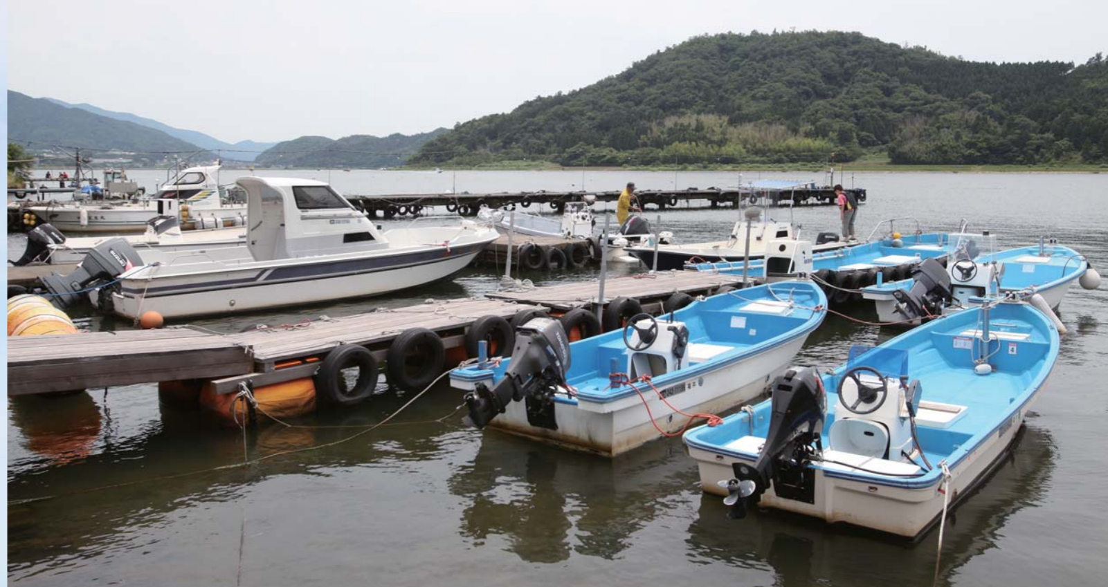
福井県三方郡美浜町の久々子湖に位置するグランドバンクス三方五湖久々子マリーナ。会員制を導入しており、舟艇の保管やボートレンタルを楽しむ事が出来る。