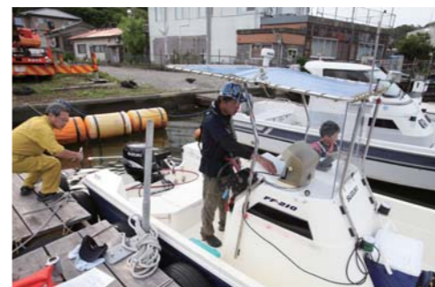
出港準備もスタッフさんが親切にフォローしてくれる。