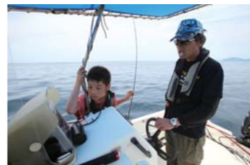
魚探で反応を探すお二人。真剣です。