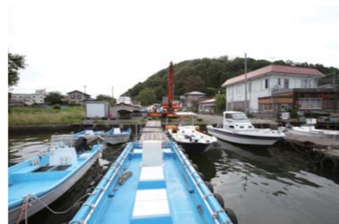
15艇の中から目的や釣りに合ったボートが選べる。