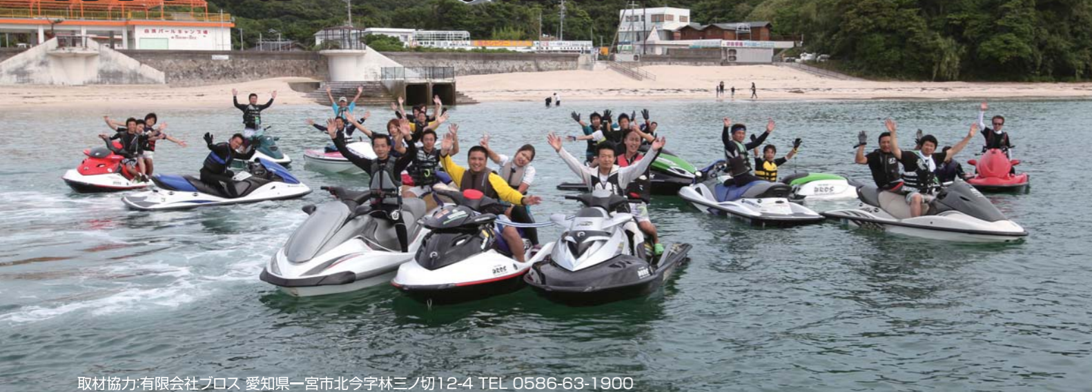
取材協力:有限会社プロス 愛知県一宮市北今字林三ノ切12-4 TEL 0586-63-1900