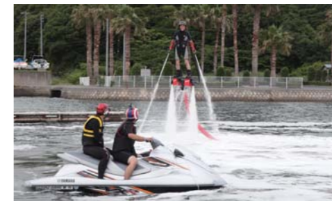
スタッフの方もかなりお上手で楽しそうでした。