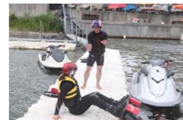
まずは注意点をしっかり聞きます。