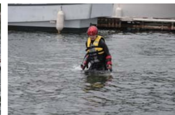
それでも徐々に体が浮き上がり…。