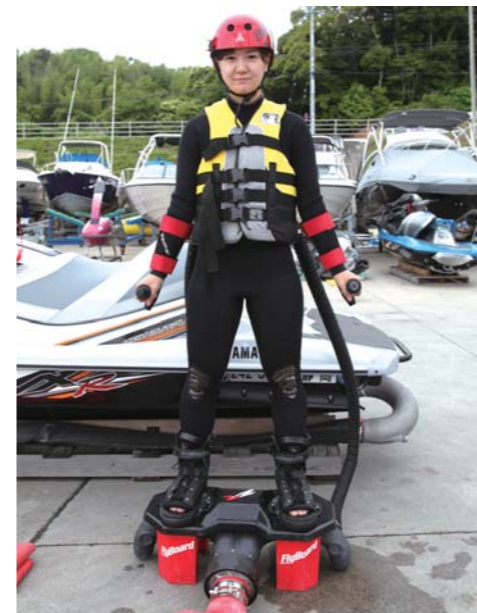
フライボードの装着例。とても似合っています!!