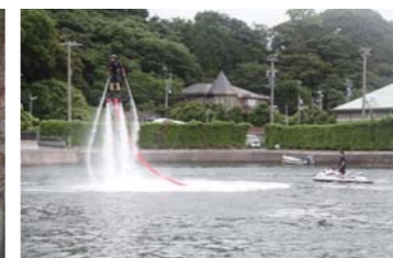
編集部も初挑戦!!無事に飛べました!!