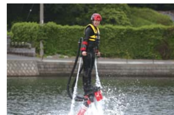
お見事!!わずか5分程で立てました!!