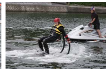
最初は転んでしまいました。