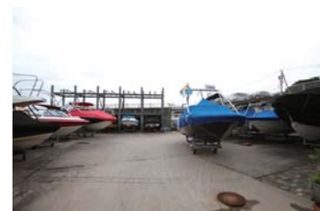
保管ヤードは沢山のボートがあります。