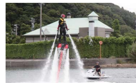
女の子でもここまで高く飛んでいます。すごい!!