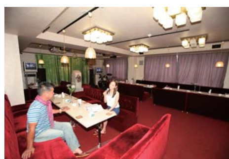
憩いのパブ!宴会の二次会にいかがですか!