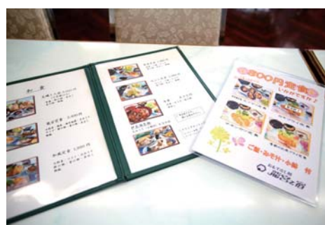
800円からお手軽な定食が揃えられている豊富なメニュー。