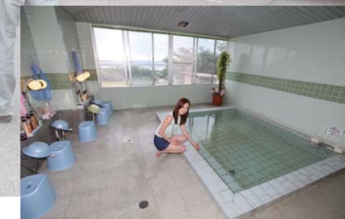
海が見えるお風呂は、24時間いつでも入浴可能で肌に優しい弱アルカリ性の清水機を使用。