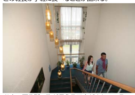
お宿の至る所で海が見える工夫がされている。