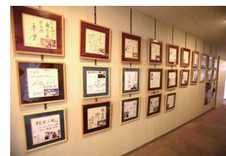
いろいろな有名人の方が来館されているようです。