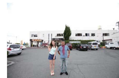
お宿の全景。通りに面していて凄く分かりやすい所に建っています。