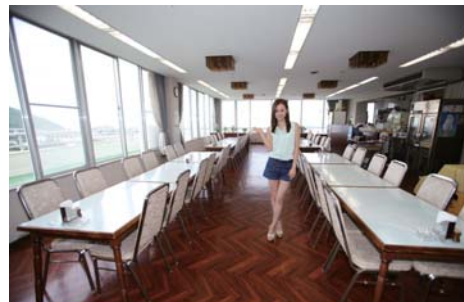
お刺身定食をはじめとする和食からスパゲティーなどの軽食が手軽に食べることが出来る。