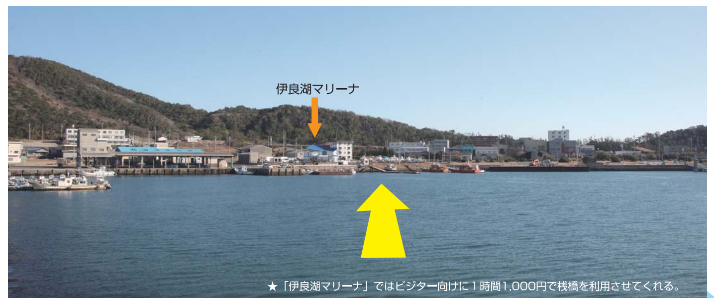
★「伊良湖マリーナ」ではビジター向けに1時間1,000円で棧橋を利用させてくれる。