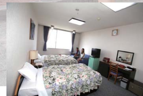
お洒落でモダンな洋室も美しく寛げるお部屋。こちらでも海側と山側がある。