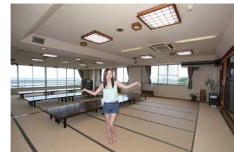
宴会場は大・小二つあります、小人数から80名様まで利用が出来ます。