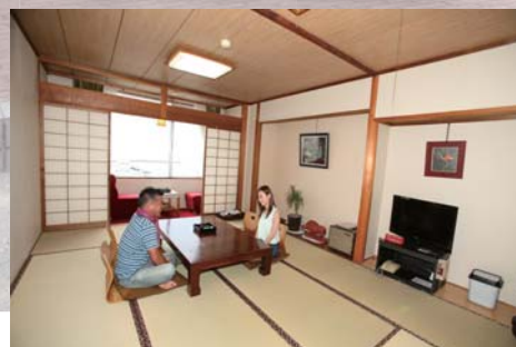
和室は海側と山側に分かれていて、落ち着いた雰囲気のお部屋。

〒441-3624 愛知県田原市伊良湖町宮下 3000-63 TEL:0531-35-6525 FAX:0531-35-6472