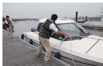
離着岸もしっかり教えてもらえる。