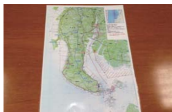
細かい部分も教えてもらえる。