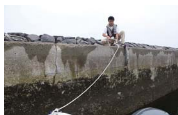
堤防とボートの距離が変化する。