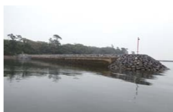
この堤防は予約なしで係留出来る。