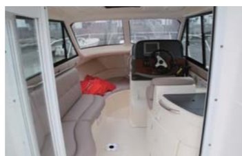
広々としてクルージングにピッタリ!!