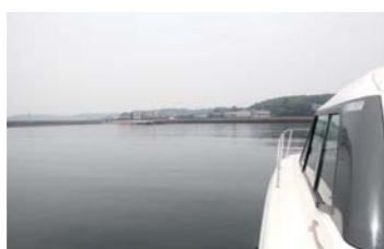
島に近づく時は徐行で近づいていく。