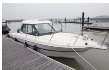
今回はヤマハ シエスタFC24で出発!!