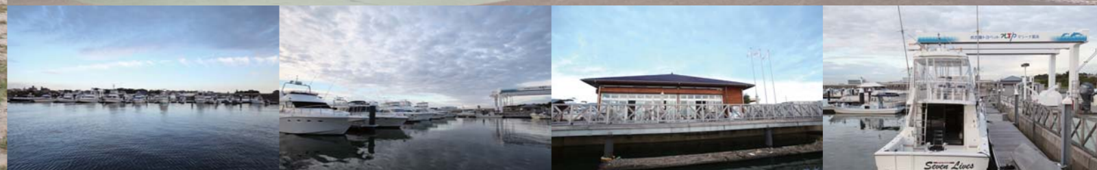
愛知県高浜市にあるNTPマリーナ高浜さん。広々としたマリーナで、クルージングや釣り等を楽しむ多くのオーナーさんがここを拠点にマリンレジャーを楽しんでいる。