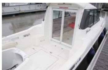
スターンデッキで釣りも楽しめる。