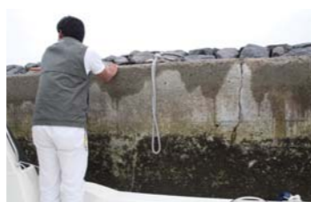
ロープに足を掛けることが出来た。