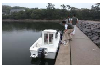
しっかり留めれば係留完了!!