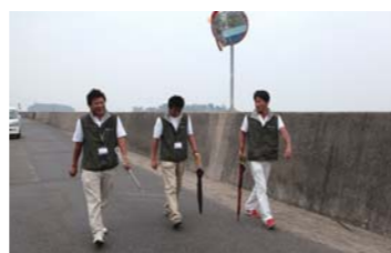
さあ、佐久島の散策開始!!