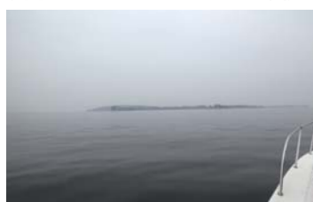
目的地の佐久島を船から眺める。