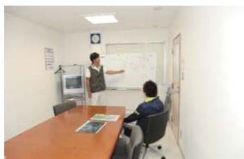
的確な講習で自信をつけてくれる。