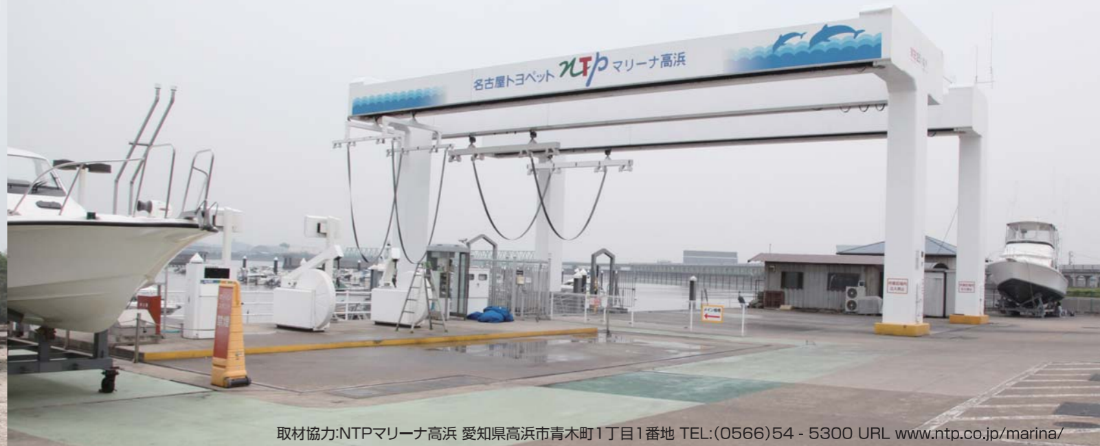
取材協力:NTPマリーナ高浜 愛知県高浜市青木町1丁目1番地 TEL:(0566)54-5300 URL www.ntp.co.jp/marina/