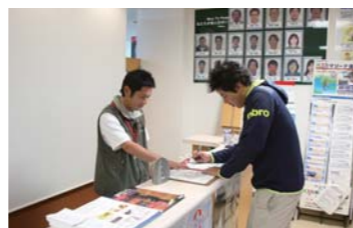
受付を済ませたら、佐久島へ出発!!