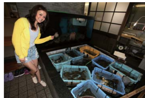
新鮮な魚介類で溢れているイセス。どれも、かなり美味しそうでした。