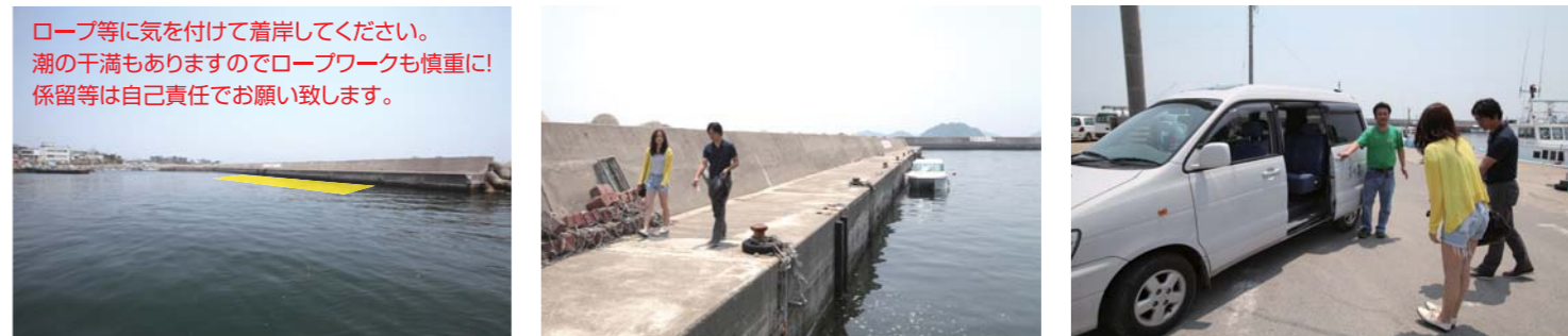
※必ず御自身で海図、GPS、魚探、天気予報等をご確認の上、安全に充分注意してお出かけ下さい。トラブル等発生致しましても当社は一切責任を負いません。

お風呂の撮影に入ります。お風呂は凄く広くて綺麗で寛げる空間。玄関に戻ると大きな水槽が目飛び込んできます。その日捕れた新鮮な魚介類で水槽は溢れていました。館内の撮影をすませ、いよいよお待ちかね、お宿ご自慢の料理の登場です。まず初めにお料理の器を見てビックリ。今回で88回目のグルメクルージングですが、ここまで器にこっているお宿は初めての気がします。出てくるお料理も一手間掛けただけのお料理ばかりですが、器も負けず劣らずお洒落でお料理を見事に引き立てていました。大将にお聞きしたところ、器は「有田焼」とのこと、なるほどと納得させられました。お料理はというと写真を見て頂いて分かるように、かなりお勧めできる逸品が勢揃い。まず初めにド肝を抜かれたのが、穴子の天ぷら。一本丸っと揚がっていてお味は最高!ホクホクの柔らかい身と衣のサクサク感がベストマッチ!あと、パンパンに内子を抱いたワタリガニ。これも、新鮮で捕れ