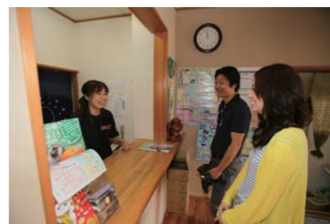
優しい若い女将さんに挨拶をして、お部屋に通して頂きました。