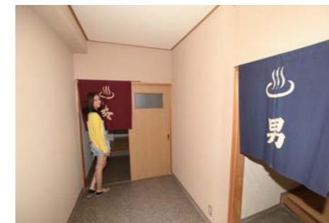
お風呂は男女に分かれていて、広くて凄く寛げる空間です。ジェットバスがかなり気持ち良さそうでした。