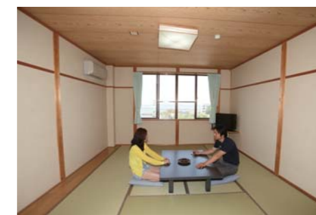
お部屋は凄く落ち着いた雰囲気のお部屋。外の景色も見渡す事が出来て綺麗です。