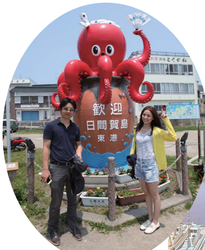
東港のタコは左足、西港のタコは右足をあげていますよ!