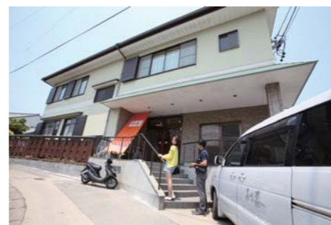
お宿は小高い丘の上に建っているので景色が良く、 て凄く静かです。