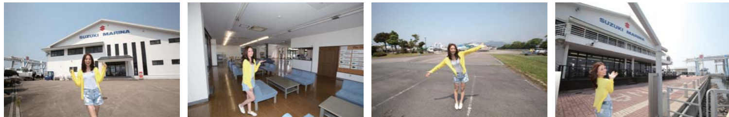
ボートの販売から保管、メンテナンスまた、免許やレンタルボートまで幅広くマリンレジャーを展開しているマリーナで料金も安くリーズナブル。これから、マリンライフを楽しもうと思っている方から、マリンライフを極めているオーナー様まで満足のゆくサービスが期待できるマリーナだ。

今回ご紹介するグルメクルージングは三河湾に浮かぶ島、日間賀島。本誌でも幾度となくご紹介してきましたが、お宿が変われば話は別。お宿