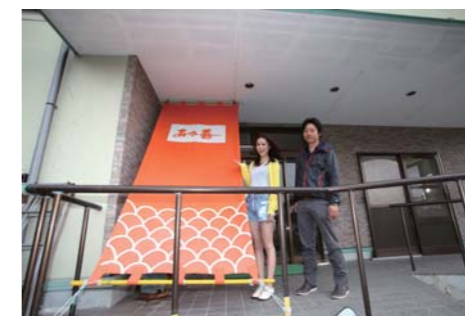
雰囲気の良い玄関! 分かりやすい入り口ですね!