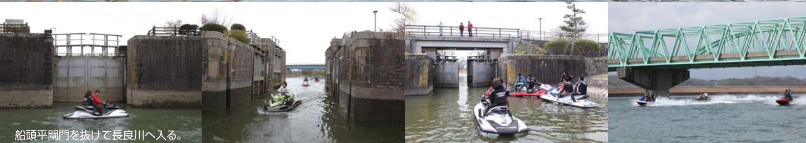
船頭平閘門を抜けて長良川へ入る。

れた!!写真を撮っていると、所々で陸からスタッフさんがカメラを持ってスタンバイしていることに正直驚いた。各地点で先周りにして、記念撮影や動画撮影する手際の良さにビックリ!!こういう所も参加者にとっては嬉しく感じる部分なんだと思う。話は戻り、名古屋港で記念撮影したメンバーは、堀川へ入って行く。ここは地域の方に迷惑を掛けないように徐行して、慎重に走ることに。堀川を山王まで上ると、とうとう本日の