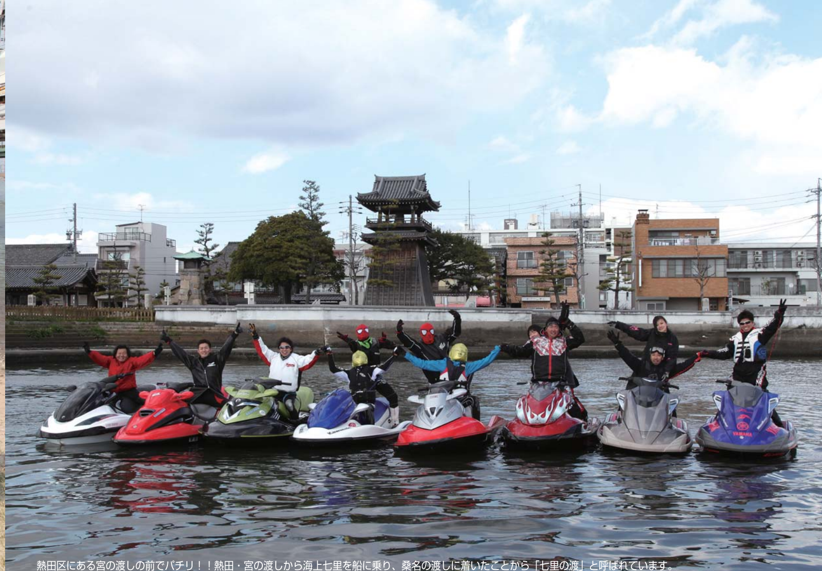
取材協力：有限会社フリーワールド 名古屋市港区西福田一丁目2015番地 TEL 052-303-3311 URL freeworld.car.coccan.jp/