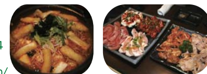
人気のカラカラ鍋!!お肉はどれも絶品です!!

KARAKARA 名古屋本店 住所: 名古屋市中区松原3-1-14 TEL: 052-324-0331 URL: www.ms-planning.co.jp/