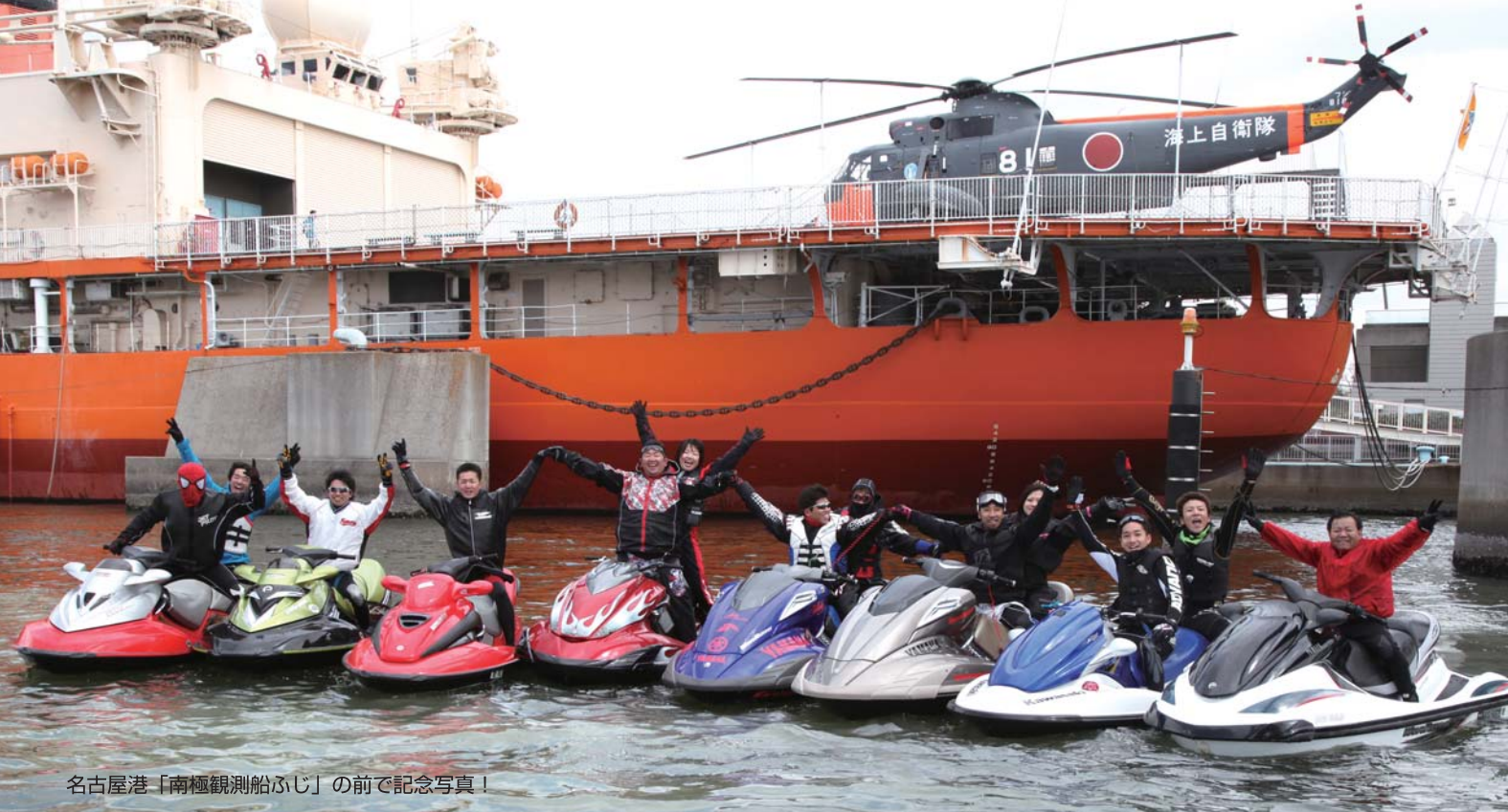
名古屋港「南極観測船ふじ」の前で記念写真！