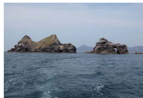
千島はひとつだけ穴が空いている岩がある。