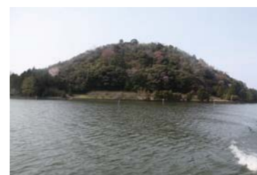
久々子湖では自然を感じられる。