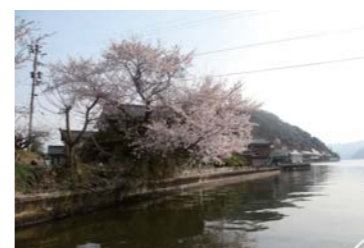
水路の途中で桜を見ることが出来た。