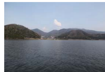
水月湖の様子。波が無いので走っていて、非常に爽快感を感じる事が出来た。