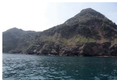
海上から見る御神島の迫力は見応え有り!!