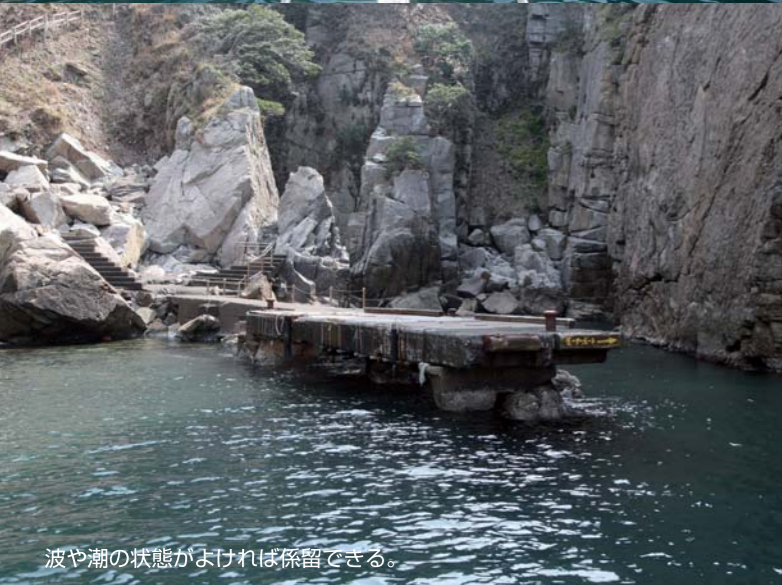
波や潮の状態がよければ係留できる。