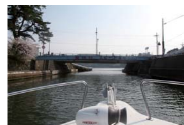
マリーナ前を通過し、水路に入る。