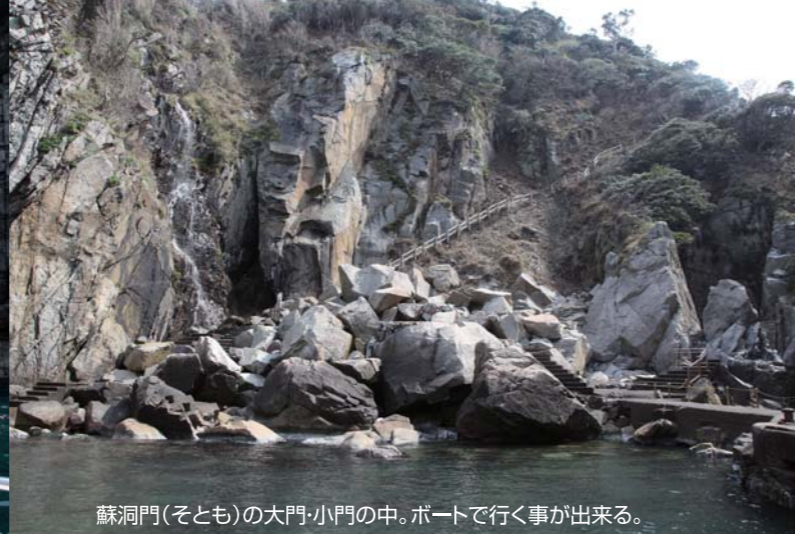
蘇洞門(そとも)の大門・小門の中。ボートで行く事が出来る。