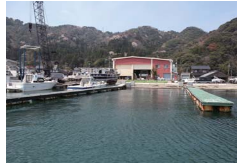
出港時に海から見えるマリナーの様子。