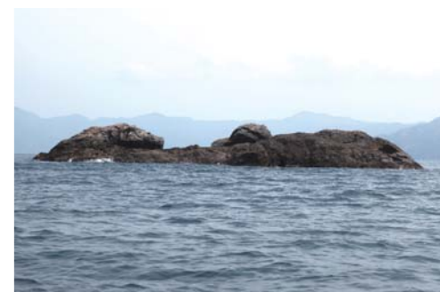
沖の石は百人一首にも登場する程有名である。