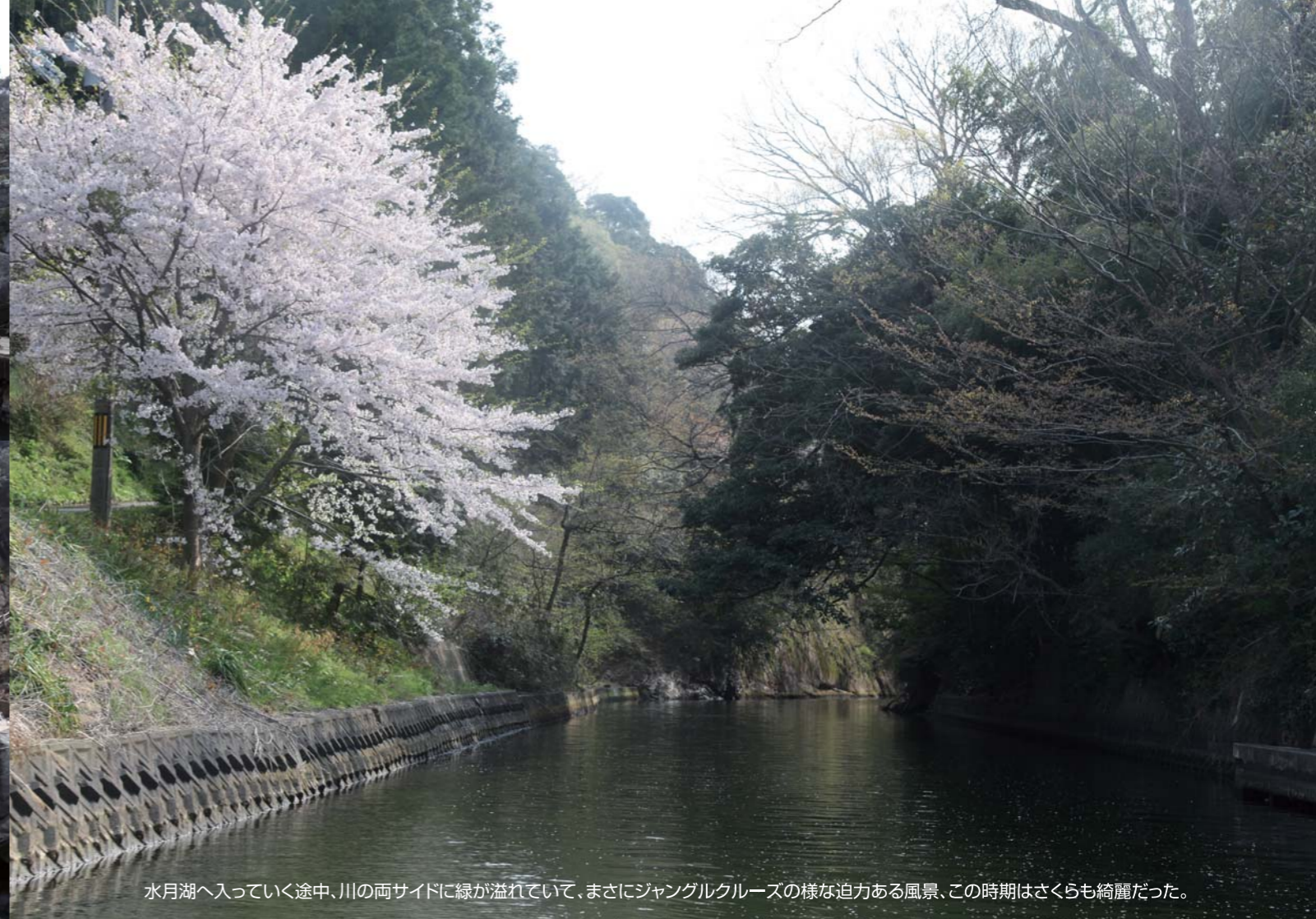
水月湖へ入っていく途中、川の両サイドに緑が溢れていて、まさにジャングルクルーズの様な迫力ある風景、この時期はさくらも綺麗だった。