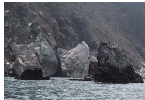
いろんな場所で奇岩を見つけることが出来る。