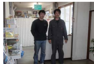
兄弟お二人とも親しみやすいです!!

見えて面白い。そして次に見えてくるのが沖の石。百人一首で歌われている。海上から見ているのが贅沢であり、迫力も違ってくる。沖の石の後は、蘇洞門(そとも)めぐりをする事。蘇洞門は小浜湾の東側に位置しており、花崗岩が日本海の波の作用で削られて出来たもので、海岸に形成された奇岩、洞門、洞窟などが約6Km程続いており、今回のクルージングの見所のひとつである!!そこには亀の夫婦のような岩や、迫力のある複数の滝、そして大門・小門と言われる門のような大小二つの門を見ることが出来る。大門・小門はジェットならくぐることも可能とのこと。今回はボートのため、別の入り口から、門の向こう側の景色を見に行く事にした。ボートで回り込んで入って行くこと上陸用に棧橋もついていた。当日の海面状況によっては上陸も出来るポイントである。大門・小門の中には吹雪の滝と呼ばれる滝があり、落ちてくる水が岩に当たって飛び散る様子はとても綺麗である。この蘇洞門めぐりでは想像以上の見所の数々に終始圧倒されてしまった。この時点で早くも取材して良かったと実感し、次なる三方五湖を目指す。マリーナ前を通過し、久々子湖へ入って行く。波が無く非常に走りやすい。水月湖へ入っていく途中に、浦見川を通過するのだが、ここがお勧めのポイント。川の両サイドに緑が溢れていて、まさにジャングルクルーズの様な迫力ある風景に遭遇出来た。水月湖も自然の中にあって、走っていてとても気持ちが良い。水面が穏やかなため、爽やかな走りを楽しむことが出来る。今回の取材では若狭湾の絶景の数々や、三方五湖の自然溢れる風景等、見所満載のクルージングとなった!!皆さんも是非、レンタルボートを借りて若狭湾や三方五湖のクルージングを楽しんでみては、いかがですか!お勧めします!