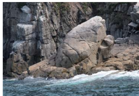
亀が2匹負ぶさっているように見える、夫婦亀岩。