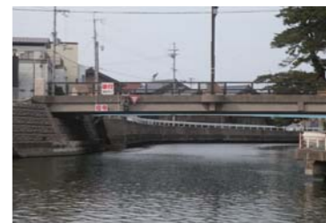
水路の信号が通行を整理している。