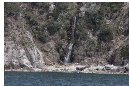
クルージング中には何度も滝を見る事が出来た。