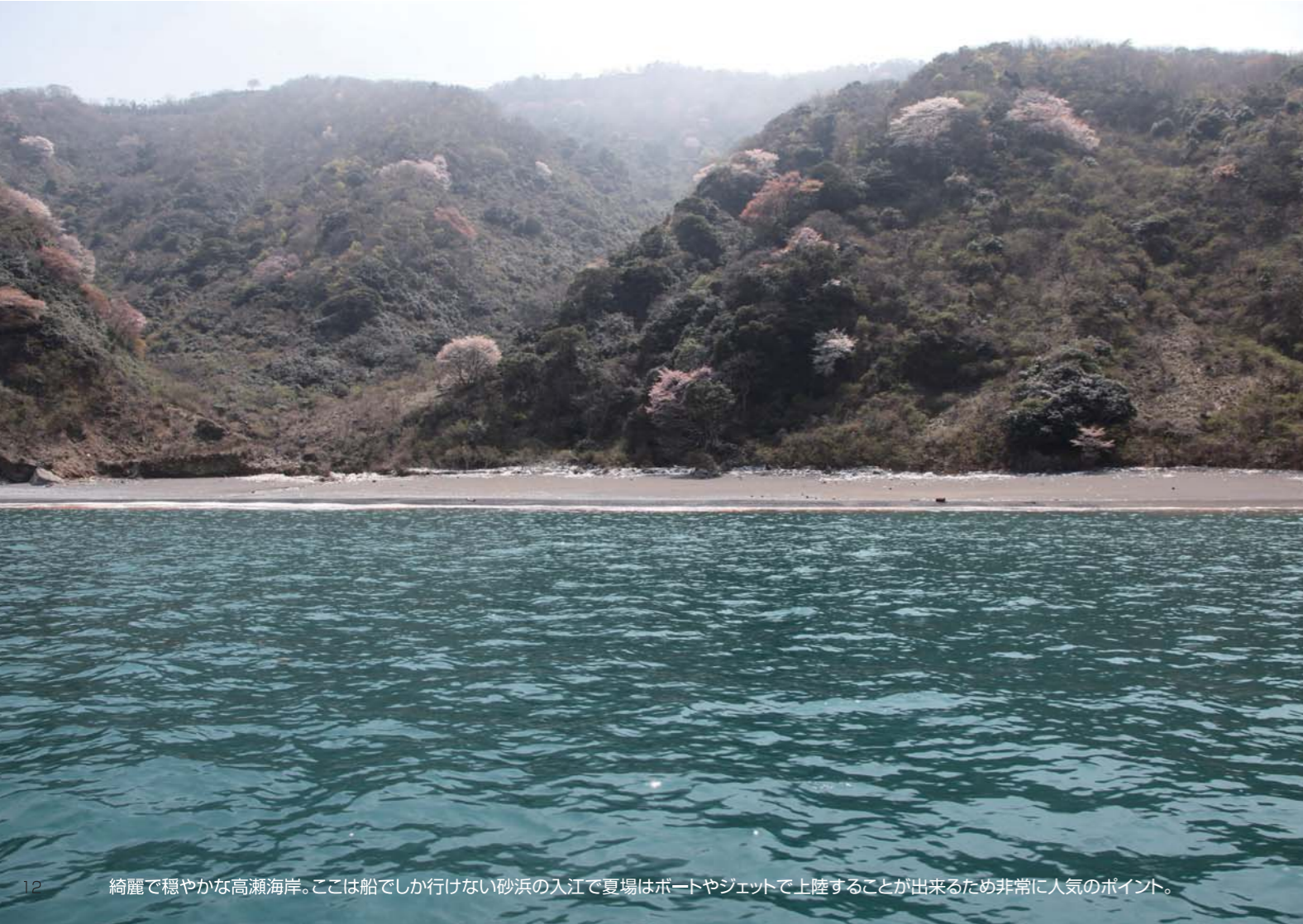
綺麗で穏やかな高瀬海岸。ここは船でしか行けない砂浜の入江で夏場はボートやジェットで上陸することが出来るため非常に人気のポイント。