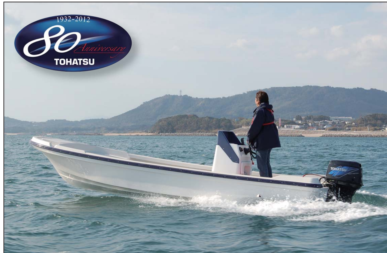
◆商品名: MFS30B EFGL