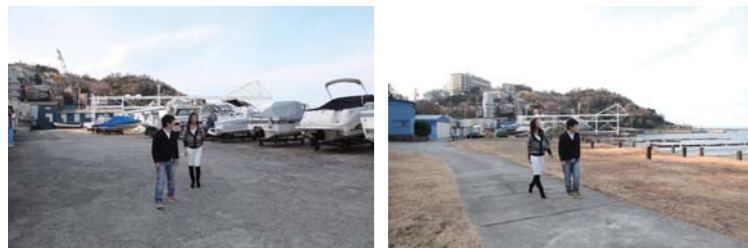
西浦半島の西側で穏やかな水面に面した西浦シーサイドマリーナ。 取材協力:西浦シーサイドマリーナ www.sea-side.to/ Tel:0533-57-5315