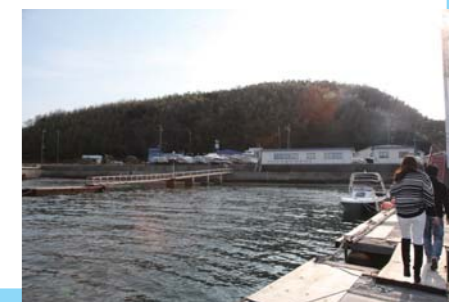
※必ず御自身で海図、GPS、魚探、天気予報等をご確認の上、安全に十分注意してお出かけ下さい。トラブル等発生致しましても当社は一切責任を負いません。

り、湯巡りが楽しみ最高。続いてお部屋は露天風呂付き特別室・露天風呂付客室・10畳・12畳タイプ・ツインタイプ・バリアフリーツインタイプがあり、日本の湯宿の情緒を十分に楽しむ事ができます。そして、いよいよお料理へ。今回はゆっくりと寛げる個室料亭「万華・万葉」で頂く和会席と、昨年12月15日新装オープンした旬景ダイニング「碧A0」で頂くプレジールランチをご用意して頂きました。個室料亭「万華・万葉」の和会席は6,500円のコースでかなりお値打ちなコースです。<お品書き>食前酒・お造り・焼き物・台物・中皿・凌ぎ蓋物・蒸し物・揚物・酢の物・止椀・飯物・水菓子。料理長が「厳選した」三河の幸を、技の限りを尽くし、個室でゆっくりと味わう事ができ、ちょっと贅沢をした気になれる大満足。特典としては食後に『大浴殿』を無料(通常1,300円)にてご利用頂