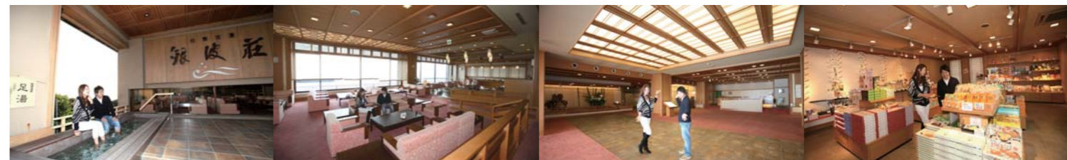
玄関前にある足湯で暖をとります。 三河湾が一望できるラウンジ。 広々として明るいロビー。 特産品・名菓・工芸品が勢揃い。