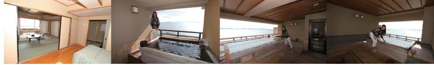
種類が豊富な天遊閣の露天風呂付き客室。露天風呂からの景色は最高。 貸切展望露天風呂の風物語(左)はバリアフリー。星物語(右)も広くて絶景。