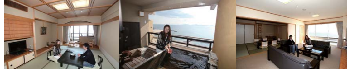
天遊閣の露天風呂付き客室はゆっくりと寛ぐ事ができ最高のロケーション。 海望閣の和洋室はゆとりのひろさ。