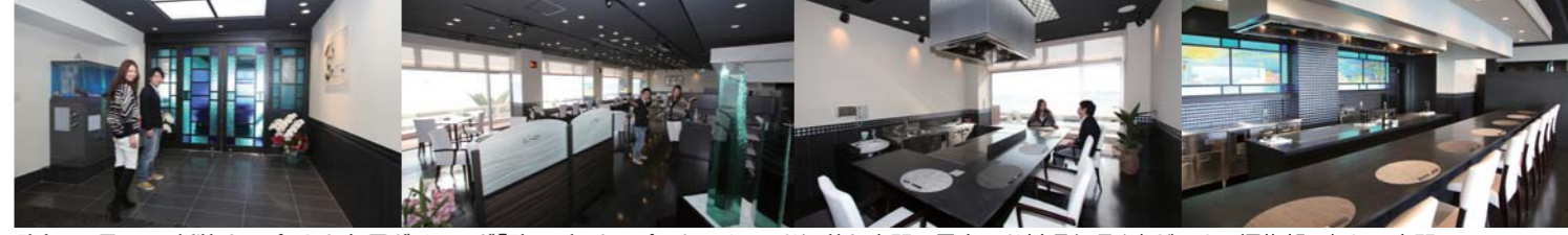
昨年12月15日新装オープンした旬景ダイニング「碧AO」。オープンキッチンのお洒落な空間で最高のお料理を頂く事ができる編集部一押しの空間。