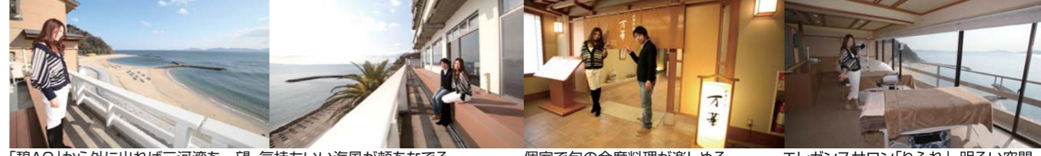
「碧AO」から外に出れば三河湾を一望。気持ちいい海風が頬をなでる。 個室で旬の会席料理が楽しめる。 エレガンスラロン「りふれ」。明るい空間。