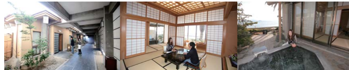
離れにある重中庵はまさに別格。将棋の羽生名人もここで対局されている。大人の隠れ家としても最高のお部屋。