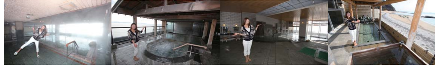
大浴場&展望露天風呂「光彩乃湯」。湯気が立ちこめていて気持ち良さそう!! 露天風呂&大浴場の神仙乃湯。開放感にあふれた露天風呂が魅力。