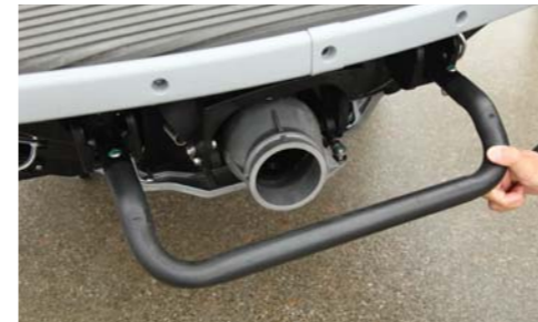
リボーディングステップにより再乗船をスマートかつ容易にするステップが装備されている。