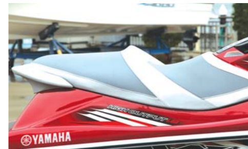
ツートンステップアップシートにより長時間のスポーツライディングでも疲労感が少ない。