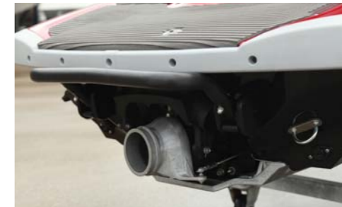
リバースシステムが前進の状態になっている時。