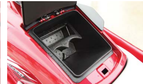
グローブボックスは収納しやすい位置にあり、使いやすい。