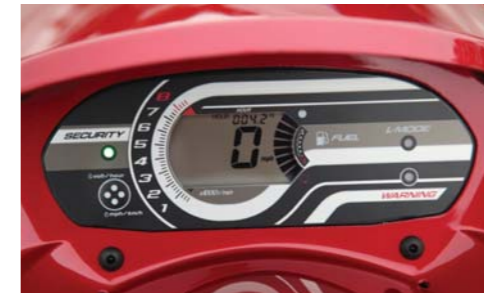
多機能デジタルメーターでは燃料計やスピードメーター等のさまざまな情報が確認出来る。