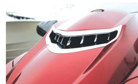
クロームメッキパーツは太陽の光を反射して輝き、高級感に溢れている。