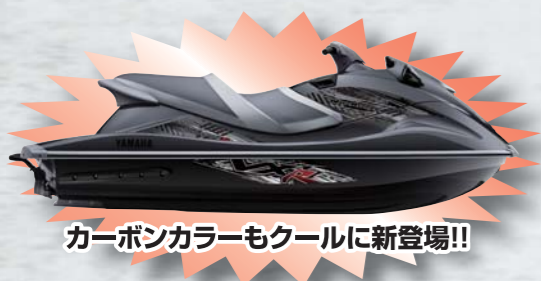
カーボンカラーモデルに新登場!!