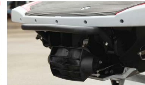
リバースシステムが後進の状態になっている時。

今回で紹介するのはヤマハ発動機株式会社より発売されたニューモデル、『MJ-VXR』。前年人気だったこのシリーズがニューカラー&グラフィックで登場した!!今回撮影したクリムゾンレッドメタリックカラーは光沢のある赤色がとてもインパクトがあり、見ていると思わず引き込まれそうになってしまう。同じくニューカラーのカーボンカラーも負けず劣らず迫力があり、引き締まった筋肉質なボディのような船体が一層引き立てられている。そして肝心の走りの方はというと、見てとても気持ちの良い走りを見せてくれたのである。エンジンは1.8リッターNAエンジンを搭載しており、瞬発力が素晴らしく加速性能は