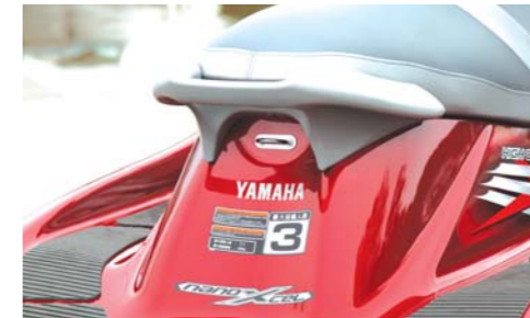
ウエイクボードなどのトローイングに便利なトローイングフック。マリンスポーツの楽しみを広げてくれる。