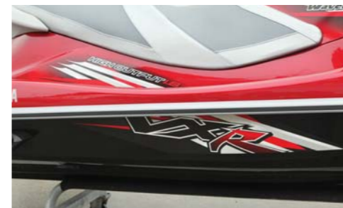
インパクトがありとても迫力があるVXRのロゴ。

マリンジェット製品情報: www.yamaha-motor.jp/marine/