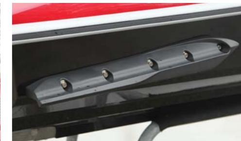
スポンソンにより走行時の高い安定性が確保されている。