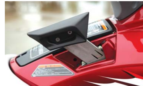
リバースシステムによりレバー操作ひとつで前進後進のシフト切替が可能になっている。