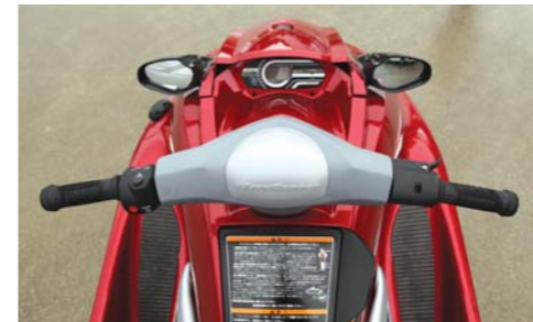
電子制御スロットルシステムによりスロットル開度はデジタル信号化されエンジンに伝わる。