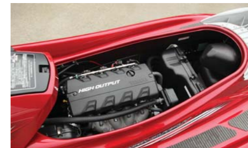
1.8リッターNAエンジンの特長は、爽快な吹き上がり。胸のすく加速性能を発揮してくれる。