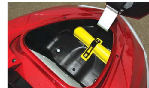
バウ大型物入れはとても広く、収納にはとても便利である。