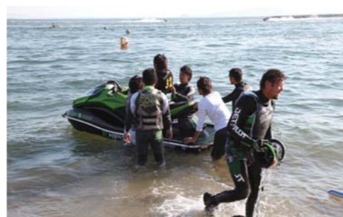
見事トップでバトンを渡した優勝チームサーガラ!!