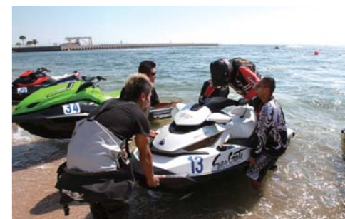
90分走りきると降りるのも大変そうです!!