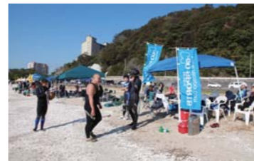
選手交代を待つチーム員。