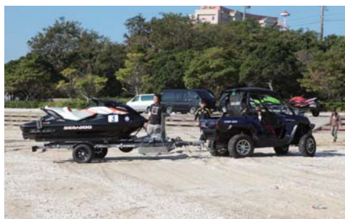
大阪から参戦のチームキーウエスト!!