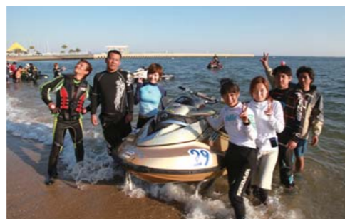
大分県から参戦したチームもありました!!