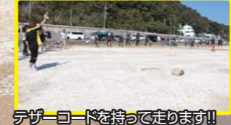
デザークードを持って走ります!!