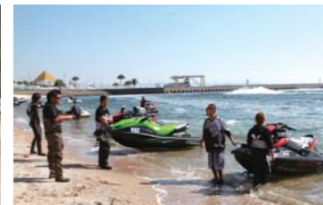
念入りな打ち合わせが必勝の秘訣!!