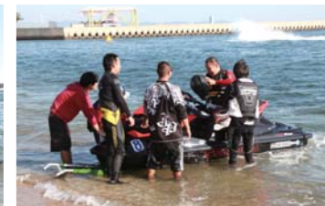
陸に戻って来るころにはもうへトへト。

したのは『TEAM KEY WEST』。井上選手が安定感抜群の走りです。90分間を見事に走りきり優勝した!!SCクラスは『FAST JOKER』が見事接戦を制し、1周差で優勝を勝ち取った!!そして最後に行われたのが、こちらもハイレベルな争いとなったサウザンドSCクラス。ここで魅せたのが愛知県常滑市にあるマリンスポーツゲレンデサーガラさん率いる『エルインターナショナルレーシング 1 by SAGARA』。抜群のチームワークとマシンを完全に乗りこなすスキルを魅せてくれて、見事に優勝の栄冠を勝ち取った!!仲の良さがひしひしと伝わってくるチームワークがとても素晴らしく、終始レースを存分に楽しみながらも見事に優勝という結果を出してしまったのだ!!そしてこのクラスには急遽元A級ライダーのシー