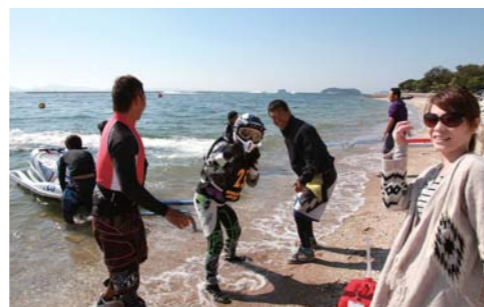
走り終えてカメラにピース!!まだまだ余裕!?