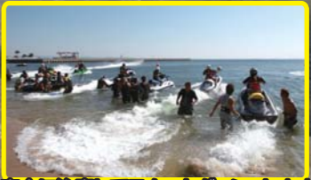
安全に注意してスタートダッシュします!!