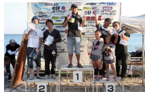
SEA DOO CUP NA RUNABOUTクラス表彰。