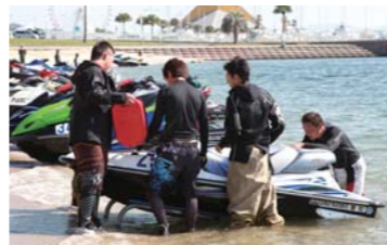
ピット作業は冷静さがとても重要!!