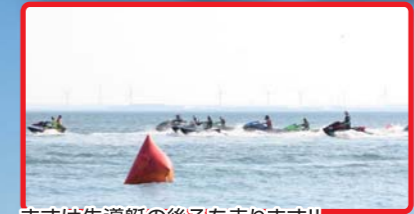
まずは先導艇の後ろを走ります!!