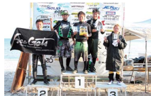
サウザンド SC RUNABOUTクラス表彰。