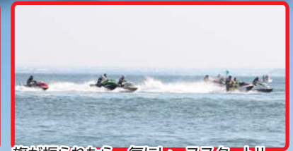
旗が振られたら一気にレーススタート!!