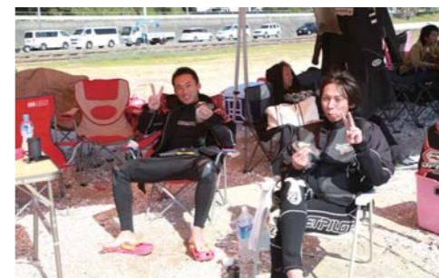
レース前はおにぎりを食べて、のんびりモード!!