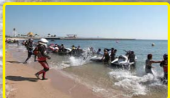
水しぶきが飛んで迫力満点!!