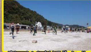
一気にマシンに向けてダッシュ!!