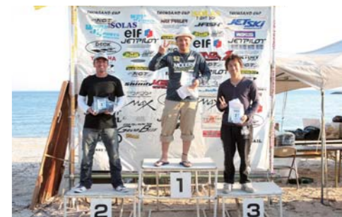
サウザンド NA RUNABOUTクラス表彰。