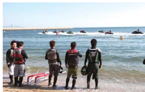
大事なスタートの瞬間を固唾を飲んで見守ります。