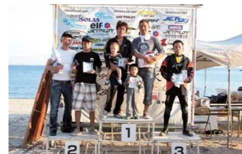
SEA DOO CUP SC RUNABOUTクラス表彰。