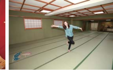
宴会場は奥行き十分な広さです!!