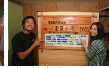
温泉は天然温泉が楽しめます!!