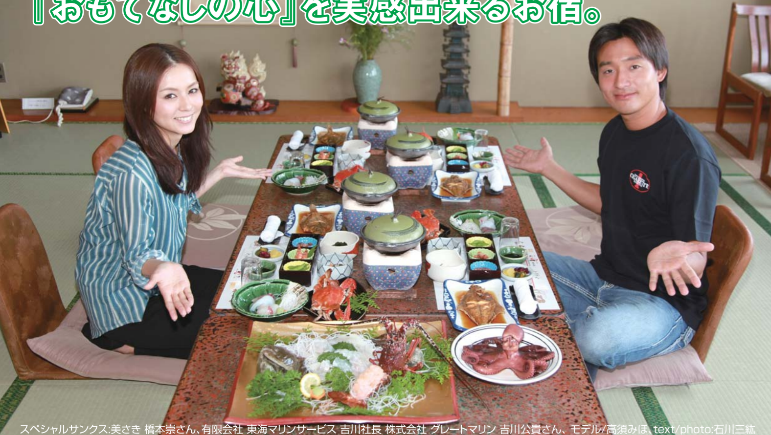
スペシャルサンクス:美さき 橋本崇さん、有限会社 東海マリンサービス 吉川社長 株式会社 グレートマリン 吉川公貴さん、モデル/高須みほ、text/photo:石川三純