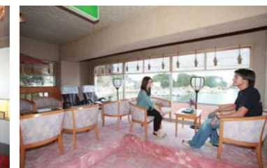
窓の外には港が見えます。