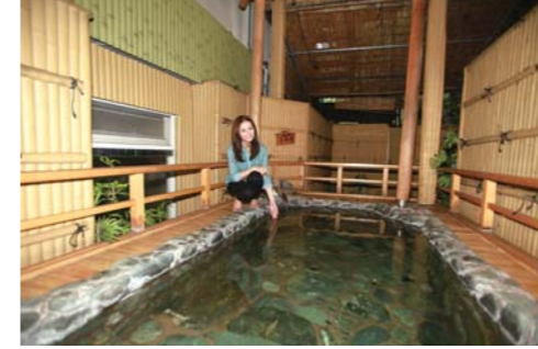
露天風呂は雰囲気抜群でリラックス出来ます!!