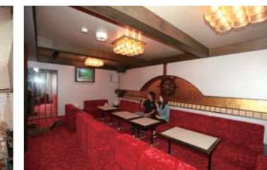
カラオケも完備されています!!