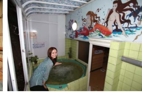
ヨーロッパスパではのんびり寛ぐことが出来ます!!