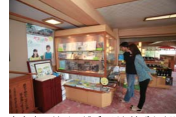
有名人のサインがズラリと並びます!!