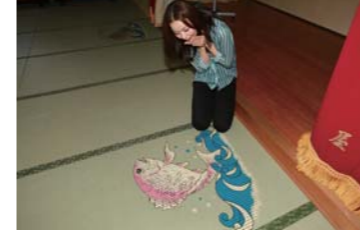
なんと畳の上でタイを発見!?