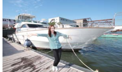
今回はVITECH58に乗って出発します!!