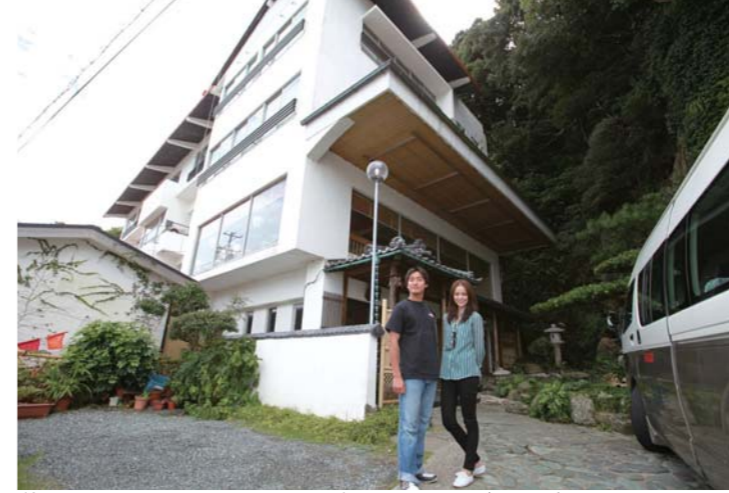
美さきさんはとてもアットホームで親しみ易い雰囲気のお宿です!!