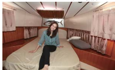
寝心地抜群のベットもついてます!!