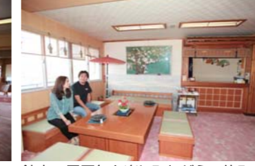
館内の雰囲気を楽しみながら一休み。