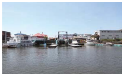
今回はグレートマリンさんから出港です!!