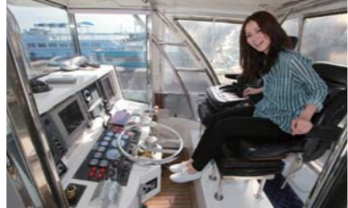
あまりの広さにみほちゃんもビックリ!!