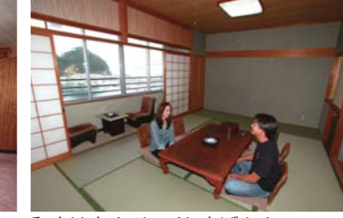
和室は広く、ゆっくり寛げます。