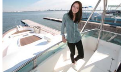
58フィートということで広さは抜群!!