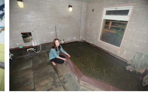
やっぱり天然温泉は最高!!疲れが取れそうですね!!