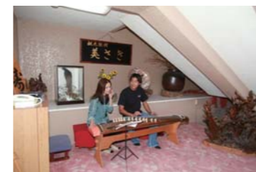
館内では琴を見ることも出来ました。