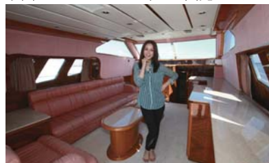
キャビンはまるでホテルのような豪華さ。

Y'S GEAR ウエストボーテ・ライフラフトジャケット (自動タイプ)¥18,270