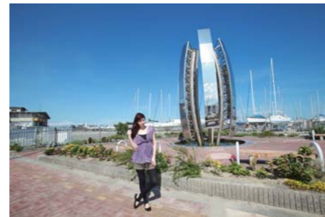
毎月ヨット教室等の楽しいイベントを開催してます!!