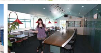
2階席はとっても雰囲気が良いです!!