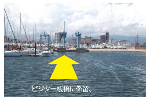
ビジター棧橋に係留。

※必ず御自身で海図、GPS、魚探、天気予報等をご確認の上、安全に十分注意してお出かけ下さい。トラブル等発生致しましても当社は一切責任を負いません。