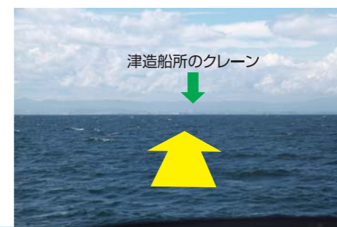
津造船所のクレーン