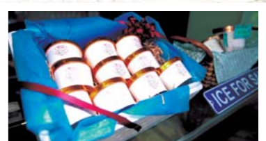
自家製アイスクリームはとても人気!!