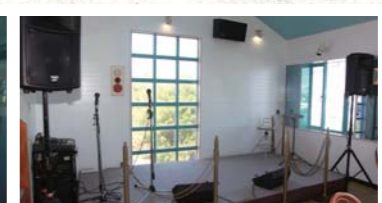
コンサート等も開催されています。