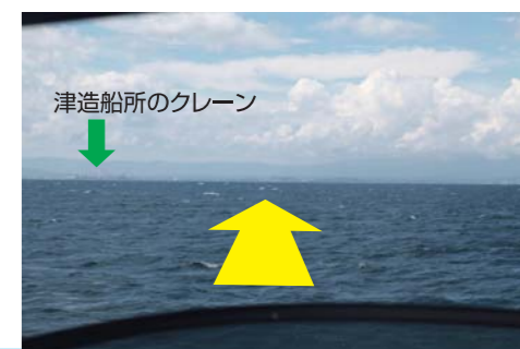
津造船所のクレーン