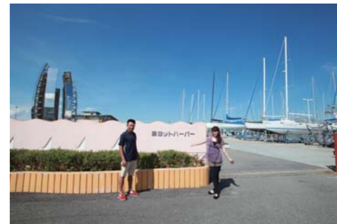
とってもフレンドリーなヨットハーバーでした!!

行き、入港口を見つけたら入って行きます。あまりテトラに近づき過ぎないように注意して船を走らせて行けば、津ヨットハーバーさんのビジター棧橋に到着です!!このビジター棧橋に係留する際には必ず事前連絡が必要ですのでお忘れなく(料金は1,100円)。到着後はクラブハウスで受付を済ませ、早速お店に。徒歩5分程ですぐに到着。ハワイアンな雰囲気が抜群で目の前には伊勢湾が広がります。そして料理はどれも絶品!!肉汁たっぷりのジャパニーズロコモコ、とってもまろやかな味