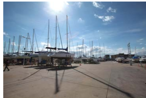
広大な陸上ヤードにはヨットやポートがズラリ。