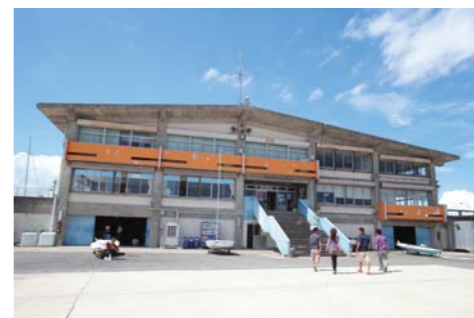
津ヨットハーバーのクラブハウスに向かいます。