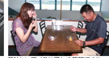
美味しいアイスに思わず笑顔です!!