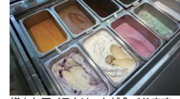
様々なアイスクリームが食べれます。