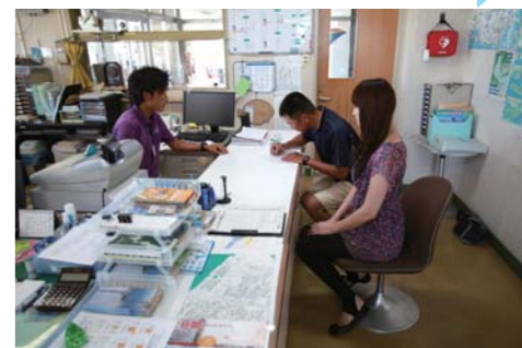
ビジター棧橋に係留する際には受付が必要です。