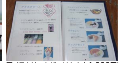
アイスクリームバーはなんと1,000円!! ロコモコ等の人気メニューがいっぱい!!