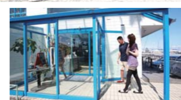
お洒落な店内へ入って行きます。

◎単品人気メニュー◎ ジャパニーズロコモコ ¥1,200 明太子クリームスパゲティ ¥1,000 ミックスピザ ¥1,000 ベーコンとツナのドリア ¥1,000