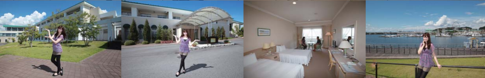
ラグナマリーナから渡し船に乗って簡単に行くことのできるホテルラグーナヒル。このホテルは綺麗で高級感があり、ラグーナ蒲郡からもすぐの位置にあるため、1日遊んだ後に泊まる事も出来る。また、女性に人気のタラソテラピー(フランスの伝統的な方法のひとつで、海の恵みを使った健康美容法)を受けることも出来る。

グルメクルージング第92弾!!今回ご紹介するのは三重県津市にあるシーサイドカフェテラス マリーナさん。ここはハワイアンな雰囲気が漂うお洒落なカフェで、ジャパニーズロコモコやミックスピザ、千円で食べ放題の大人気アイスクリームバーが楽しめるお店。ポートで行くには津ヨットハーバーさんが徒歩5分程の所にあるので、今回は津ヨットハーバーさんにポートを係留させて頂き取材することに。ここは三重県津市にある大型ヨットハーバーで、陸上ヤードには多数のヨットにポートがズラリと並んでいます。毎月クルーザーやヨットの体験イベント等の人気イベントを多数開催していて、とても活気があって雰囲気の良