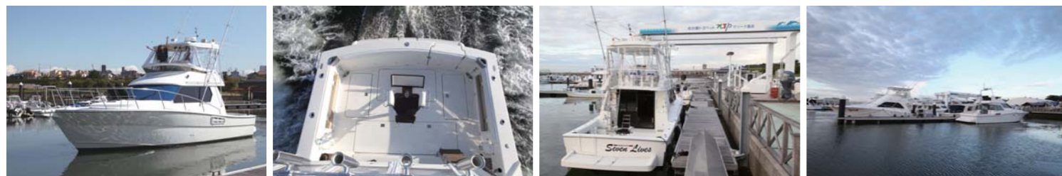
今回、活躍してくれたトヨタポーター37。自動車のリペア技術を船に転用しピカピカにリペアされていて本当に綺麗でカッコイイクルーザーだ。ここNTPマリーナ高浜は名古屋市内から45分のベストポジション。イベントも数多く行われ、毎年行われるクリスマスのイベントは人気のイベントの一つ!凄く楽しいマリーナだ。