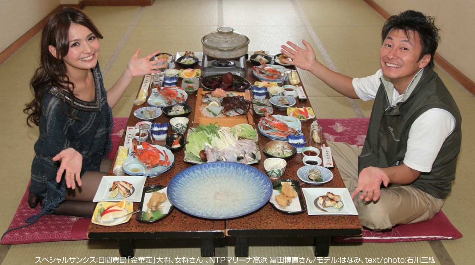
スペシャルサンクス:日間賀島「金華荘」大将、女将さん、NTPマリーナ高浜 富田博直さん/モデル:はなみ、text/photo:石川三紘