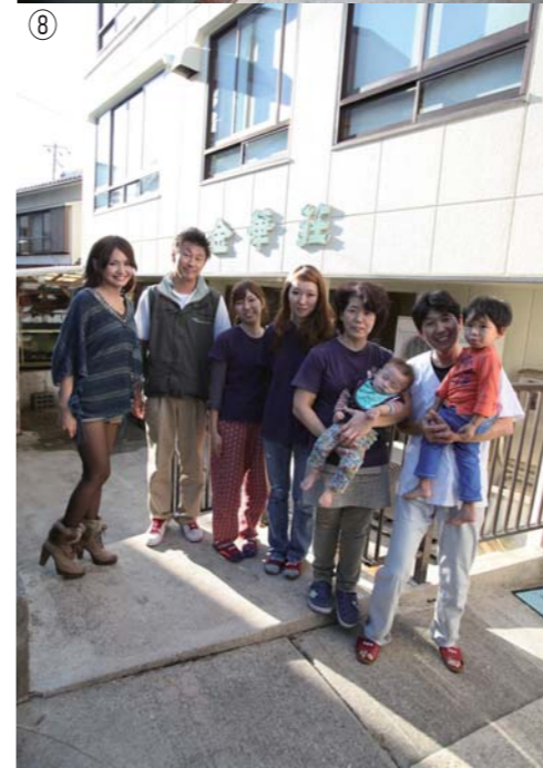
① ゆっくりと落ち着いた喫茶コーナー ② 日間賀島のお土産が並んでいるコーナー ③ 客室 ④ 客室 ⑤ 広間 ⑥ 大広間 ⑦ 新しいお風呂、窓も広くのびのびと寛げます ⑧ 大将と女将さん、娘さんとお孫さん。凄くアットホームなお宿です ⑨ 凄く可愛いお孫さん! ⑩ お兄ちゃんは寝起きでご機嫌斜めでした!