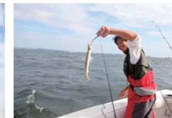
エソしか釣れず思わず苦しい。