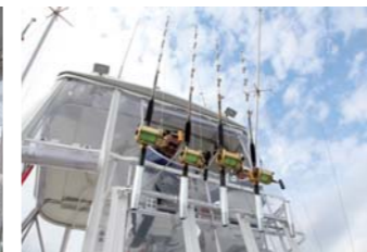
完全に諦めて湾内釣りモードに切り替えた本部艇。