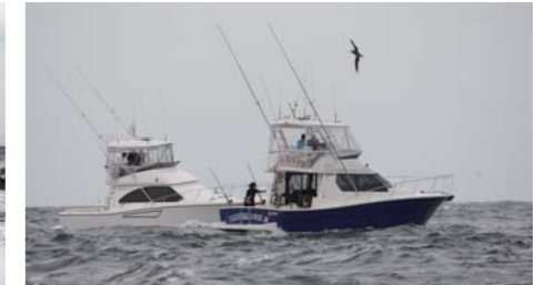
沖から戻ってきた仲間の船。今からどうするか相談中のようなのだ。