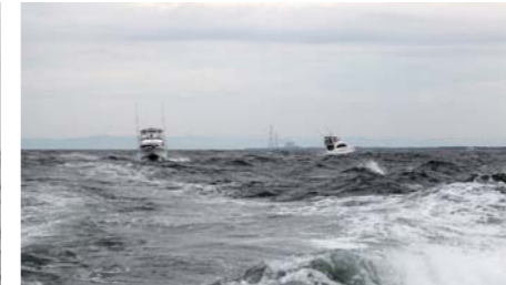
波が高く潮の流れも速かったため、沖に出てのトロリングは難しそうな海況。