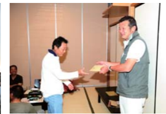
「遅くまで引っ張ったで賞」でガソリン券が送られた!