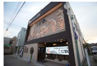
打ち上げが行われたうお鉄さん。