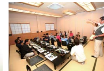
恒例のジャンケン大会!