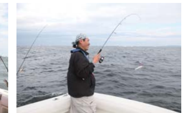
名人でもエソしか釣れません!