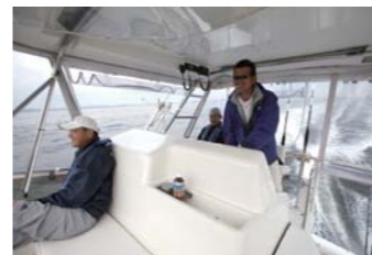
この時点ではやる気満々です!