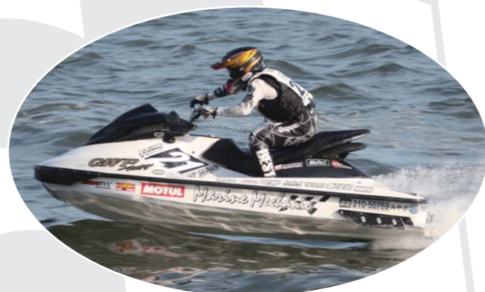
究極の速さを突詰めて登場したスーパースター竹野下選手は惜しくも入賞には手が届かなかった!