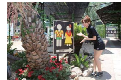
ここ三河大島はトイレや脱衣場があり、設備が充実している。海外の観光地のようにかなりお勧めポイントかもしれない!