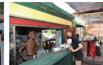
ラストカラーの店内は雰囲気抜群!気さくな店長との話が弾みます!

ビーチハウスサザン 予約直通:090-8548-2347 TEL/FAX:0532-64-4563