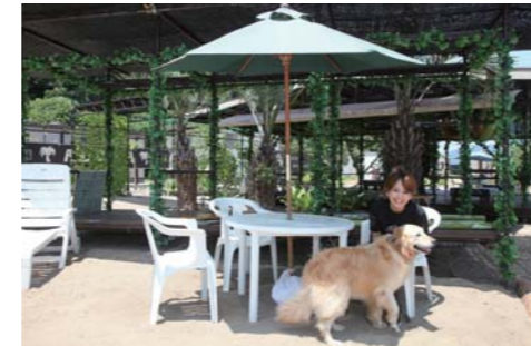
マスコットも可愛いですね!三河湾じゃないような景色!