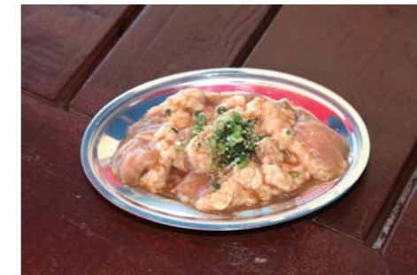
お店一押しの絶品牛ホルモンは¥1,050。