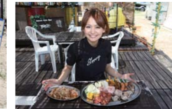
3,000円のBBQは予約制!一番人気はなんと手作りケーキ¥400!!