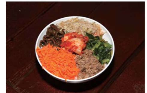
人気メニューのピビンバはかなりの絶品!お値段は¥630とお値打ち!