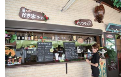
人気のかき氷はレインボーカラーが大人気!ドリンクも豊富に取り揃えられている。