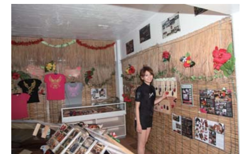
可愛いアクセサリショップを発見!必見の価値有りますよ!