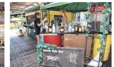
バーカウンターもあり、海を見ながらお洒落な一杯が楽しめる。