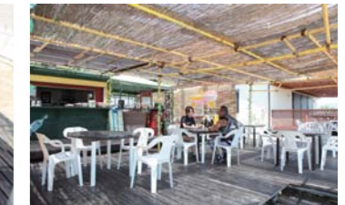
落ち着いた雰囲気の店内にはレゲエが流れています!