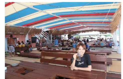
なんととってもこの広々とした日陰が一番の魅力かもしれない!ここにいたら、のんびりできますよ!

海の家 LOCO TEL:090-3300-2520 FAX:090-5009-3486