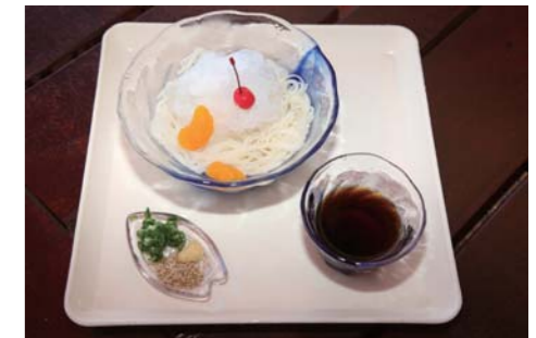
好評のそうめん¥630も気になるところだ!