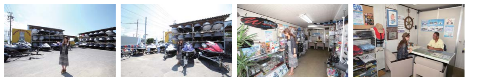
ヤマハマリッジットの販売台数日本一を更新し続けるマリンショップアルファの御津店。穏やかな水面が目の前のベストポジション!週末には沢山のお客様が訪れ、いつも賑わっているお店!ニューモデルも各種展示されていて、実際に見る事が出来るのは有り難い。いろいろなイベントも計画されているので、お店に遊びに行くと面白い情報が聞けるかも!是非お出かけ下さい!