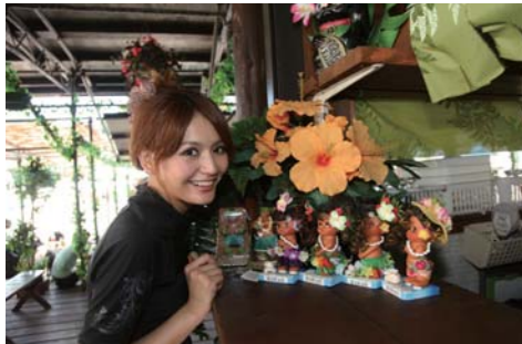
ノースショアの海沿いのお店を思い出させてくれる。