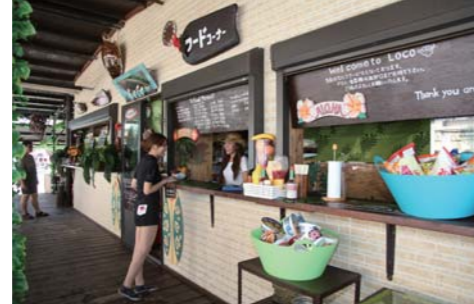
フードメニューも充実!お店のスタッフの皆さんも優しく楽しくて楽しいお店。