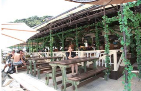
店内はトロピカルに統一されていて、ハワイのローカルを感じることができる。