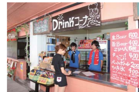
ドリンク類も充実!かき氷は定番ですね!