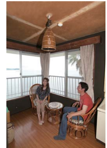
広い窓から明るい日差しが差し込んで気持ちいい空間です。