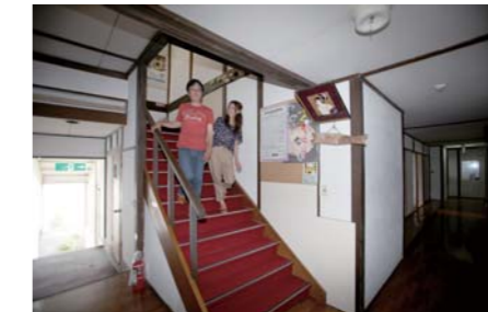
日本家屋の暖かな雰囲気が楽しめるお宿です。