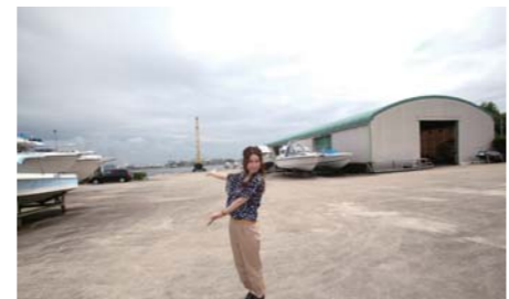
広々としたヤード。大型艇からジェットポートまで余裕で保管する事が出来る。