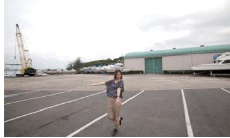
駐車場も広くヤードに停めてあるマイボートまで直に行く事が出来便利です。