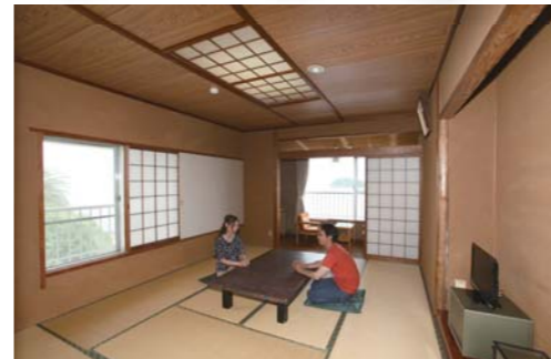
お部屋は落ち着いた和室です。

愛知県知多郡南知多町日間賀島 電話:0569-68-2131 FAX:0569-68-2585 www.ipc-tokai.or.jp/~kachimaso/