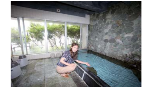
お湯はラジュウム泉。効能は冷感性、腰痛、リュウマチなどにいいそうです。