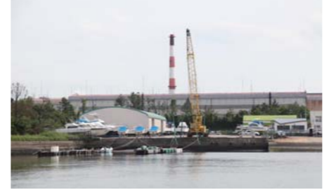
半田インターからのアクセスが最高に便利になったマリーナ。是非、お出かけ下さい!