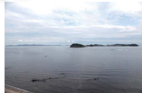
お部屋からの景色。綺麗な三河湾が一望できます。