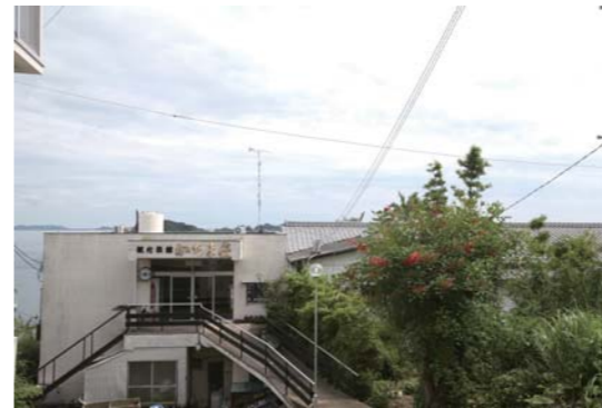
お宿は日間賀島南側の凄く景色がいいところに建っている。