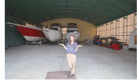
屋内艇庫はこの地区最大級の広さ!まだ、余裕有り!お気軽にお問い合わせ下さいね!!