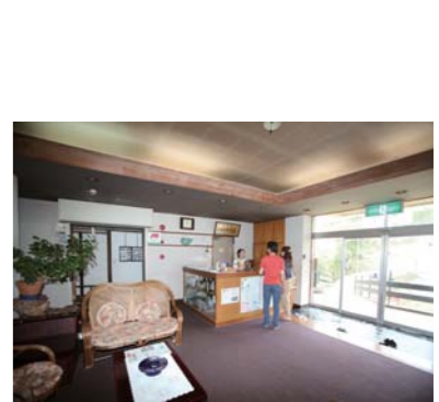
フロントで受付をします。