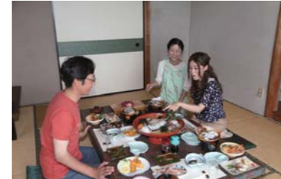
優しい女将さんがお料理の説明をしてくれました。