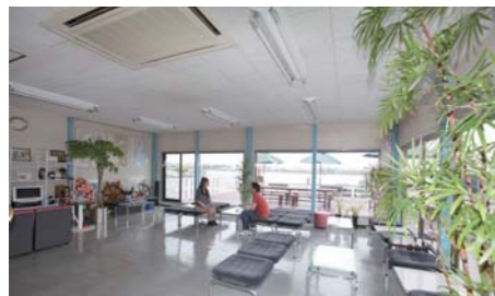
衣浦マリン観光サービスさんのクラブハウスは明るくて凄く綺麗。