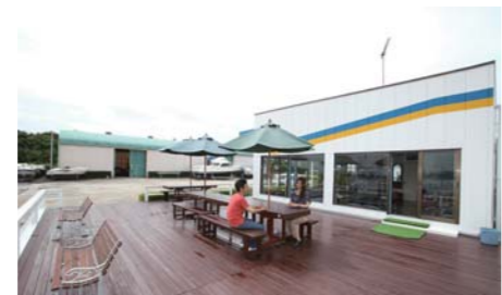
手作りのウッドデッキはゆっくりと寛ぐ事が出来る。