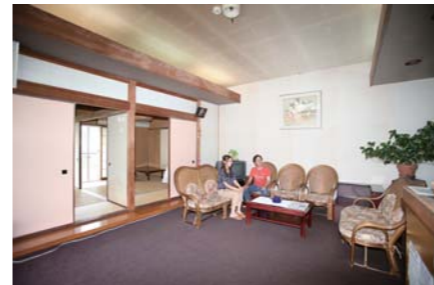
ロビーでお部屋の準備ができるまで休憩します。