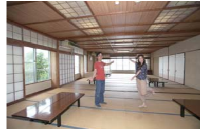
56畳の大広間。大宴会も大丈夫!