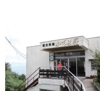
お邪魔する前にまず玄関で記念写真!