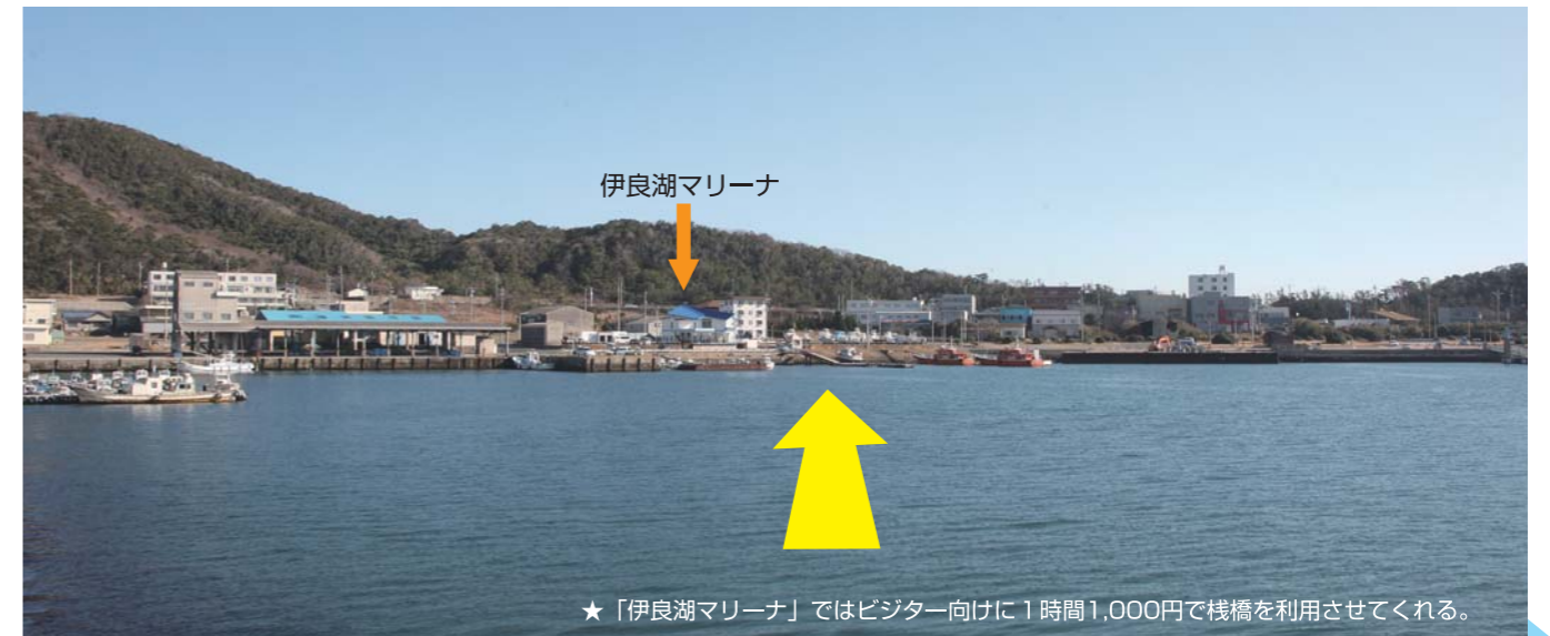
★「伊良湖マリーナ」ではビジター向けに1時間1,000円で棧橋を利用させてくれる。