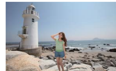
伊良湖岬灯台!向こうに見えるのは神島です。伊良湖水道が目の前に……!!