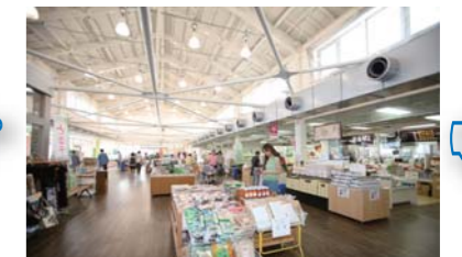
地元の食材が凄くお値打ちに売っている道の駅です。

キロのドライブ。距離も最適で、他にも一杯いきたい所は有るが次回の楽しみに取っておこうと思う。クルージング、グルメ、ドライブ。今回は実に充実したグルメクルージングだった。皆さんも是非一度、お出かけ下さい!かなり楽しめますよ!本当に!!!