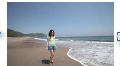
凄く綺麗な恋路ヶ浜。太平洋が一望できます。海も綺麗ですよ!