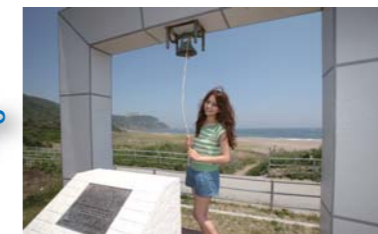
恋人同士で鐘を鳴らすと良い事が有るんですって!