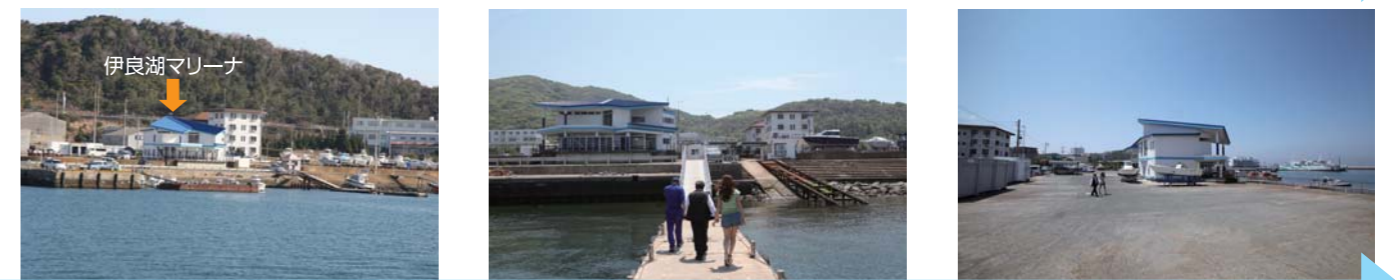
※必ず御自身で海図、GPS、魚探、天気予報等をご確認の上、安全に十分注意してお出かけ下さい。トラブル等発生致しましても当社は一切責任を負いません。

入れて、その上に大アサリのフライが乗っていて、カレーが掛かっているだけなのですが、和風と名前がつけただけあってカレーが実に美味しい！和風のだし汁で煮込んであるのか、まるやかで旨味が一杯に広がって、かなりポイントが高い。大アサリフライとの相性もよく絶品！あと、大アサリカツ丼も捨てがたい。ほとんどの男性はカツ丼が好きだとは思いますが、まさにカツ丼を超えた逸品と言っても過言ではない。大アサリフライがだし汁に混ぜた卵とベストマッチ。豚肉とはひと味違った旨味があって、こちらもかなりお勧めです。他にも単品料理が多数あって、何度か通わないと制覇はできない程!!美味しい地元の名物料理を食べたい方は是非、お出かけ下さい！続いてはレンタカーで伊良湖を