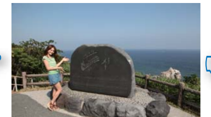
島崎藤村の椰子の実の叙情詩「名も知らぬ…」の記念碑が建っている。