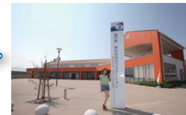
赤羽ロコステーションに到着。ここはサーフィンのメッカで海岸線も凄く長い!