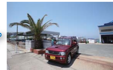
伊良湖マリーナさんを出発!すなばさんで食事をして観光地巡りのドライブへ!

伊良湖岬レンタカー 車種:三菱パジェロミニ 4台 カラー:赤、青、緑、黄色 料金:3時間まで¥3,000 4時間まで¥3,500 5時間まで¥4,000 5時間以上24時間まで¥5,000 以後1日(24時間)ごと¥5,000