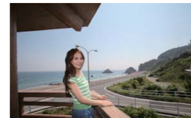
途中にあるドライブインでも一服できますよ!ここからの景色も綺麗です。