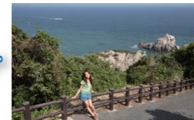
ビューホテルを過ぎて直ぐに有る展望台の景色は最高です!