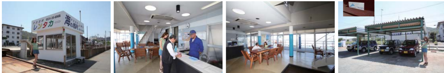
伊良湖マリーナさんではレンタカーを借りる事が出来る。レンタカーは三菱のパジェロミニ(4人乗り)。かわいらしい4色が勢揃い！乗り心地も最高に良いですよ！！

今回ご紹介するグルメクルージングは愛知県渥美半島の先端伊良湖(いらこ)。愛知県でも有名な観光地で一年を通して人気があるスポット。今回お勧めするコースは船でクルージングを楽しみ、そこからレンタカーで観光スポットを巡り、ドライブも楽しんじゃうコースで美味しい物を食