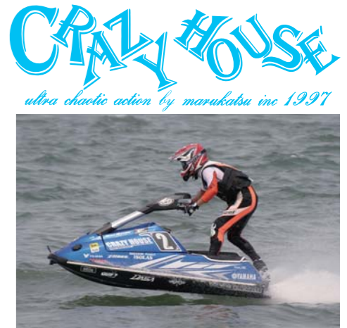
http://www.crazy-house.jp/ CRAZY HOUSE クレージーハウス 丸勝 〒494-0001 愛知県一宮市開明字北釈迦堂34-2 TEL:0586-44-8730/FAX:0586-44-2141

を通過しても直ぐに日間賀島に向けて舵を取らないで下さい。浅瀬が続いているので干潮の時は危険です。河和に向けてしばらく走り日間賀島の最西端が見えたら大きく回り込む形で南下して下さい。日間賀島西側も浅瀬が多く西港前の鼠島周辺は特に危険なので、十分注意をして航行して下さい。日間賀島南側は岩場が沢山有り、海苔網も入っていますので篠島と日間賀島の間をゆっくり航行して下さい。いよいよ暖かくなってきました!マリンスピーシーズの到来です!そろそろ船を点検してクルージングに出かけてみてはいかがでしょうか!この地方はクルージングスポットが沢山あります。是非、ハイピッチを持ってお出かけ下さいね!シーズンイン!!