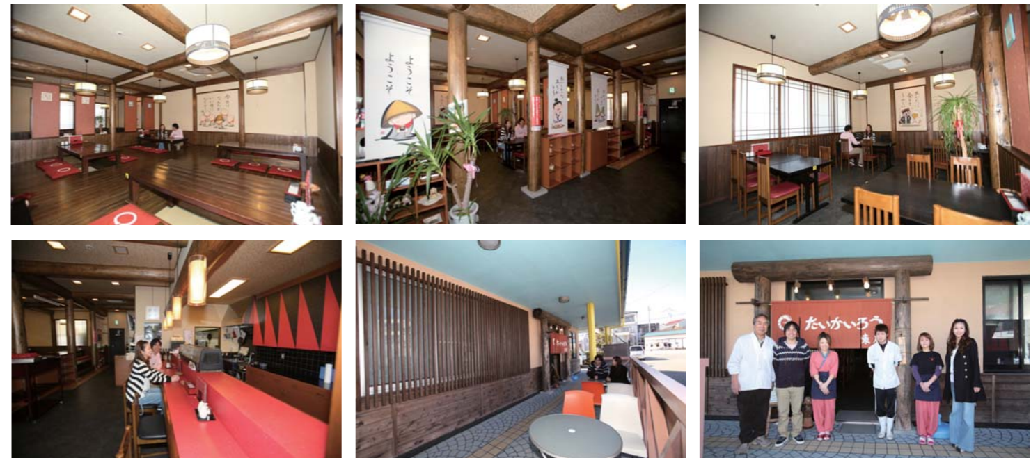
お食事処 たいかいろう東店 〒470-3504 愛知県知多郡南知多町日間賀島東港 http://www.taikairou.jp/shokujidokoro.htm TEL:0569-68-3773 営業時間/10:30~22:00 定休日:木曜日