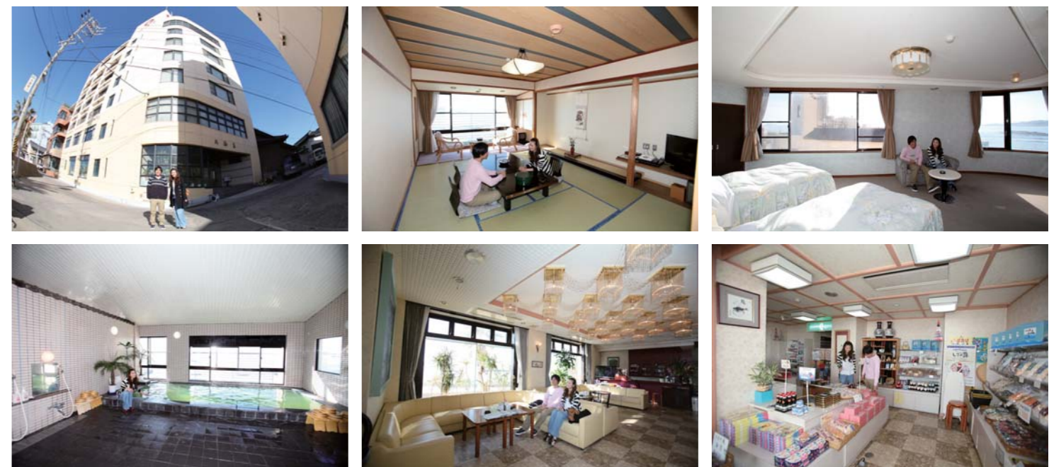
大海老 愛知県知多郡南知多町日間賀島西港 南知多・日間賀島 大海老 たいかいろう TEL:0569-68-2144/FAX:0569-68-2188 http://www.taikairou.jp/

お食事 ●刺身定食 全一〇五〇円 ●フライ定食 全一〇五〇円 ●海老フライ定食 全九五〇円 ●六子白焼定食 全九五〇円 ●焼き定食 全九五〇円 ●天ぷら定食 全九五〇円 ●六子丼 全八四〇円 ●定食セット 全二一〇〇円 (白飯・お味噌汁・お漬物)