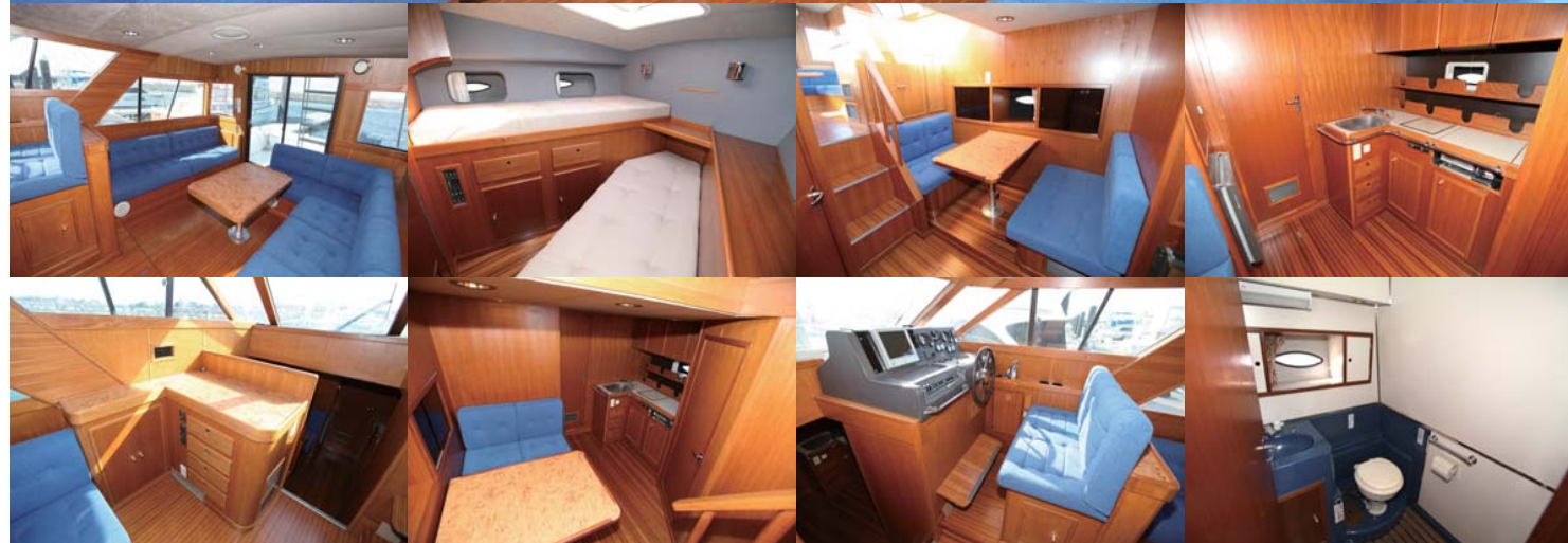
チークは全面修正済み。うっすらと艶を出し、品良く仕上がっていた。シートと天井は全面張り替え。それだけでも、十分にイメージは変わる。細かな部品はすべて取り外し磨きが掛けられていた。キャビン内も確実に生まれ変わっていた。見事な仕上がりがだ。