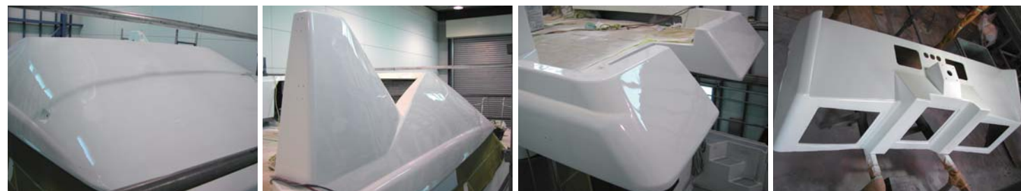
数回に分けて重ね塗りをし、表面に厚みと艶を出していく。ここで車の技術が生かされてくるのが色あわせ。白といっても色ムラは出てしまう。船の場合、車ほどシビアな話ではないが、きっちりと色を乗せていくのは流石である。また、磨き上げに関してこそごく丁寧に磨き上げられているのが一目で分かる。