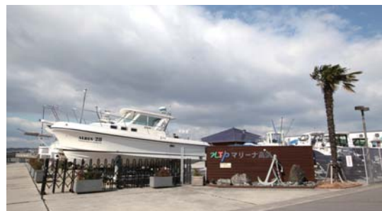
取材協力:NTPマリーナ高浜 愛知県高浜市青木町1-1 TEL:(0566)54-5300 http://www.ntp.co.jp/marina/