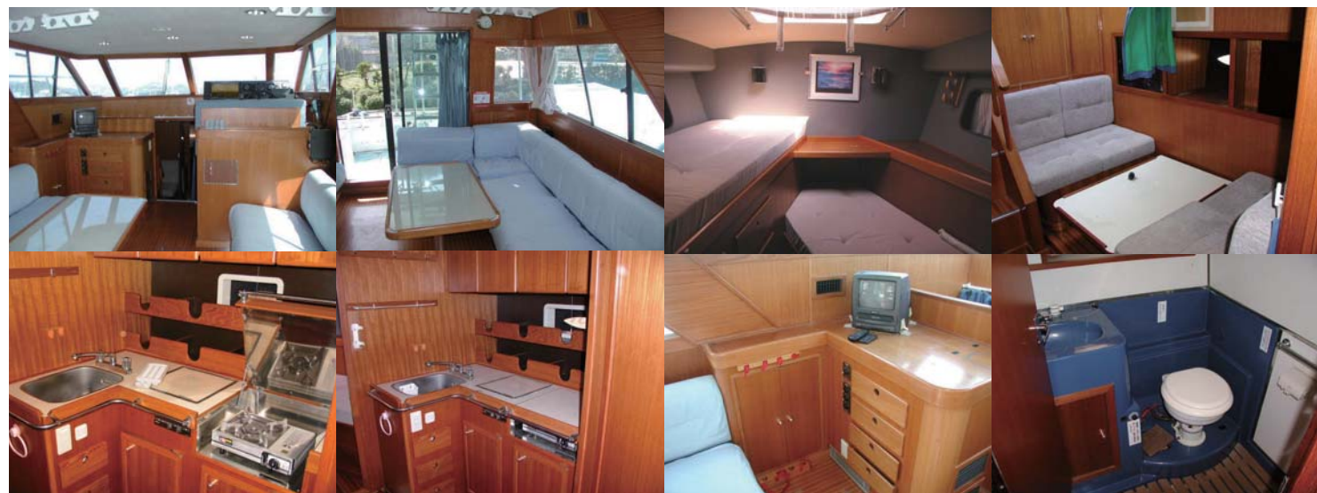
レストア前のSF-51のキャビン。どことなく古いイメージを感じてしまう。機装品も昔のもので、今ではあまり見かけないものばかり。とはいえ、ヤマハ製。使われている家具は物がいい為、すべてを壊して作り直す必要はない。チーク材を補修すれば十分に綺麗になりそうだ。