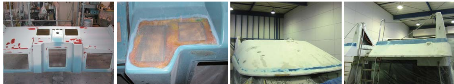
とことん綺麗な面だしにこだわり、削り込んでいく。この作業に時間を掛ければ、掛けるほど塗装をした時の仕上がりが違ってくるのだ。妥協することなく、拘り抜いた作業は流石と言える。