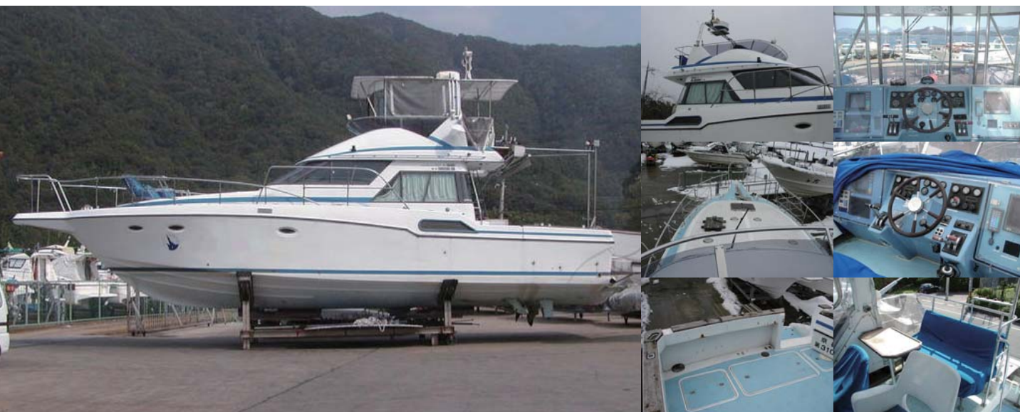
レストア前のヤマハSF-51。年式は1988年。昭和63年、いろいろな機装が付いていて、傷や汚れがひどい。この船が、どう生まれ変わるかこう、ご期待!!

「このレストアは自社サービス課スタッフの技術向上の為にマリーナとして初めて挑戦したレストア作業で、車で培ってきた知識と技術を船に転用して、いかにレベルの高いレストアが出来るかをスタッフ全員でチャレンジしてみた結果、ここまで出来たのだと言う自信に繋が