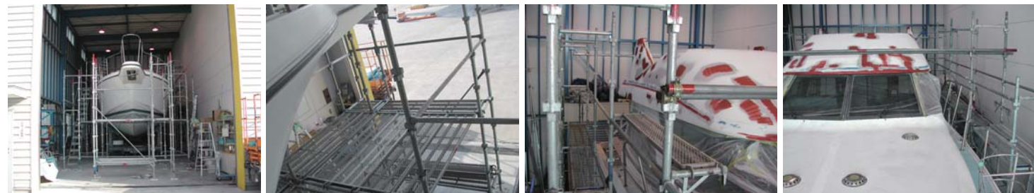
51フィートの船がすっぽりと収まっているサービス工場。まずは、足場を建てて、いよいよ作業の開始。右二枚の画像は作業途中の画像。この高さまで組んであると作業性が上がり安全だ。