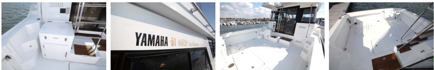
リアデッキもまさに新艇の輝き。綺麗で丁寧な下地が確実に仕上がりに生きてきている。ロゴの部分は忠実にステッカー制作。見事に貼り直し、拘り抜いている。車で培われたシビアな技術が、確実にマリンにも生かされ、高いレベルのレストアがここに完成した。