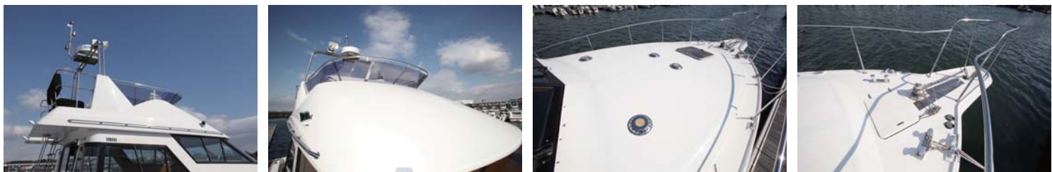
大変身したFB。とても23年前の船とは思えない。大きくて広い面もすごく綺麗で艶のある塗装面。パウテッキは当然滑り止め塗装。細かなところまで、丁寧な仕事が施されている。