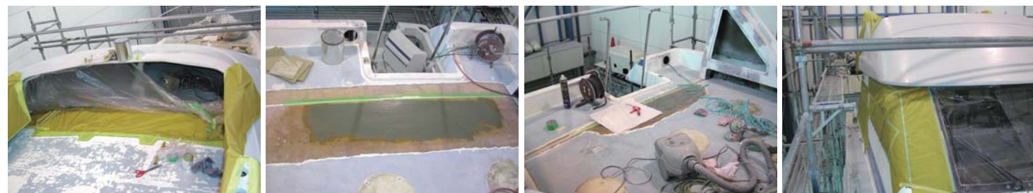
FRP等を張り直し、補強を含めた下地作業をし、なめらかな面に削り込んでいく。この辺の下地作業は車での技術が確実に生かされている。皆さんもお分かりだろうが、日本の板金塗装の技術は世界トップレベル。ましてや、ディーラーの技術は世界一といっても過言でない。