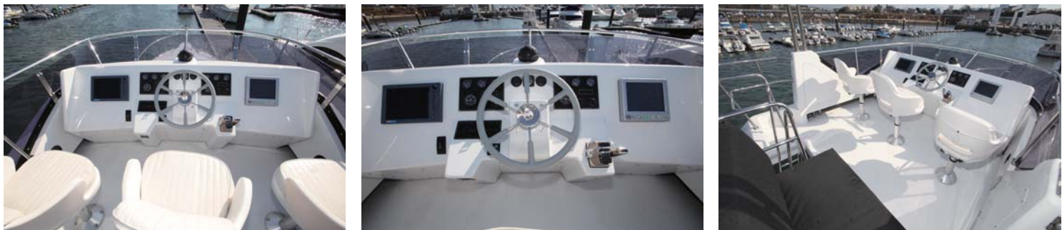
コックピットはレイアウトも変更され、電子リモコンを搭載。計器類も見やすく配置され操作性もアップされていた。床面は滑り止めの塗装が使用され、安全面の配慮も十分だ。