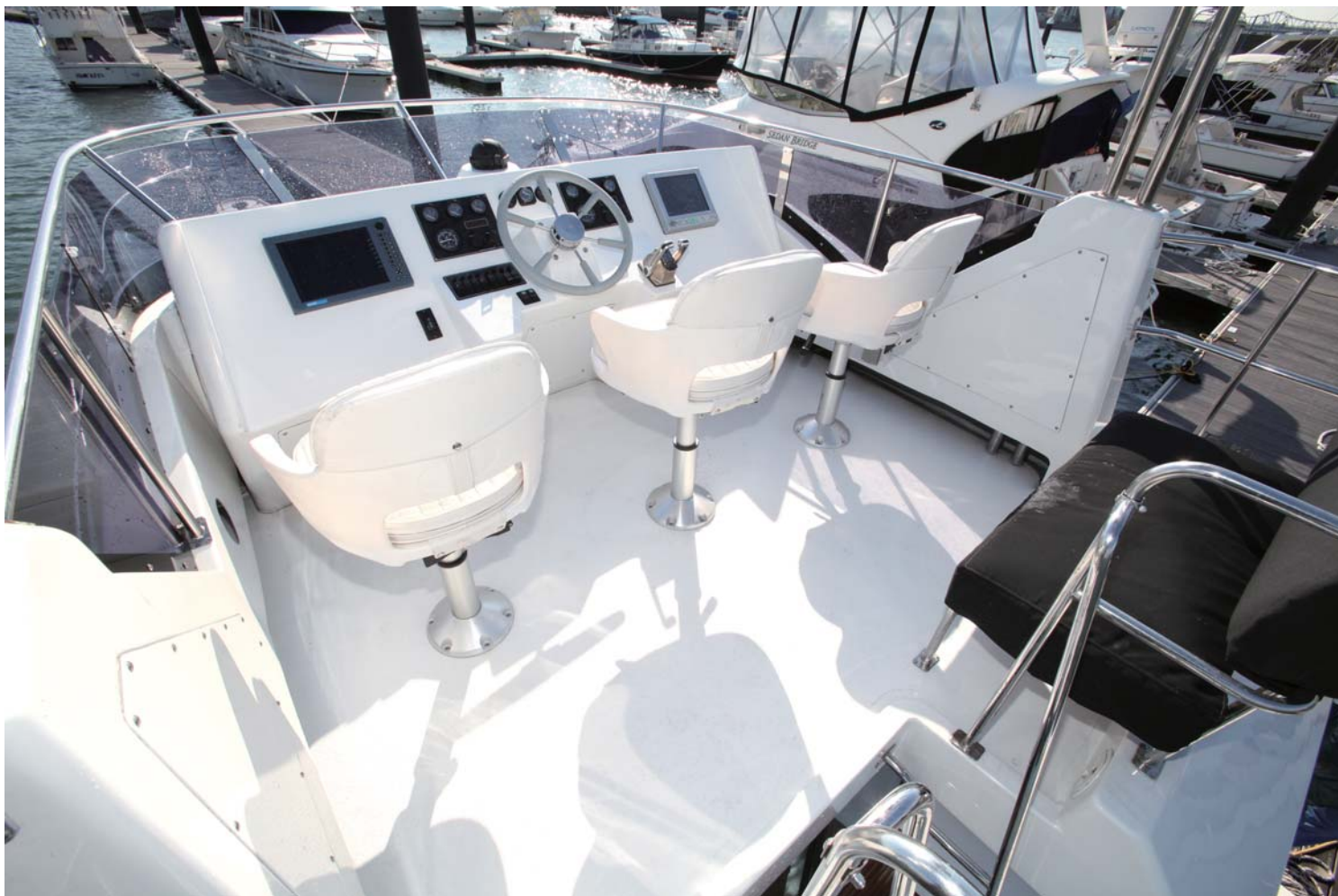
シートは新品に交換、見事に生まれ変わったヤマハSF-51のFB。航海計器は新品を設置。比較してもらえば一目でお分かりだとは思いますが、見事にレストアされ生まれ変わっている。新艇といっても過言ではない程の仕上がりがだ。