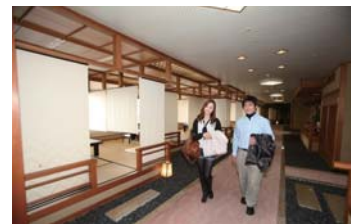
お食事は料亭街「皿小路」で頂けます。