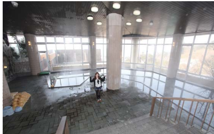
大きくて開放感あふれるパノラマ千人風呂「楽清の湯」。目の前には三河湾が広がり絶景、露天風呂も夕日が抜群に綺麗な風呂で、日が落ち始めたらここからでなくなってしまう程。