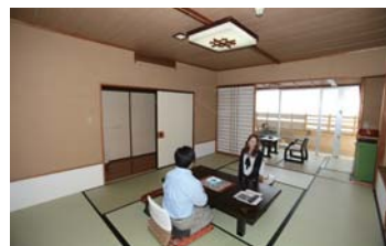
特別室には露天風呂が付いている。景色を眺めながらの自分だけの露天風呂は最高!