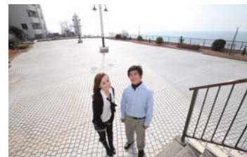
多目的なスペースでウェディングもあかも。