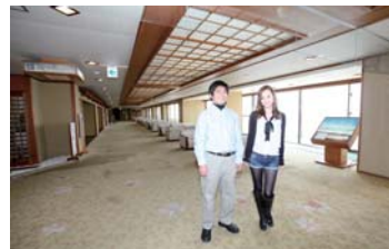
ロビーは広々としていて景色も最高!