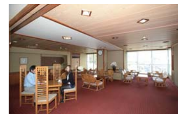
喫茶サロンで小休止もできますよ!