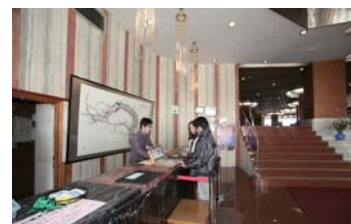
まずは、フロントで受付をします。