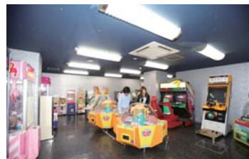
ゲームコーナーは温泉の定番ですね!