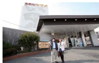
ホテルの玄関。この向こうは三河湾が一望。

★お値打ち「お立寄り屋食プラン」 ・優雅なお弁当 ・たつきオリジナルデザート ・チョコレートフォンデュとコーヒー ・「たつき」と姉妹館「葵」両館の 天然温泉ご入浴(フェイスタオル付き) お一人様 2,500円(税込み) ※限定1日20名様まで ※午前11:30分から午後2時まで (最終受付は午後1時まで)