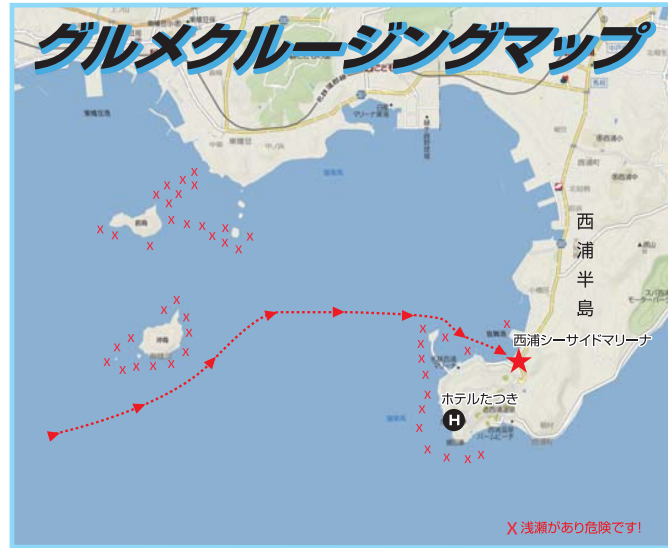
X 浅瀬があり危険です!

Y'S GEAR ウエストボート・ライフラフトジャケット (自動タイプ) ¥18,270