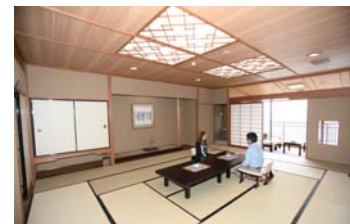
オーシャンフロントの落ち着いた客室。