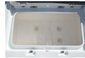
大型のイケースは200リットルの大容量、サブハッチも付いて便利。