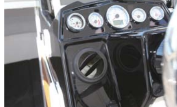
UF-29HPのオプションとして設定されているエアコンの吹き出し口。エアコンのスイッチは各種スイッチと同じ位置に取り付けられている。エアコンはBE COOLシステム。