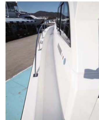
移動しやすいウォークアラウンド。