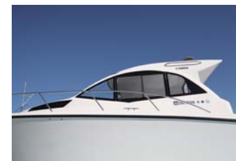
スタイリッシュなブリッジはキャビン内にゆとりを持たせている。