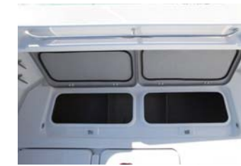
かなり広いストレージとなっている。