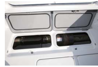
右舷側のストレージにはマフラーが通っているが小物が入りそう。