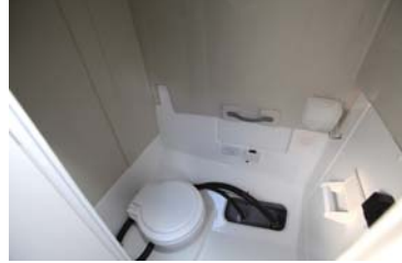
電動マリントイレは今回から標準装備となっている。