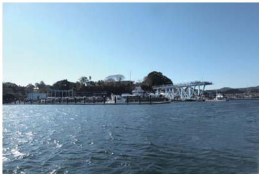
取材協力:ヤマハマリーナ浜名湖 株式会社マリコム東海〒431-0411 静岡県湖西市入出字長者1380 TEL:053-578-1114 http://www.y-m-h.co.jp/