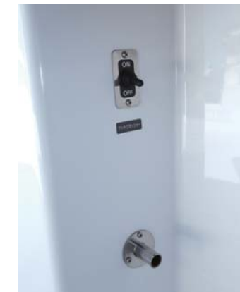
デッキウォッシュもオプションです。

この船のメインコピーは「Functional Beauty」直訳すると「機能美」となるが、フィッシングボートにビューティと付くのは本来なら疑問に思ってしまうのだが、実物を目にしてこの疑問は簡単に解き放たれた。船本来が持っているスタイリッシュなラインは、従来のフィッシングボートのイメージとは、かけ離れている。簡単にカッコイイという言葉で言い表すには失礼なくらい、かなりハイセンスなデザインにまとめられている。また、釣り機能を強化し機能性を大幅に向上させ、まさに機能美モデルという言葉がぴったりなのである。現にシャフト船のフィッシングボートの購入をお考えのユーザーの商談時に、従来のUF-29で