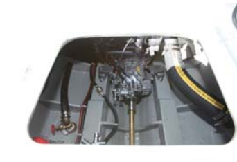
エンジンルームハッチも広く取っており、作業性に優れている。