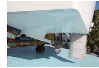
シャフトの露出が少なくフジツボ等が付き難いのが有り難い。