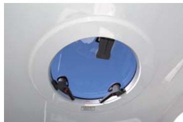
スカイライトハッチはオプション設定。