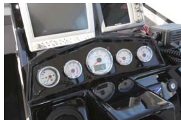
メーター類は見やすい位置に設計されている。