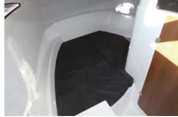
大人が横になれる広いパワースーツのクッションはオプション。