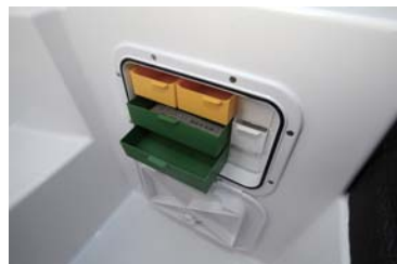
ユーティリティスペース・タックルボックスもオプション設定。