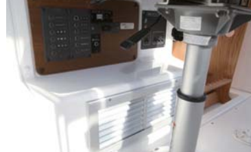
スイッチパネルはキャプテンシートの下に設置。