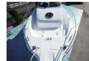
広々としたデッキスペース。キャストイングもしやすそう。