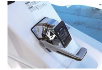
釣りに便利なフィッシングサポートリムコンはオプション。