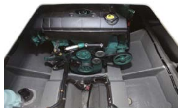
エンジンはボルボD6-330。キャビン内からメンテナンス可能。