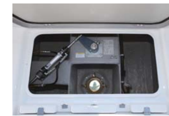
プロペラの絡みが一目で分かるのが、凄く便利。