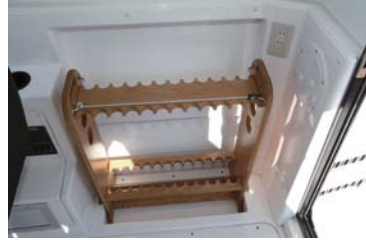
長物竿置きスペースも確保。ロッド用棚はオプション。