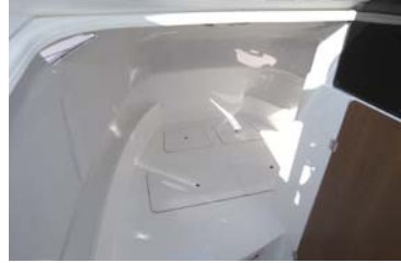
パース下はライフジャケットや釣り道具等の収納に便利。オプションでロッドハンガーが取り付けられる。