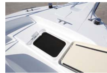
大型ロープロッカーが使いやすい位置に設けられている。