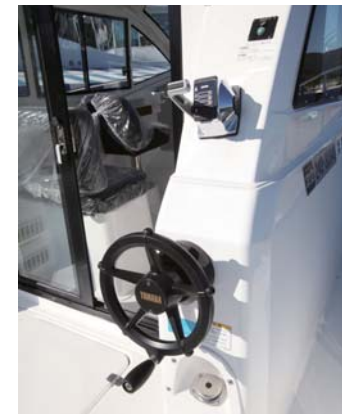
便利な2ステーションはオプションです。これは、外せません!