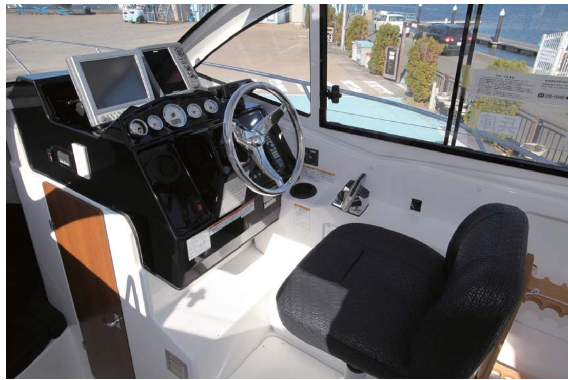
視界が広々としていて凄く乗り心地の良いコックピット。アクセルレバー、ハンドルポジションも凄くしっかりとくる位置にあり、ポイントまでのロングクルージングでも楽に行けそうだ。

は、釣りに関しては全く問題がなく、非常に釣りやすくて良いのであるが、奥様などご家族の意見を取り入れた時に、あまりにも釣り船というイメージが強すぎて、今一步、説得力に掛けてしまい、実際にこの船を提案したところ、今までにない反応を頂き、非常に商談がしやすくなったという意見が出ているのだ。当然、スタイルだけではなく、キャビン内のデザイン及び構成も好評価で全員が前を向いて座れる事は、予想以上に絶賛されている。キャビンは広々としていて、視界も広く凄く明るい。これならば、ポイントまでの移動も凄く楽しみになってくる事は間違いない。万が一、魚が釣れなくてもクルージングをしている気分で船に乗っている事が出来るのだ。この感覚は従来のフィッシングボートにはない感覚である。少し予算があってFR-32まで手が届くのであれば、話は別になるのだが、このクラスのシャフト船のフィッシングボートということであれば、かなりポイントは高い。価格は一見、値上がりかのように見えるが、シートや電動マリントイレ等が標準になっているので、実際にはお値打ちになっていることになる。エンジンに関しては2タイプ用意されていて、従来のヤマハのエンジンを搭載したUF-29Fと、新たにボルボのエンジンを搭載したUF-29HPが新設定され比較等は下記主要諸元をご覧ください。ちなみにメーカー資料によると軽荷状態での速力予想ではUF-29HPが32.4ノット。UF-29Fは29.5ノット前後となっていて、定評のUFハルを引き継ぎ、30ノットオーバーの速力性能はかなり評価が高い。また、新旧比較として、アフトデッキ面積と室内面積を大幅にアップし、多人数での釣りが楽にできるようになり、4人が前向きに座れて、さらにパウで寝る事が出来るのが大きな違いとなっている。長尺物が置けるスペースも出来ているのでこれも有り難い。エアコンに関してはパウラスターと同様になるが、UF-29HPのボルボエンジン搭載機種のみを設定となっている。フィッシングボートの新たな時代を切り開いたUF-29シリーズは沢山のマリネジャーファンの注目を浴びる事、間違いない!3月に開催されるインターナショナル横浜ボートショーに出品されるので、是非一度、実物を見て欲しい!この記事の意味がよくわかると思う。