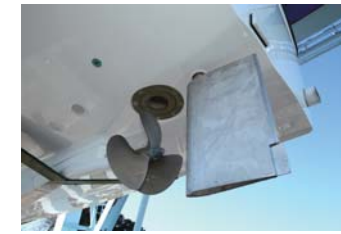
プロペラ点検口はこの位置にあり、シャフト船には必要不可欠!