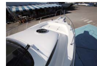
ハウデッキはセミウォークアラウンドを採用。移動のしやすさがいい。