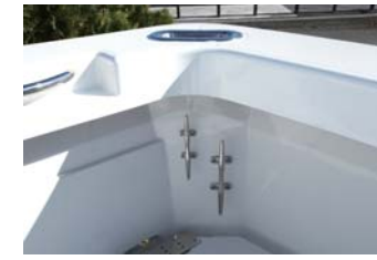
大型艇同様のムアリングホールとクリートが採用されている。