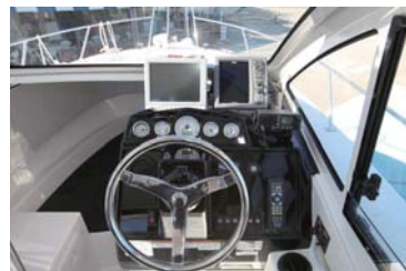
コックピットは各種装備がバランス良く配置できるようになっている。

は、釣りに関しては全く問題がなく、非常に釣りやすくて良いのであるが、奥様などご家族の意見を取り入れた時に、あまりにも釣り船というイメージが強すぎて、今一步、説得力に掛けてしまい、実際にこの船を提案したところ、今までにない反応を頂き、非常に商談がしやすくなったという意見が出ているのだ。当然、スタイルだけではなく、キャビン内のデザイン及び構成も好評価で全員が前を向いて座れる事は、予想以上に絶賛されている。キャビンは広々としていて、視界も広く凄く明るい。これならば、ポイントまでの移動も凄く楽しみになってくる事は間違いない。万が一、魚が釣れなくてもクルージングをしている気分で船に乗っている事が出来るのだ。この感覚は従来のフィッシングボートにはない感覚である。少し予算があってFR-32まで手が届くのであれば、話は別になるのだが、このクラスのシャフト船のフィッシングボートということであれば、かなりポイントは高い。価格は一見、値上がりかのように見えるが、シートや電動マリントイレ等が標準になっているので、実際にはお値打ちになっていることになる。エンジンに関しては2タイプ用意されていて、従来のヤマハのエンジンを搭載したUF-29Fと、新たにボルボのエンジンを搭載したUF-29HPが新設定され比較等は下記主要諸元をご覧ください。ちなみにメーカー資料によると軽荷状態での速力予想ではUF-29HPが32.4ノット。UF-29Fは29.5ノット前後となっていて、定評のUFハルを引き継ぎ、30ノットオーバーの速力性能はかなり評価が高い。また、新旧比較として、アフトデッキ面積と室内面積を大幅にアップし、多人数での釣りが楽にできるようになり、4人が前向きに座れて、さらにパウで寝る事が出来るのが大きな違いとなっている。長尺物が置けるスペースも出来ているのでこれも有り難い。エアコンに関してはパウラスターと同様になるが、UF-29HPのボルボエンジン搭載機種のみを設定となっている。フィッシングボートの新たな時代を切り開いたUF-29シリーズは沢山のマリネジャーファンの注目を浴びる事、間違いない!3月に開催されるインターナショナル横浜ボートショーに出品されるので、是非一度、実物を見て欲しい!この記事の意味がよくわかると思う。