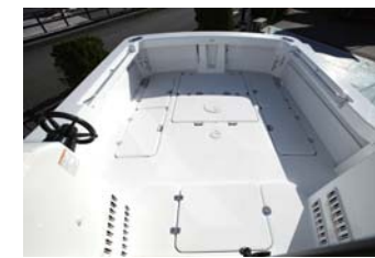
スターンデッキはフラットになっていて、上位クラスと同等の長さ。