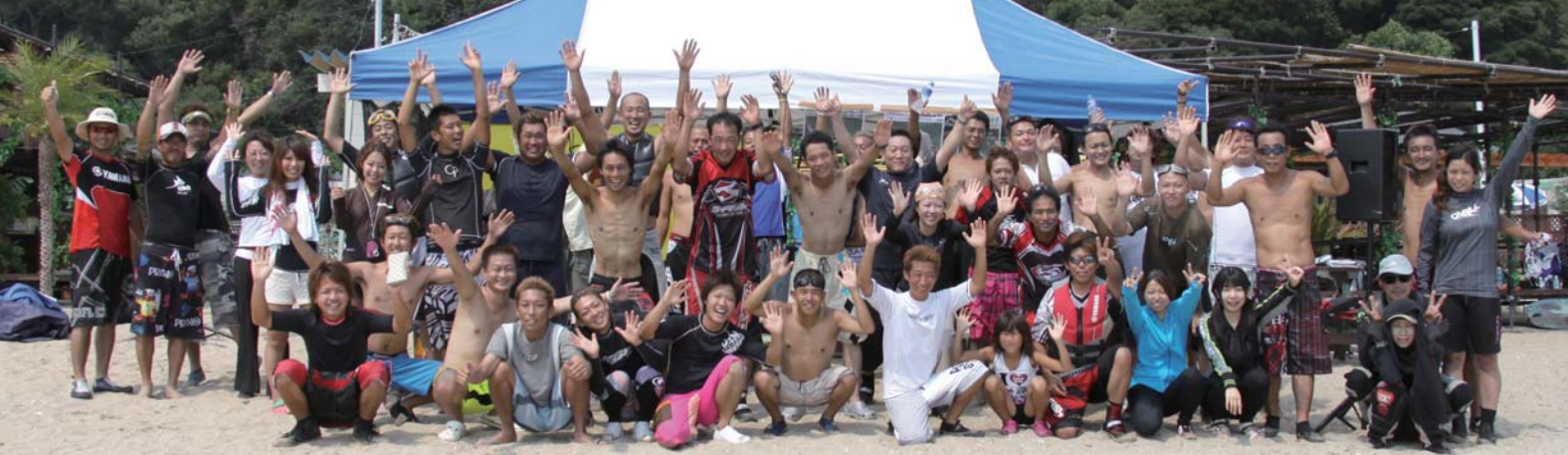
special thanks/マリンショップアルファ http://www.marinejet.co.jp/

天気は快晴!島も海もピッカピカにきれいでこれ以上ないマリンジェット大運動会日和でした。たくさんの賞品が用意されて、いざ開幕。まずは、チームメンバーが搭乗したバナナボートをマリンジェットで引っ張る「バナナボート・タイムトライアル」。スタートゲートを通してパイを回って再びスタートゲートへ戻ってくるタイムを争うという単純そうな競技ですが…、意外と落ちずに帰還するのは難しい。。。ゆっくり引っ張りすぎるとよいタイムが出ない。参加選手にとってはジレンマとの戦いです。浜で待つ他チームの皆さんも「落ちる!!!…落ちる!!!」と思っていたかどうかはわかりませんが…。(笑) 熱い視線で見守っています。スタートしてからパイまでの直線はどのチームも問題なく通過。しかし、パイに差し掛かりUターンしようとする…落水。落水しないようにスピードを落とすとタイムが出ない。単純な競技ですが、メチャクチャ奥が深いと皆さん盛り上がりおりました。つづいては「JET リレー」。マリンジェットで三河大島を1周回って次は次の走者にバトン(ゼッケン)を渡して、バトンを受け取った選手はまた三河大島を1周…、バトンの受け渡しなどチームワークが必要となるレース。さらに波のある海上を走破するためマリンジェットのライディングテクニックも順位を大きく左右する。島の裏側を走るマシンの姿は見えず、帰ってくるたびに順位の入れ替わりなどもあり各チーム一喜一憂して、とても盛り上がりました。さて、第3競技は「LOVE&LOVE レース」。男女1組になり、二人三脚で走った後で三河大島を1周タンデムライディング。さらに帰ってきたら男性が女性を抱きかかえてのRUNが残っています。楽しそうに見えて、実はかなり(男性にとっては笑)過酷なレース。二人三脚では、各チームそれぞれの差はなくマリンジェットにまたがり島1周…、タンデムライディング…彼女を落とすってしまったら後でどんな仕打ちが待っているかわかりません(笑)のであまりムチャな走りはできません。急いで帰ってきたら今度は彼女を抱え