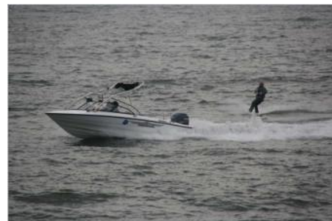
ZUCKYさんウェイクデモ