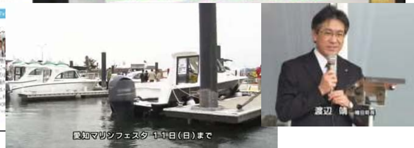
4月9日ニュース番組