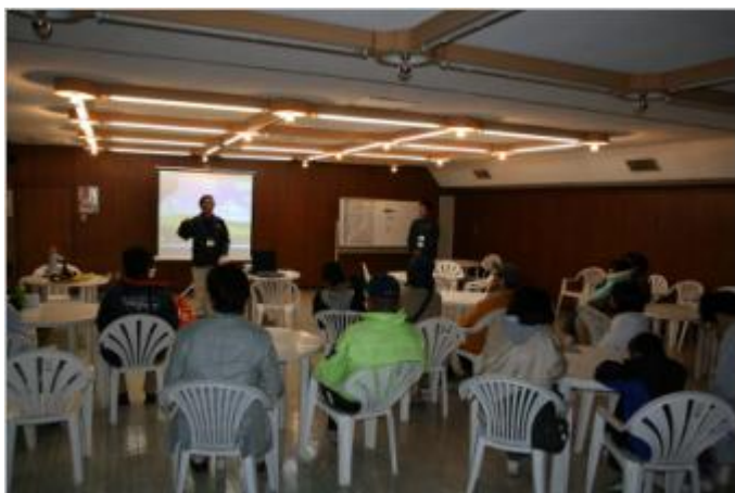
スナメリ観察会座学生態講義