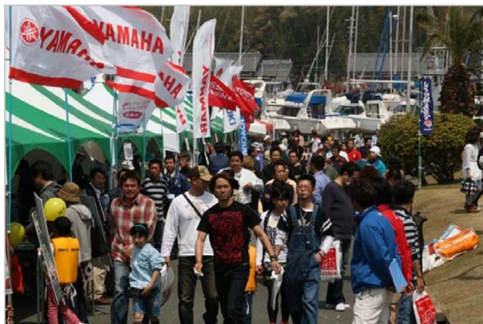
会場出展テント前