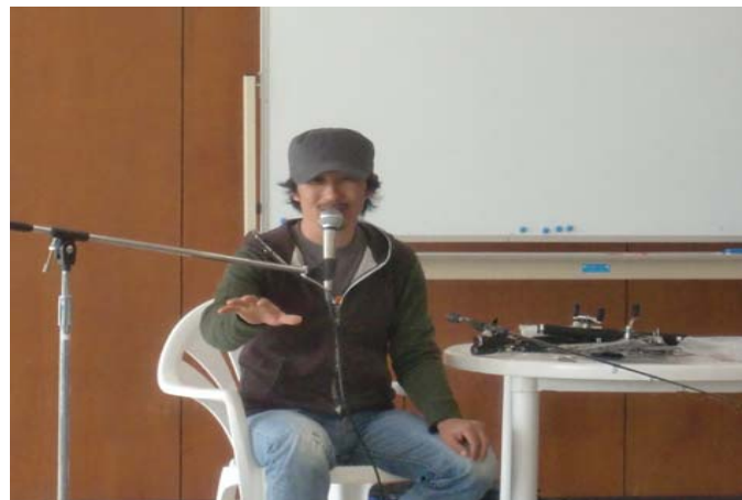
並木プロトークショー