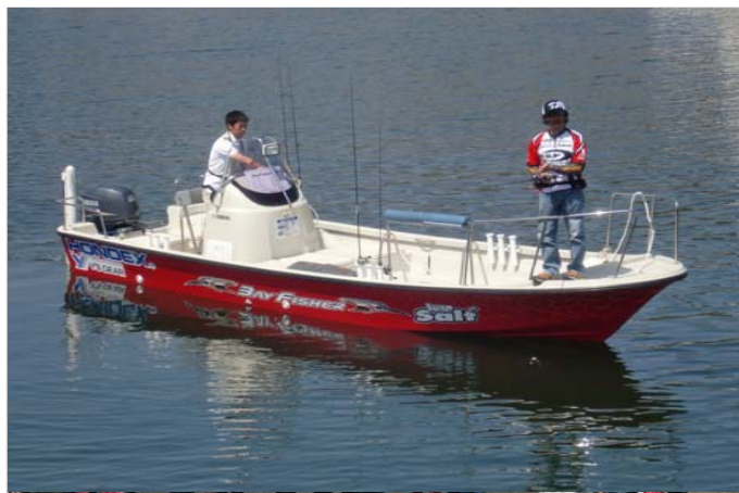
並木プロフィッシングセミナー