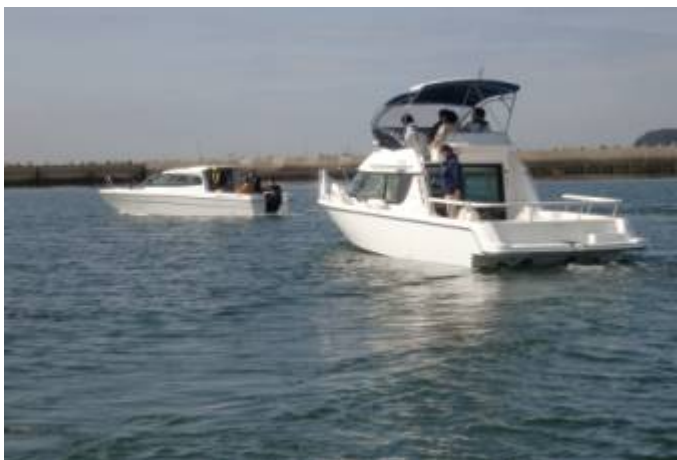
スナメリ観察会へ出航