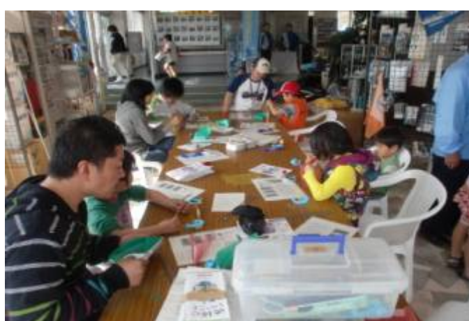
ボート不思議発見セミナー