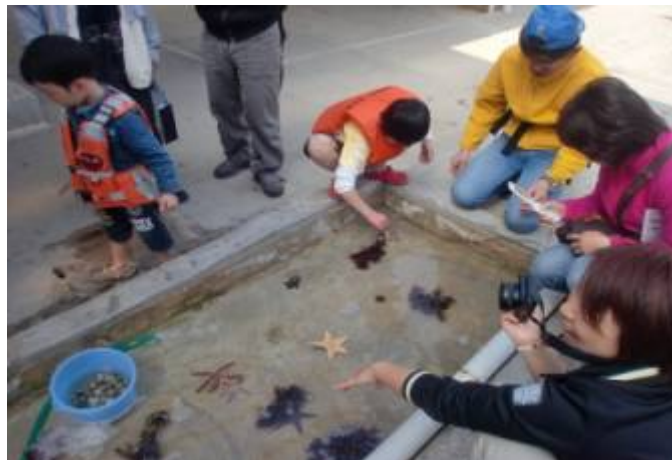
無人島上陸海洋生物学習